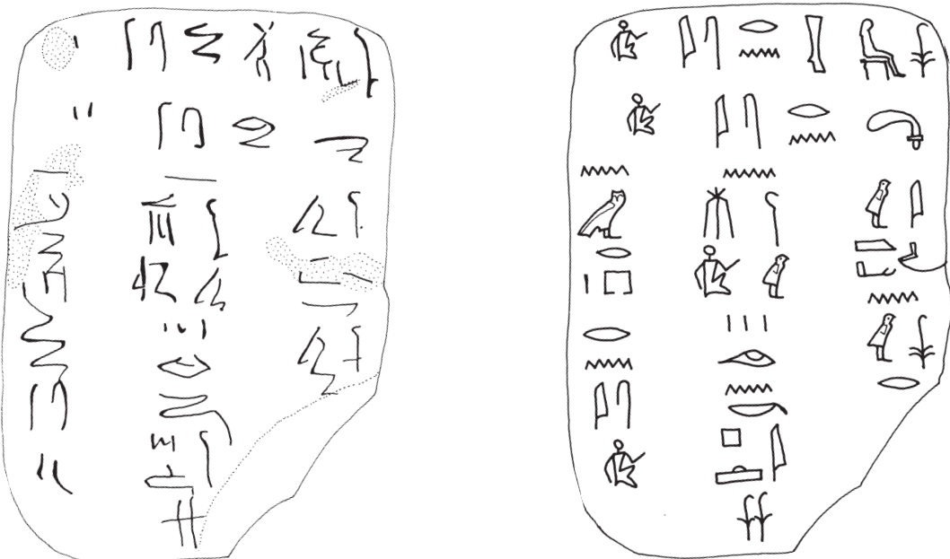
Fig. 2. Tablette n° 4965.