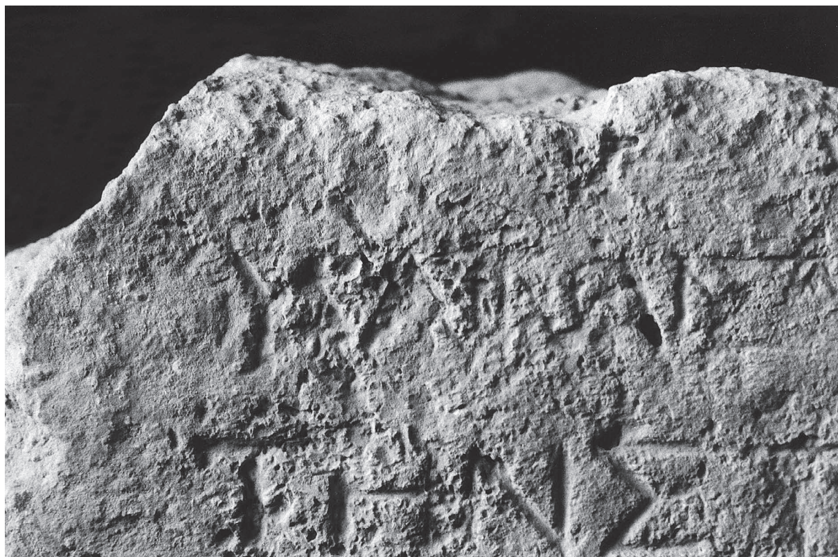
Fig. 2. Détail du début de la ligne 1.