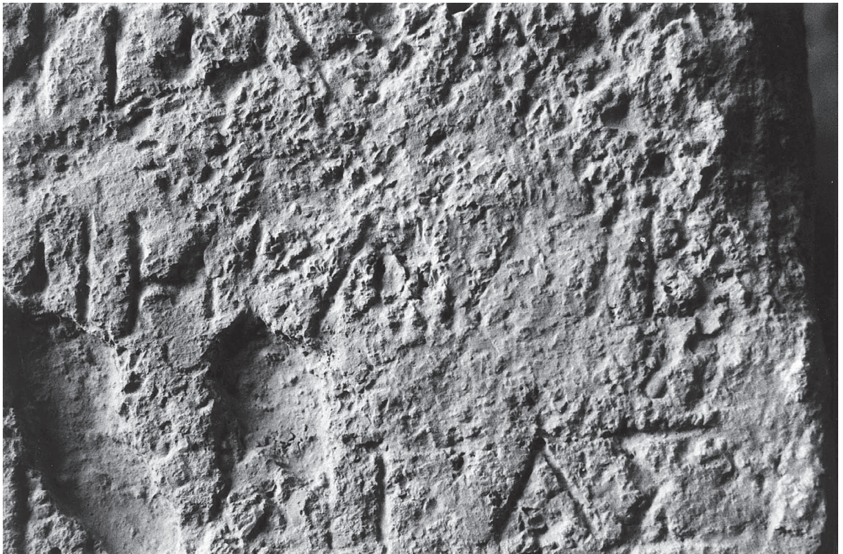
Fig. 4. Détail de la ligne 4.