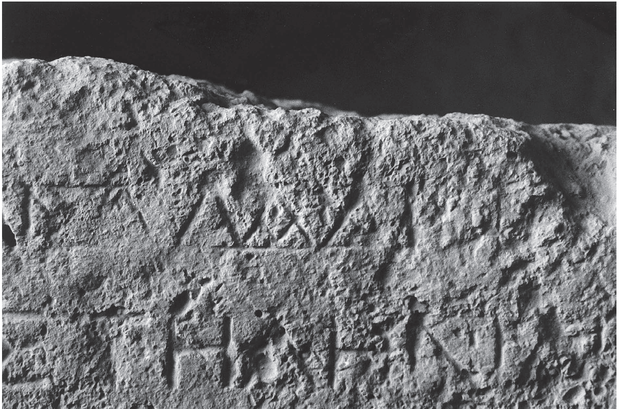
Fig. 3. Détail de la fin de la ligne 1.