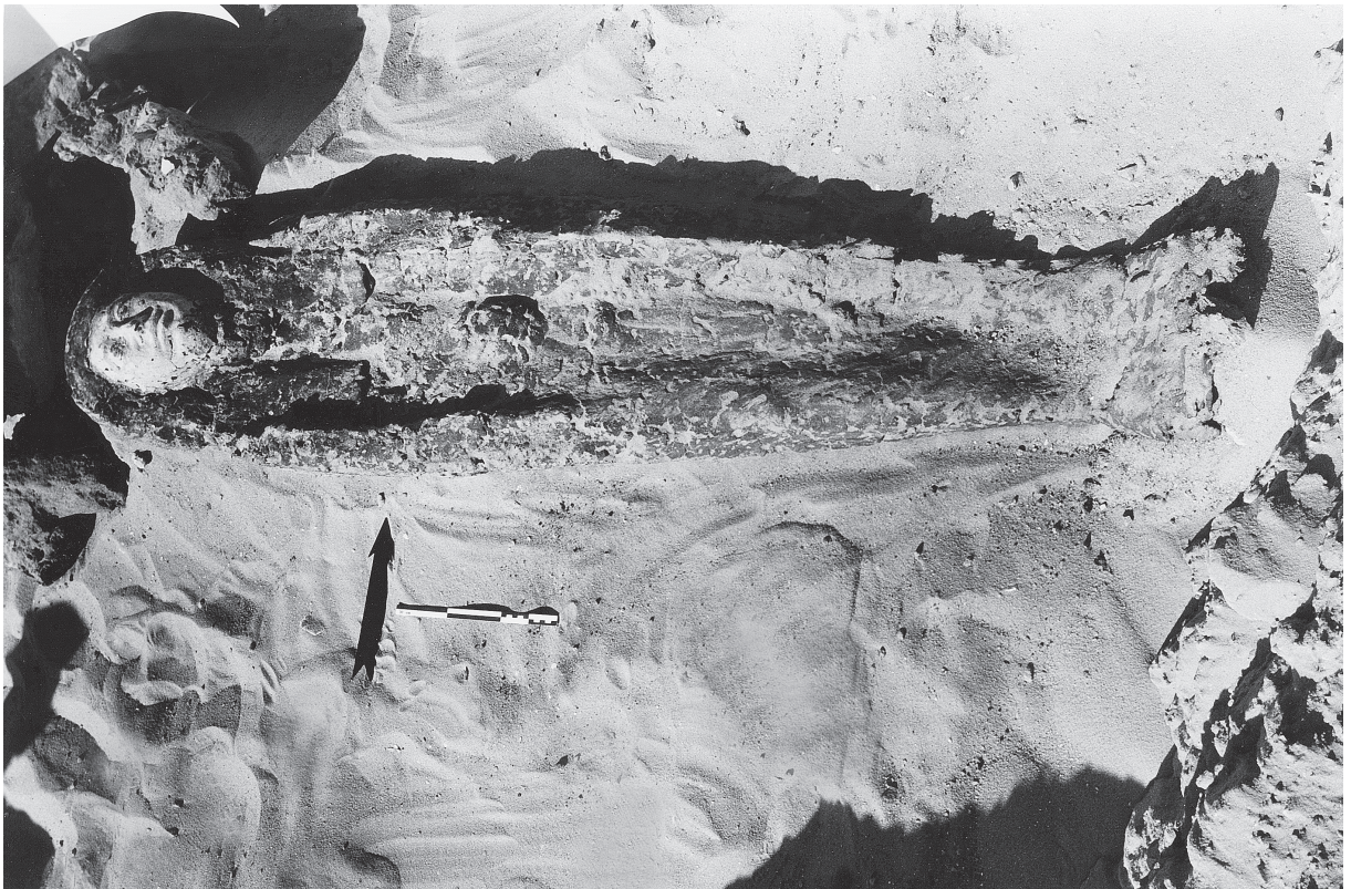
Fig. 7. Sarcophage en mouna sur armature de bois enduit de résine in situ (cliché D. Rebord).