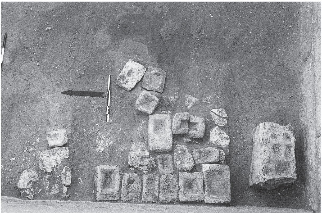
Fig. 12. Les nombreux bassins en calcaire encore en place dans la cour à offrandes.