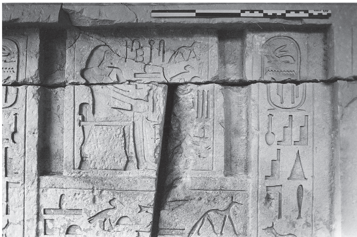
Fig. 15. Pancarte de la stèle fausse-porte décorant le mur ouest du mastaba E 17.