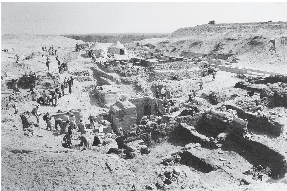
Fig. 2. Vue générale du site depuis l'ouest, en 1996.