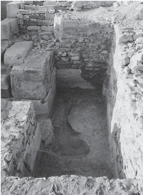
Fig. 11. Emplacement de la chapelle d'Akhetetep A restitué par des murs en pierres sèches.