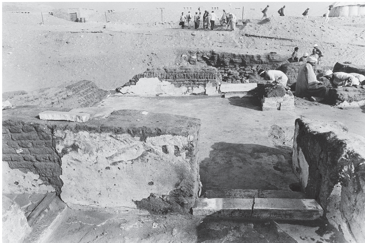
Fig. 5. Détail du secteur copte sud-est : murs recouverts d'enduit, base de pilastre géminé.