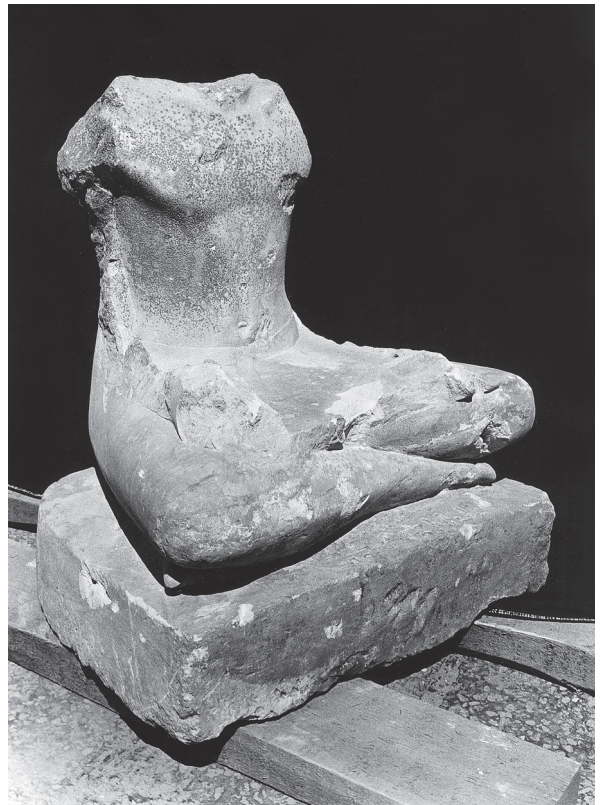
Fig. 14. Statue d'Akhethetep dans l'attitude du scribe.