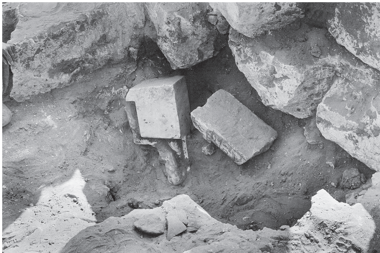
Fig. 9. Statue assise d'Akhethetep lors de sa découverte dans la fosse au sud-ouest de la chapelle A.