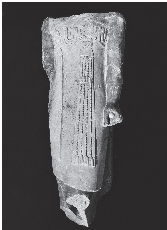
Fig. 10. Statue debout anépigraphe.