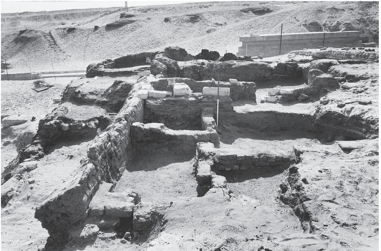
Fig. 6. Détail des niveaux coptes du secteur ouest (cliché D. Rebord).