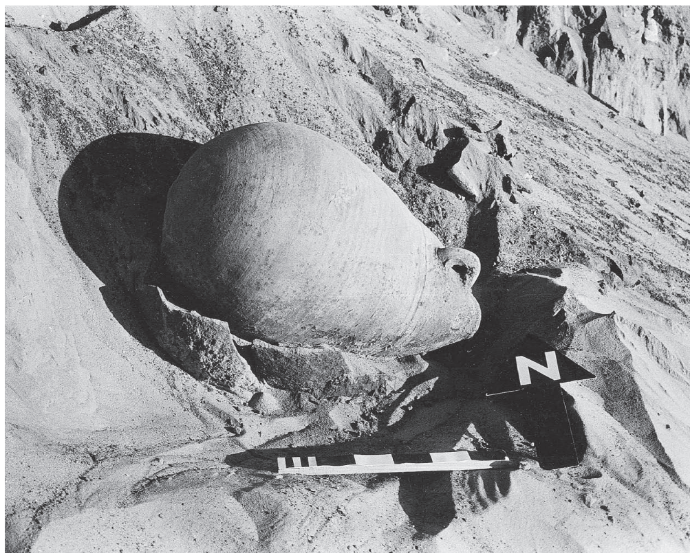
Fig. 16. Céramique en place dans la couche des inhumations de Basse Époque.