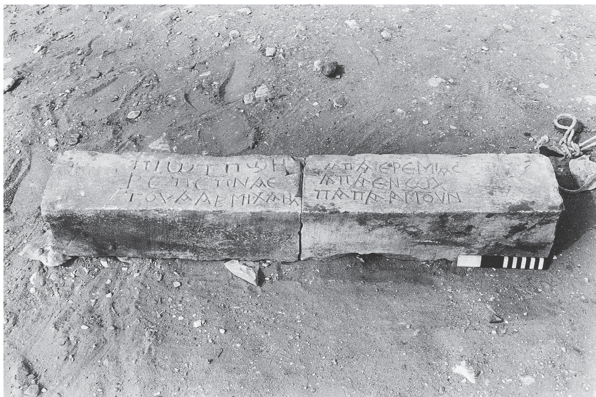
Fig. 4. Découverte d'un linteau inscrit en copte dans le secteur nord-est.