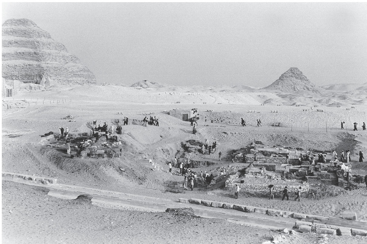
Fig. 1. Vue générale du site depuis le sud, en 1996.