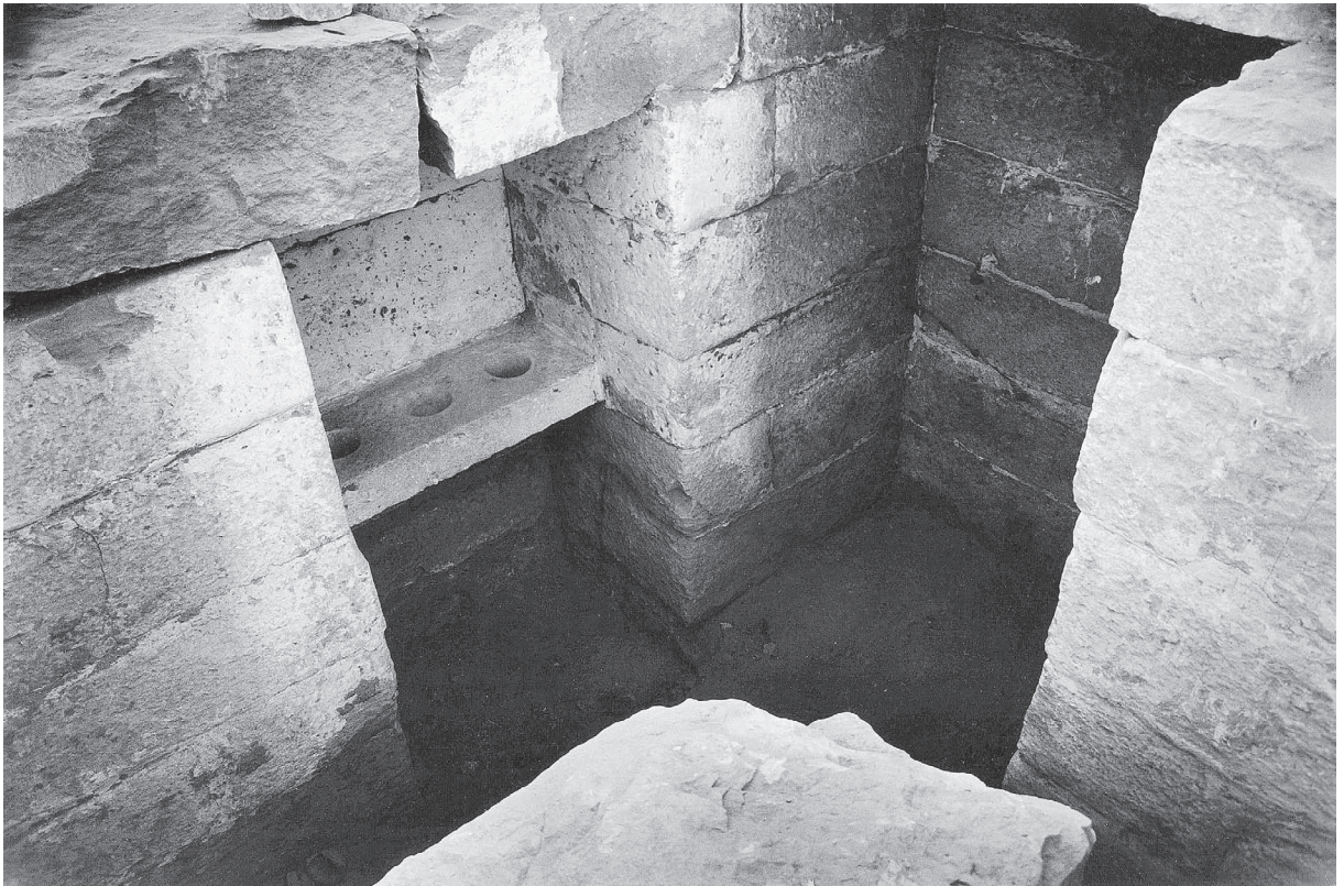
Fig. 13. La chapelle B : détail de la table à offrandes.