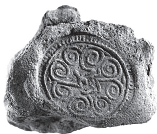
Fig. 3. Grosse estampille combinant lézard et spirales (6140).

Parmi les cylindres, ou plutôt, presque toujours, les empreintes de cylindres, découverts à Balat, rares sont les objets de facture memphite associant à la titulature royale une fonction aulique; le rang le plus élevé qui y soit attesté est celui de šps-nswt 4 . Les noms et titres de Pépi I er et Pépi II sont présents sur plusieurs autres empreintes, combinés avec des titres privés souvent fragmentaires. Ces objets officiels sont à distinguer des sceaux royaux de modestes dimensions et de moyenne qualité, qui apparaissent sur la ville ou sur la nécropole, sans indication de titre ou de rang conservée. Ces derniers, si l'on se fonde sur la disposition des motifs et la paléographie, peuvent être de facture locale: les signes malingres, aux contours incertains ou inexacts, l'occupation un peu maladroite du champ à décorer, trahissent peu de familiarité avec la gravure hiéroglyphique [fig. 1]. Malgré cela, ils semblent, d'après leur distribution, réservés au gouverneur ou à sa proche famille. Il faut donc distinguer ces exemplaires à «vrai» texte des cylindres qui reprennent des motifs royaux symboliques comme le roseau et l'abeille, ou deux Horus affrontés de part et d'autre d'un signe ankh [fig. 2]. Ces motifs illustrent une habitude des fonctionnaires de cette époque répandue dans toute l'Égypte: utiliser des signes graphiques, symboles flatteurs, comme motifs décoratifs sur leurs sceaux 5 .