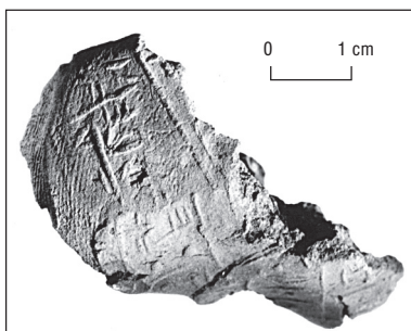
Fig. 1. Sceau royal au serekh de Pépi II ntj-h'w , de facture locale (5036).