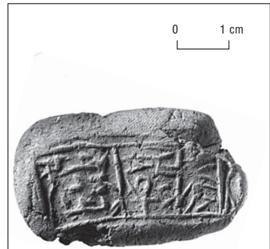
Fig. 4. Tablette portant empreinte d'un petit cylindre (« sample-sealing », 4774).

Que dire enfin des quelques impressions faites sur les scellements à l'ongle ou en imprimant sur l'argile fraîche une simple ficelle? Elles renvoient sans doute aussi à des personnages dénués d'identificateur. Même si ces pratiques ne concernent que le secteur périphérique, c'est-à-dire la nécropole (mastaba de Khentika), elles témoignent d'un contrôle administratif pour le moins relâché. On a l'impression que la répartition des tâches et des biens reflétée par l'usage des sceaux finit par concerner des individus bien éloignés du corps administratif, échappant à son emprise. Ainsi l'examen des sceaux et scellements rend-il compte d'un vaste spectre d'utilisateurs: d'une part de grands fonctionnaires amateurs de beaux objets, d'autre part des subalternes pouvant assumer certaines responsabilités, même sans être pourvus de marqueurs d'identité.