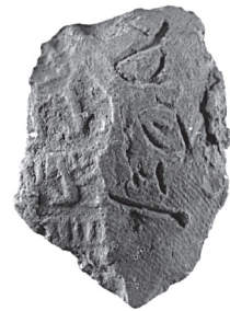
Fig. 6. Scellement portant une note en hiéroglyphes à côté d'une empreinte de cylindre (4814).