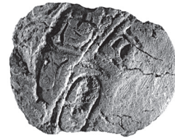
Fig. 5. Empreinte en creux produite par le « sample-sealing » d'un petit sceau aux serekh et cartouche de Pépi II (4789).