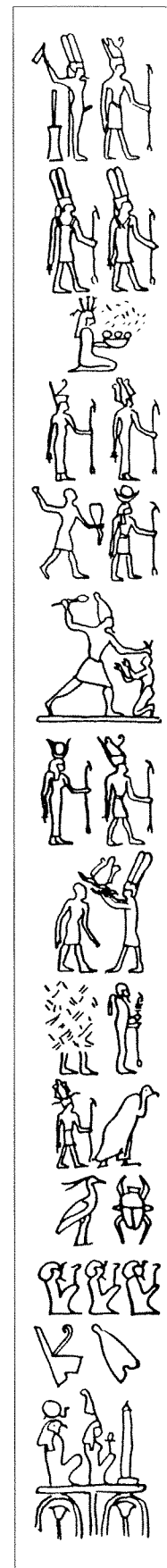
Fig. 1. ▸ Abydos-Osireion - salle du sarcophage, registre supérieur, colonne centrale ; d'après le dessin de W. Emery dans H. FRANKFORT, The Cenotaph of Sethi I at Abydos , EEF 39, 1933, pl. LXXIV

Le premier d'entre eux est introduit par le hiéroglyphe représentant un personnage coiffé du pschent , le pharaon, valant Hr par représentation directe. Les quatre signes suivants donnent le nom d'Horus du roi bien attesté par