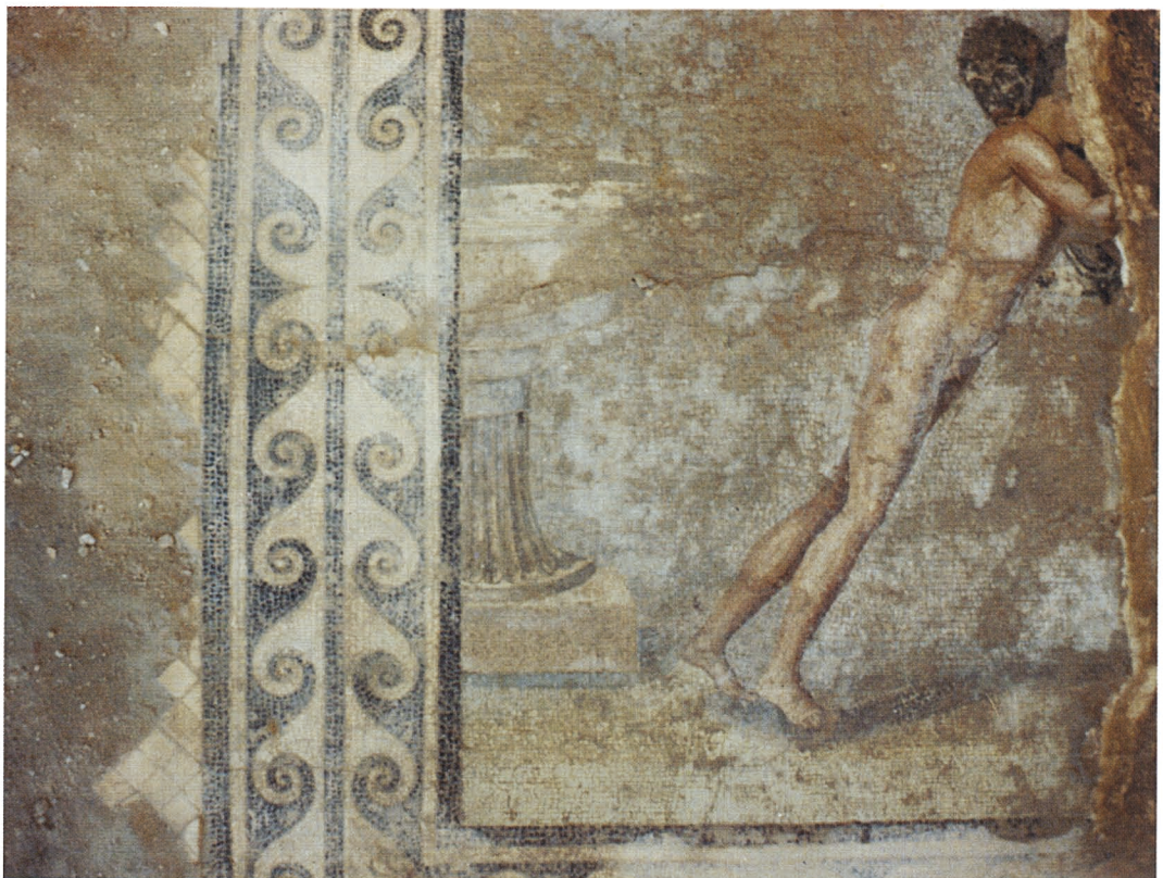
D. Détail de la mosaïque aux lutteurs.