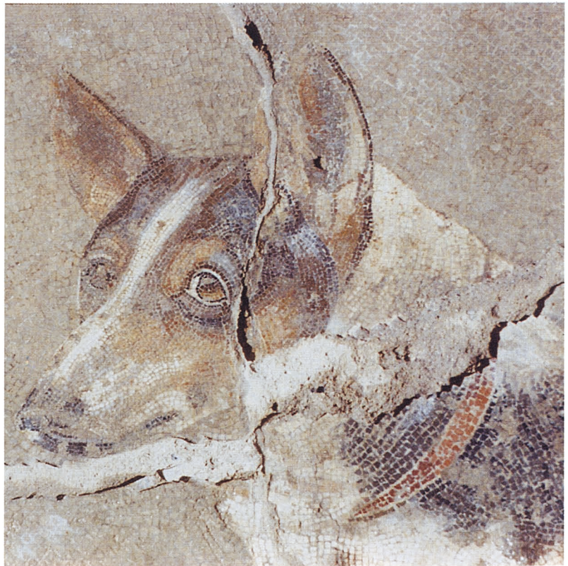
B. Détail de la mosaïque au chien.