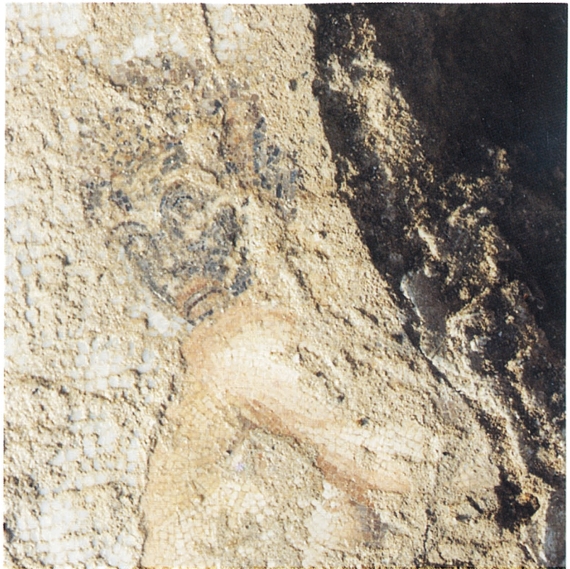
C. Mosaïque aux lutteurs.