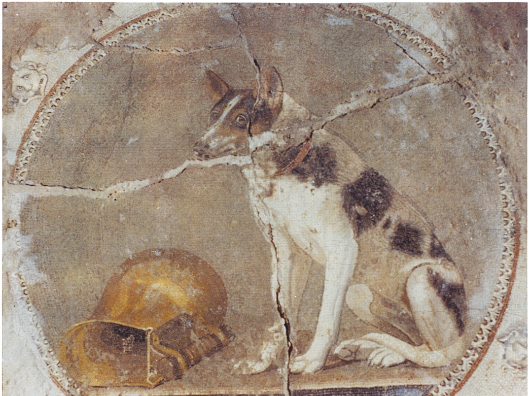
A. Mosaïque au chien.