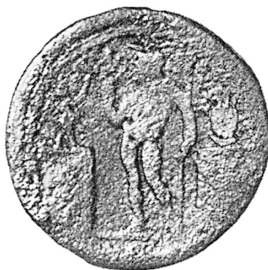
B. — Zeus Casios de Péluse, coiffé du hemhem , sur une monnaie du nome, époque antonine (type du n° 909 Dattari, 612 Geissen).