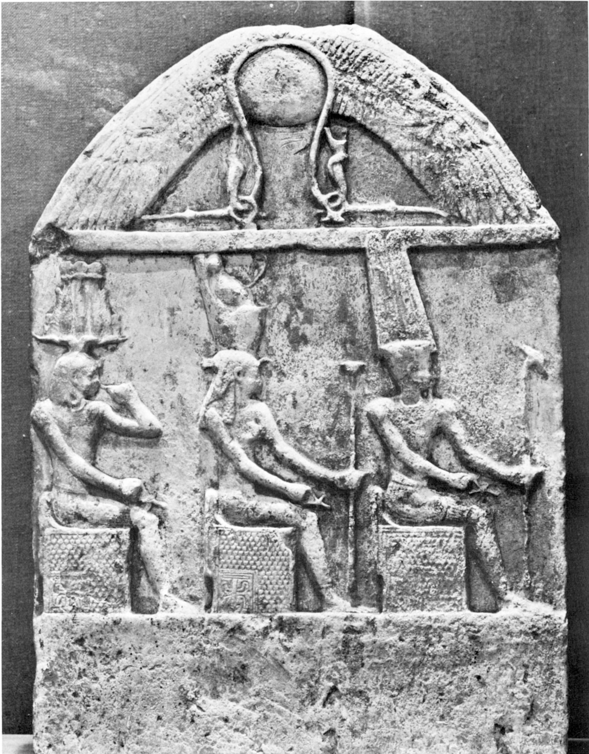
Stèle représentant la triade thébaine : Amon et Mout classiques, Khonsou l'Enfant vêtu du pagne et couronné du hemhem , époque ptolémaïque. (Collection particulière.)