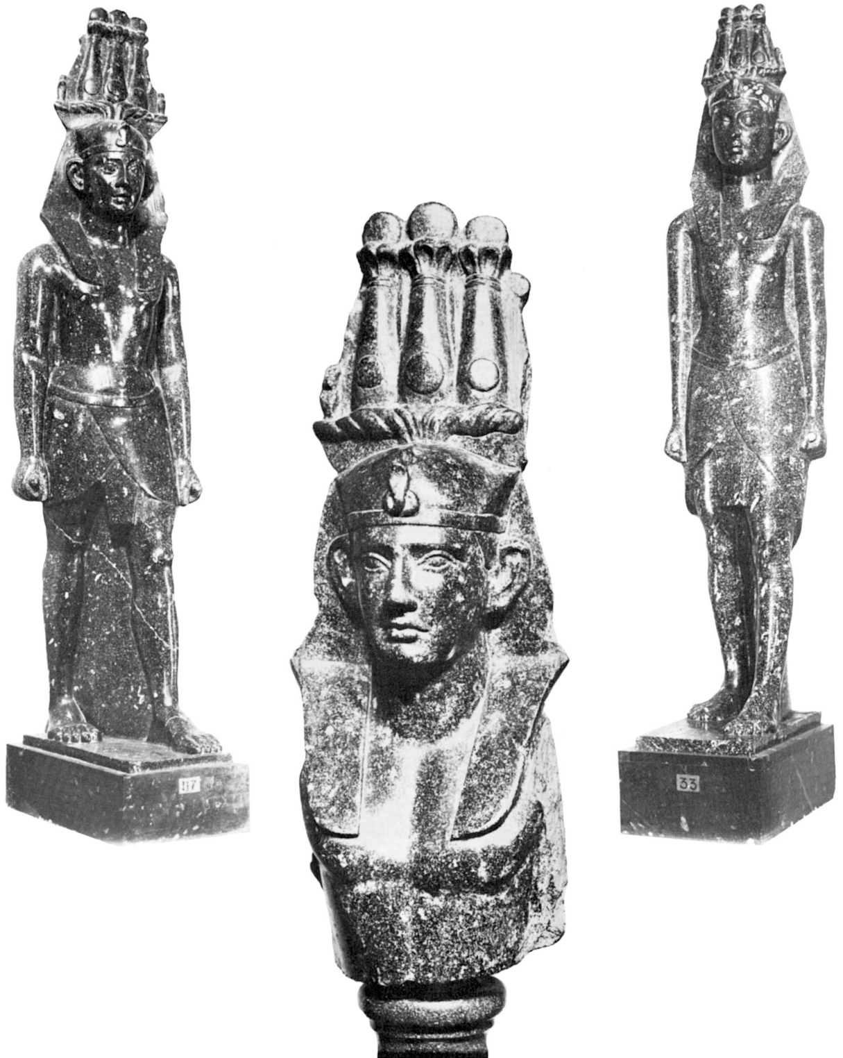
Les trois statues de la villa di Cassio portant le cimier hemhem .