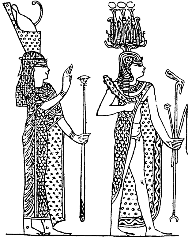
Fig. 2. — Détail de la « tunique historiée de Saqqara » : devant Mout (Héra) classique, Khonsou l'Enfant (Héraclès) couronné du hemhem et tenant la massue. Saqqara, époque romaine. (Musée du Caire, JE 59117.)

Or, au moins dans l'Égypte d'époque impériale, une quatrième divinité particulière, connue comme un Horus jeune cette fois, mais qui eut aussi sans doute un aspect harpocratien, paraît avoir reçu le cimier hemhem comme signe distinctif. C'est l'étrange Zeus Casios de Péluse, un Zeus qui se classait après Harpocrate, Horus, Agathos Théos, et avant Apollon et Dionysos, dans une liste de dieux fils gravée à Athènes au III e siècle ap. J.-C. 50 . L'effigie de ce Zeus Casios, bien connue par les monnaies du nome de Péluse (pl. XVII/B), est celle d'un homme jeune, apollinien (c'est Achille Tatios qui le dit, vers la fin du II e siècle ap. J.-C.) et coiffé de la couronne hemhem ; celle-ci figure,