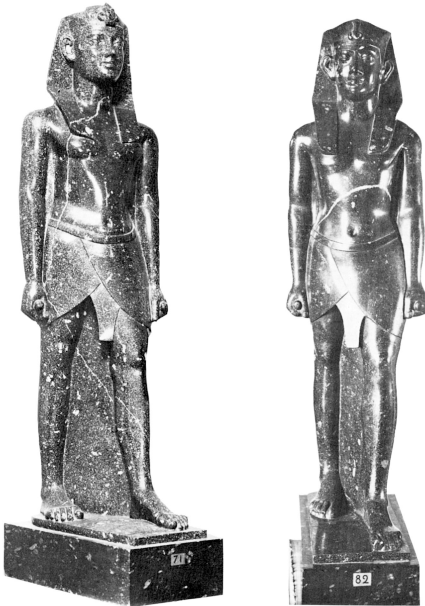
Deux des statues coiffées du némès trouvées à la Villa di Cassio (la troisième, restaurée, n'est pas reproduite ici).