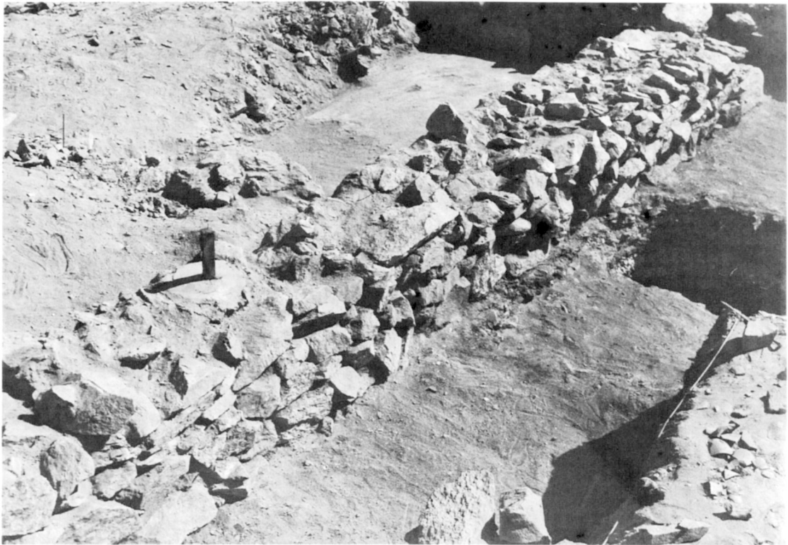
A. — Sondage I : Le mur C-D, le point b7 , chambre I.