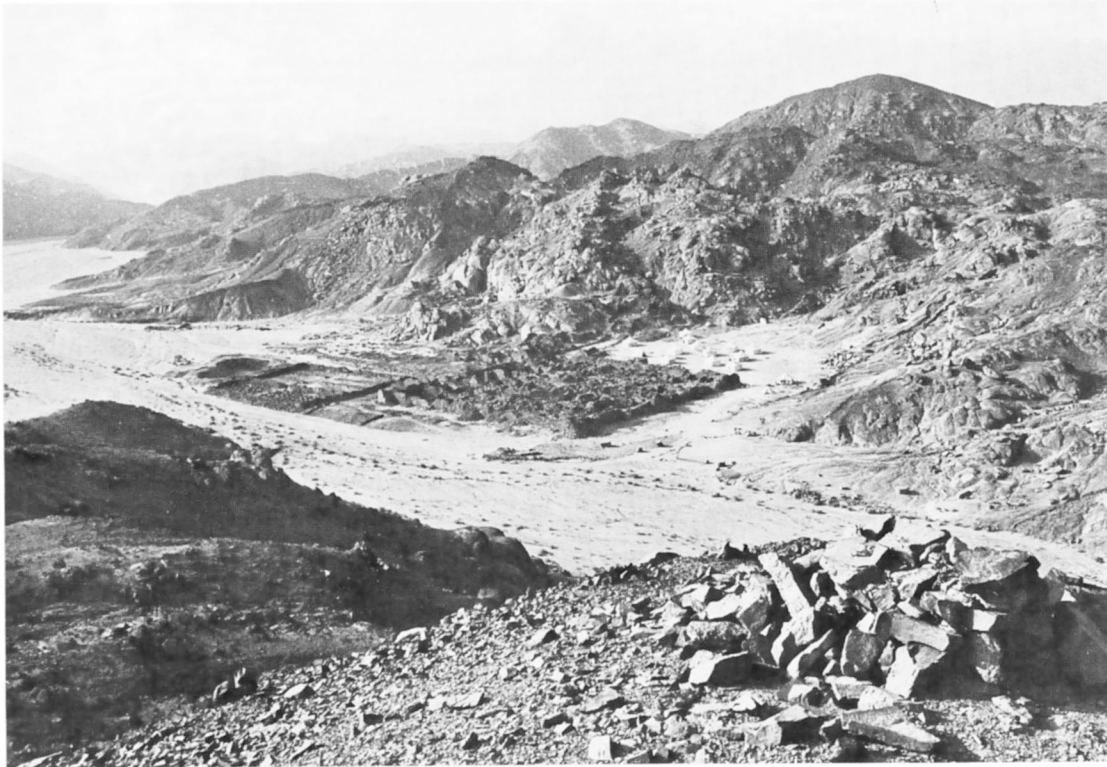
A. — Vue générale du site.