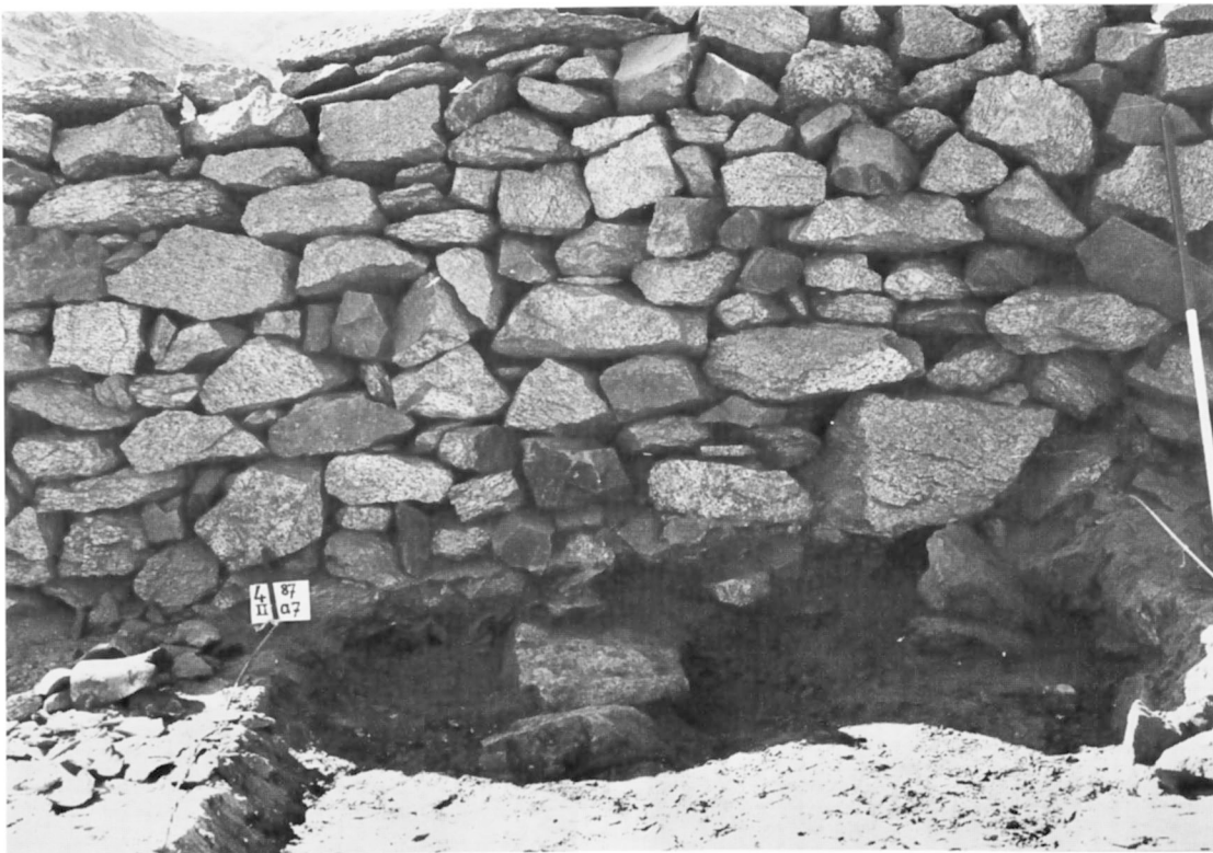
B. — Sondage I : Début de fouille. Le mur du thésaurus.