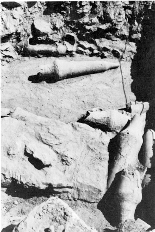
B. — Sondage I : Chambre I et passage vers la chambre II.