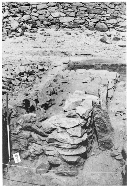
C. — Sondage II : Angle C de l'édifice vu vers le nord (fouille au niv. 3.47).