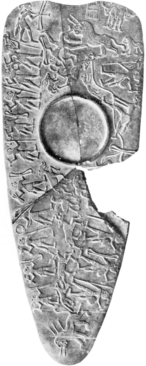
B. — Palette de la chasse reconstituée.