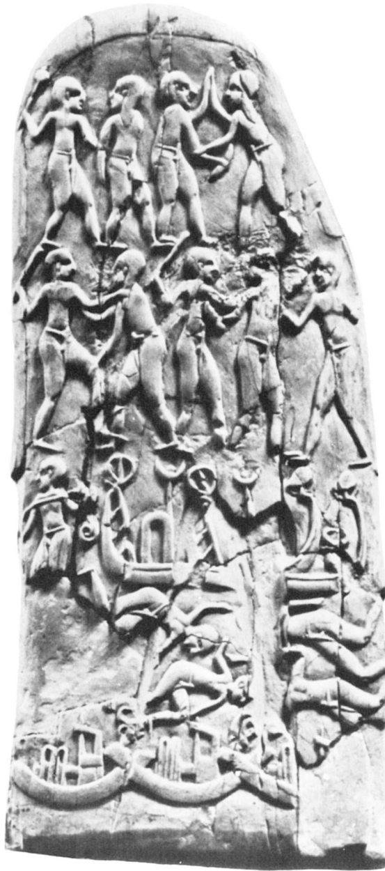
Manche du couteau du Gebel el-Arak.