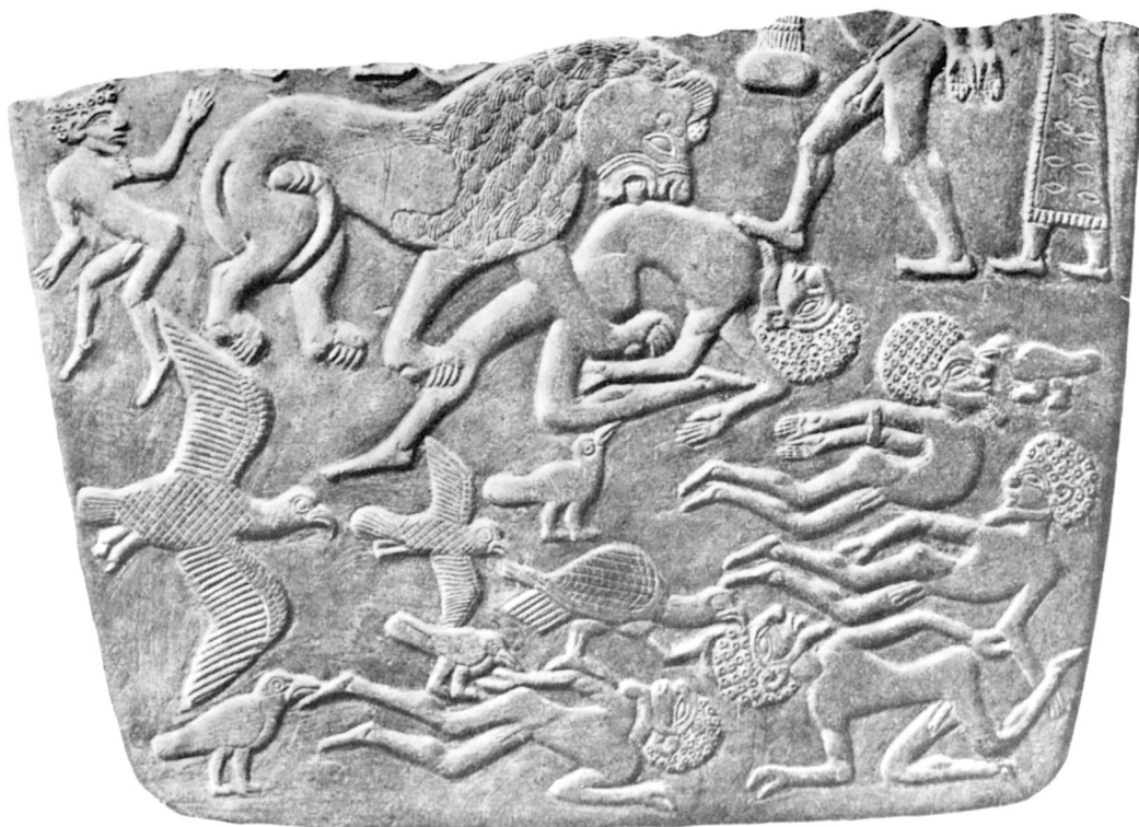
A. — Palette aux Vautours.