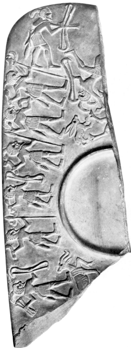
A. — Palette de la chasse. Fragment du Musée du Louvre.