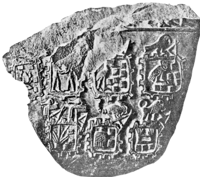
B. — Palette du « Tribut Libyen ».