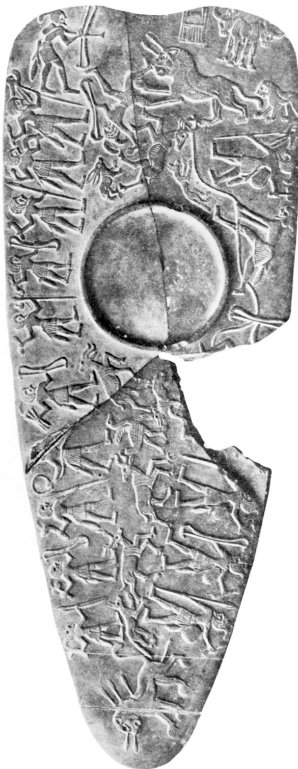
B. — Palette de la chasse reconstituée.