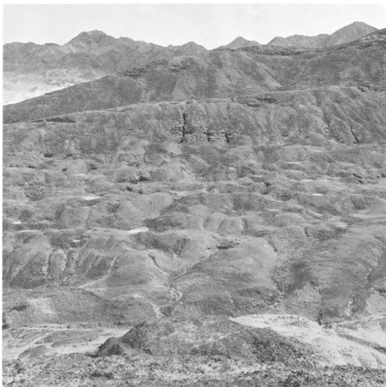
A. — Secteur minier du Gebel Zeit. Vue generale.