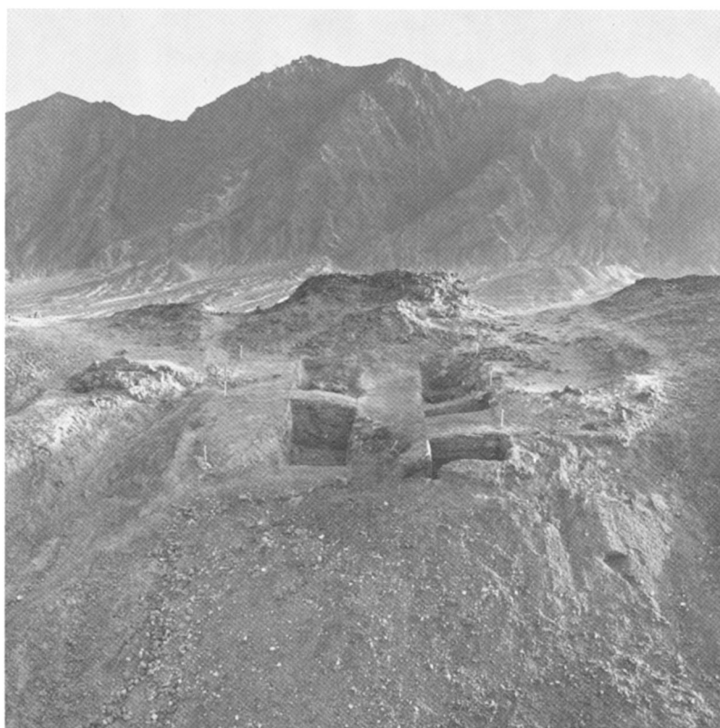
B. — Gebel Zeit. Fouille du sanctuaire.