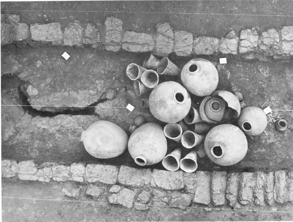
A. — Balat, mastaba II. Vases dans le magasin Nord-Est.