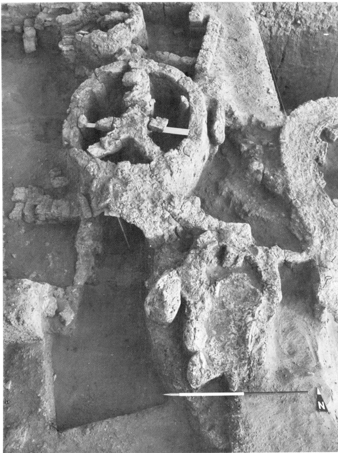
Ain Asyl. Four de potier.