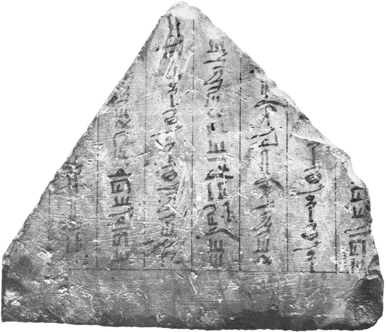
Fragment du tombeau de Dagi à Thèbes.