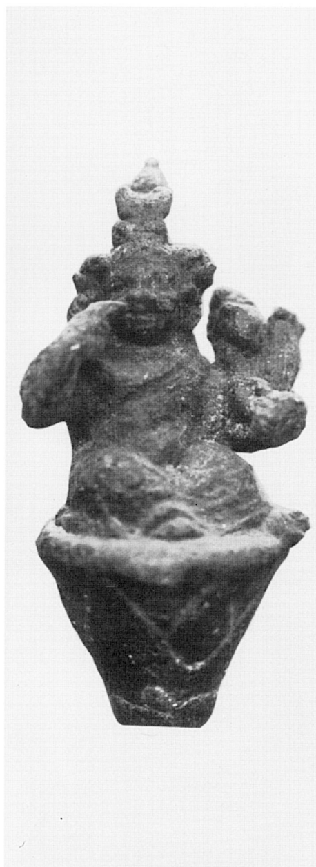
B. — Inv. n° 22.391, bronze, Musée Gréco-Romain, Alexandrie.