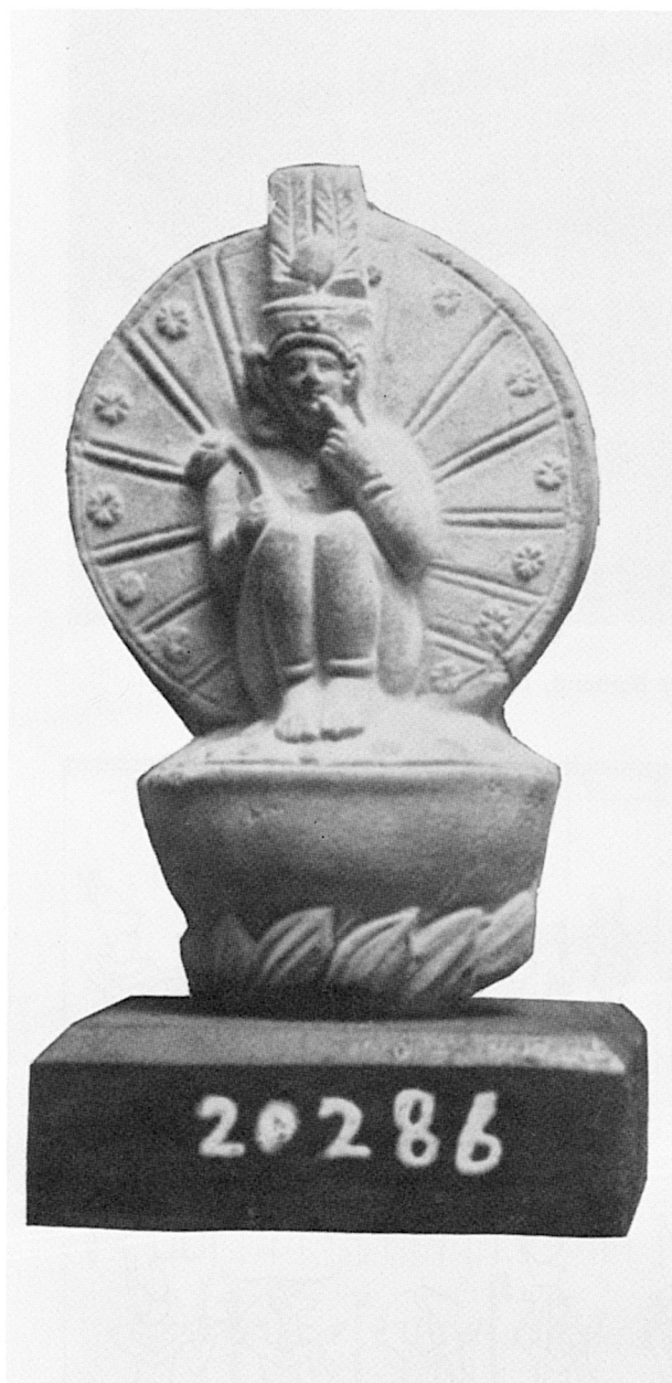
A. — Inv. n° 20.286. Terre cuite, Musée Gréco-Romain, Alexandrie.