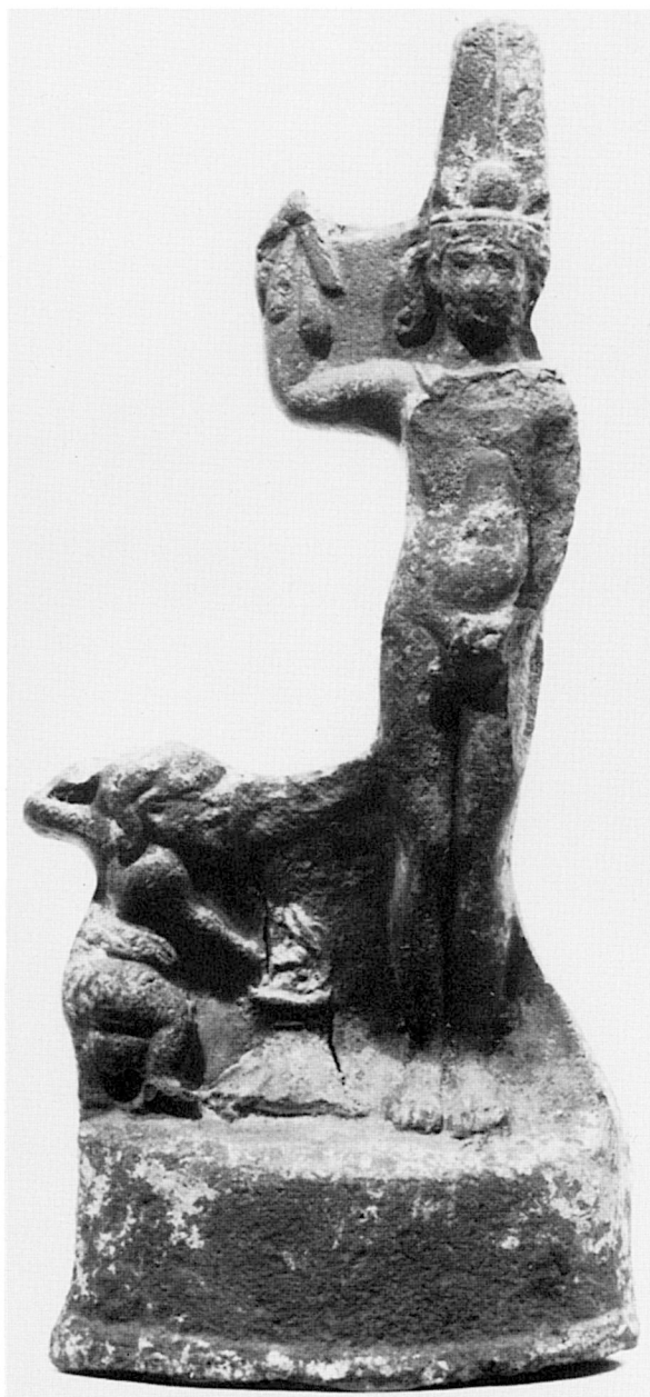
A. — Inv. n° 22.571, terre cuite, inédite. Musée Bénaki, Athènes.