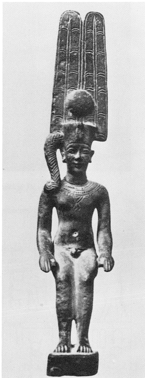
B. — Inv. n° 38.167. Bronze, Musée Egyptien, Le Caire (d'après Daressy, Statues de divinités , pl. X).