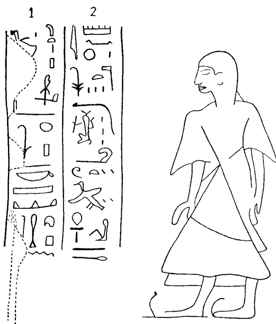
Fig. 1. — Texte d'oracle de Nesamon à Karnak.

Dans le petit temple d'Amenhotep II situé entre les IX e et X e pylônes, on peut voir, à l'angle Nord-Est du mur, une stèle assez grossièrement sculptée, datée de