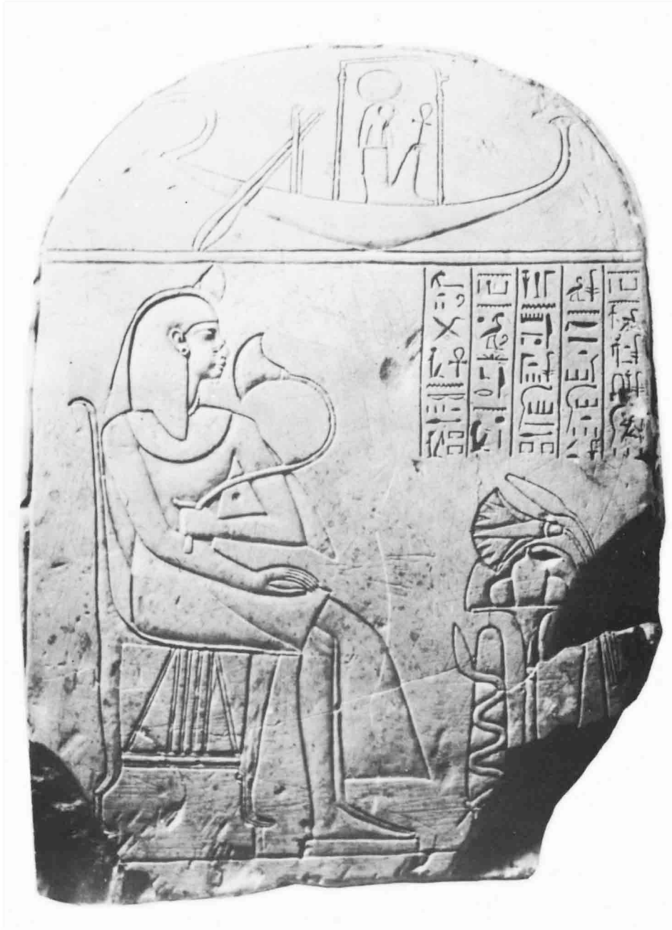
Stèle du Caire 3/4/17/1.