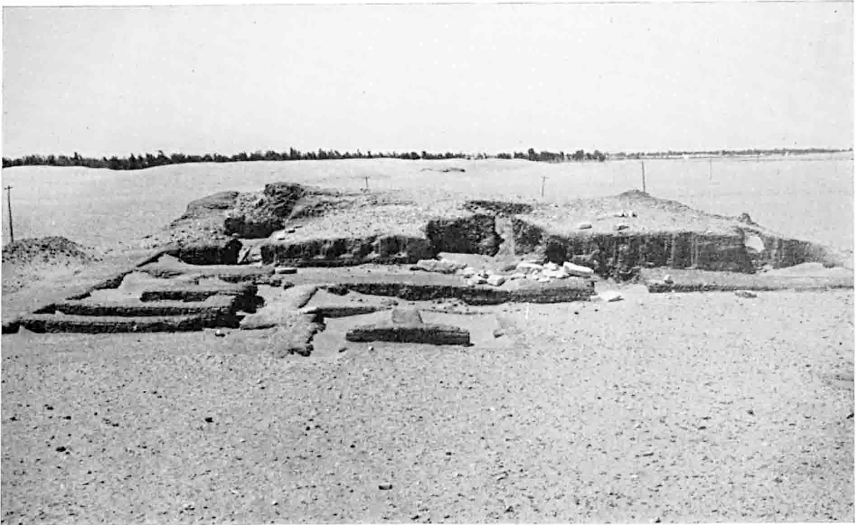
A. — Balat : Mastaba M.II. Façade du monument vue d'est en ouest (§ 639).