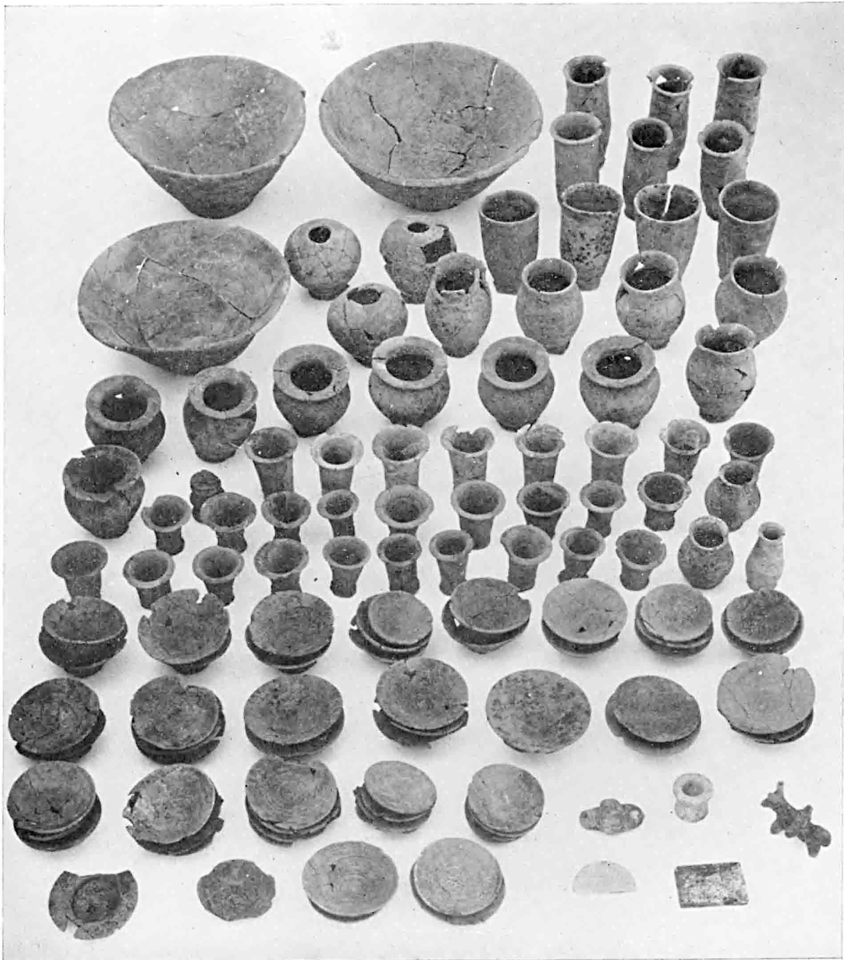
Karnak-Nord : Ensemble d'un des dépôts de fondation (§ 641).