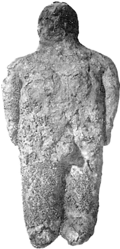
M2 327 C64