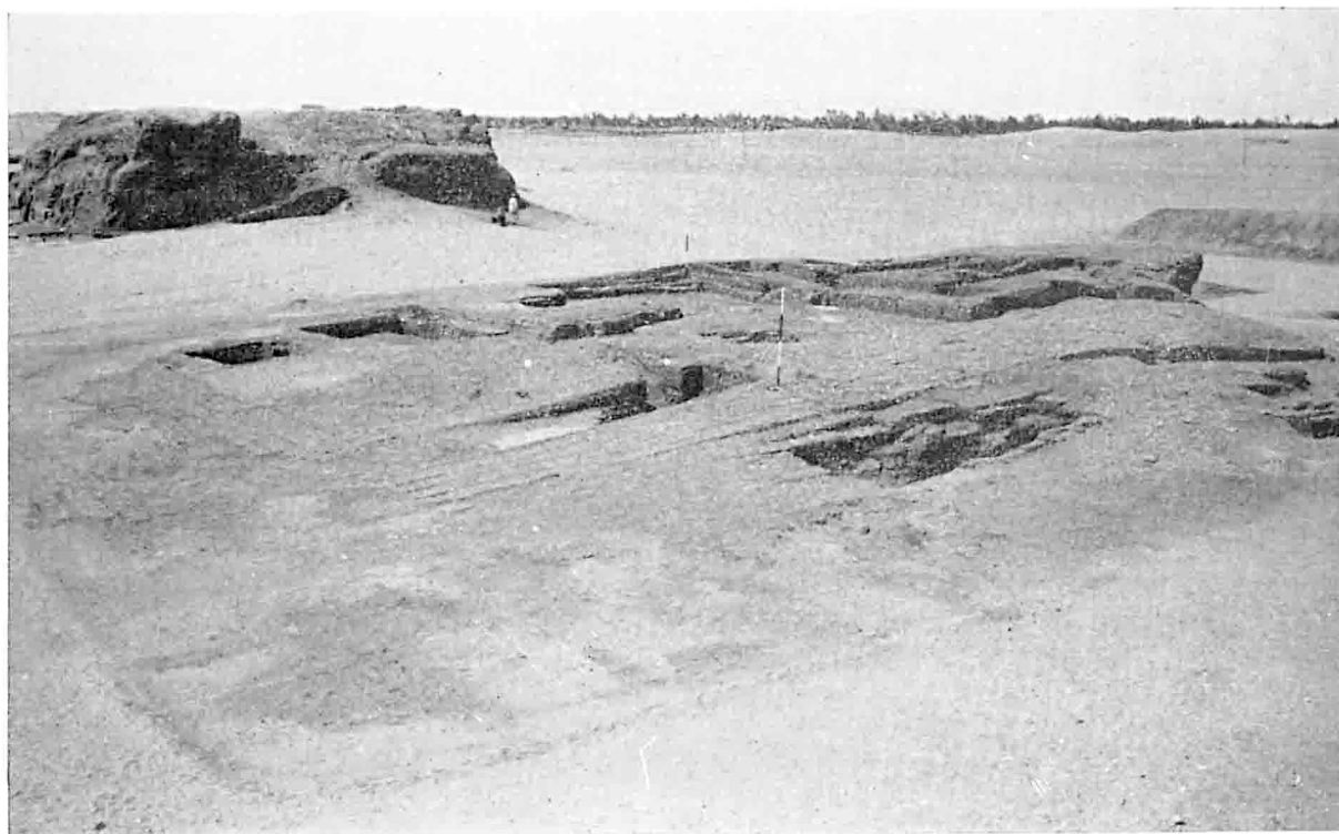
B. — Balat : Ensemble du Mastaba M.V vu du nord-est vers le sud-ouest (§ 640). Dans le fond, en haut à gauche, superstructure du Mastaba M.IV.

N.B. : Le Mastaba M.I se trouve hors du cliché un peu à gauche et en haut de la bordure gauche de ce dernier; le Mastaba M.V est situé plus à gauche que ne l'indique le trait de situation.