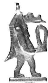
(éch. 2 : 1)