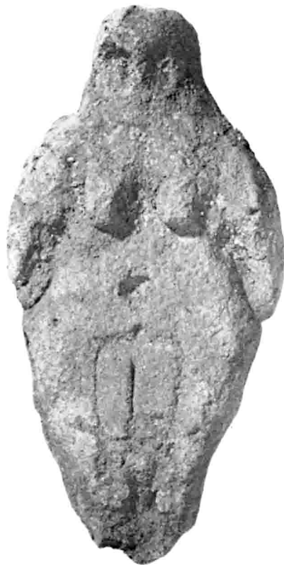
M2 327 B64