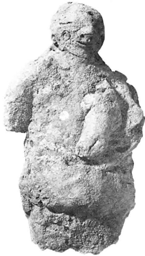
M2 327 C87