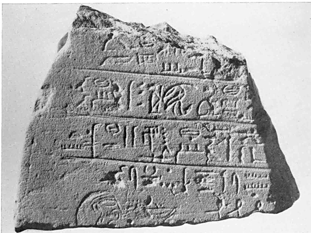
B. — Balat : Stèle hiéroglyphique. Structure tardive devant M.II (§ 640).