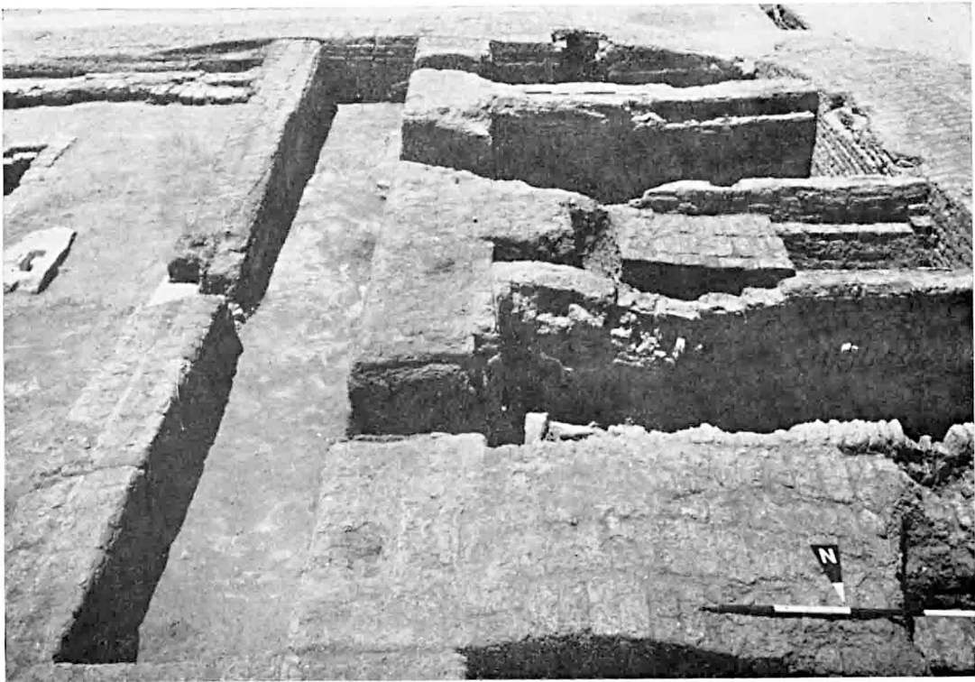
A. — Balat : Mastaba M.V. Le « couloir » et les « chambres » occidentales (§ 640).