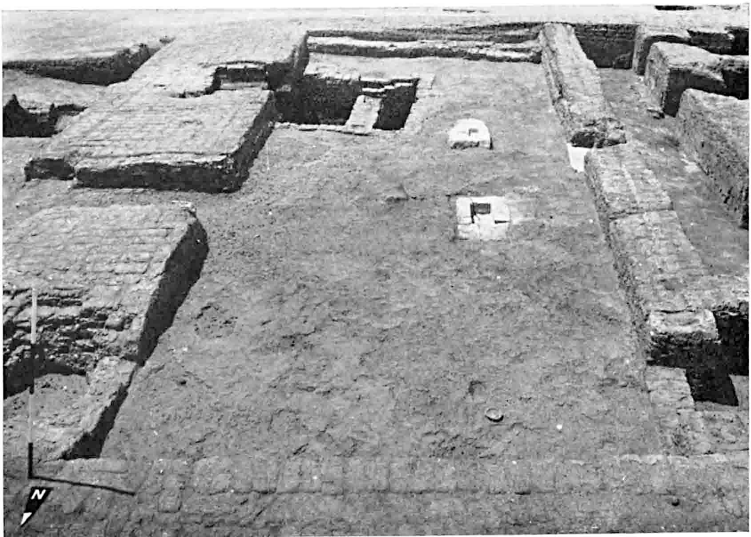
B. — Balat : Cour médiane du Mastaba M.V (§ 640). En haut près du centre restes des socles en calcaire pour les stèles.