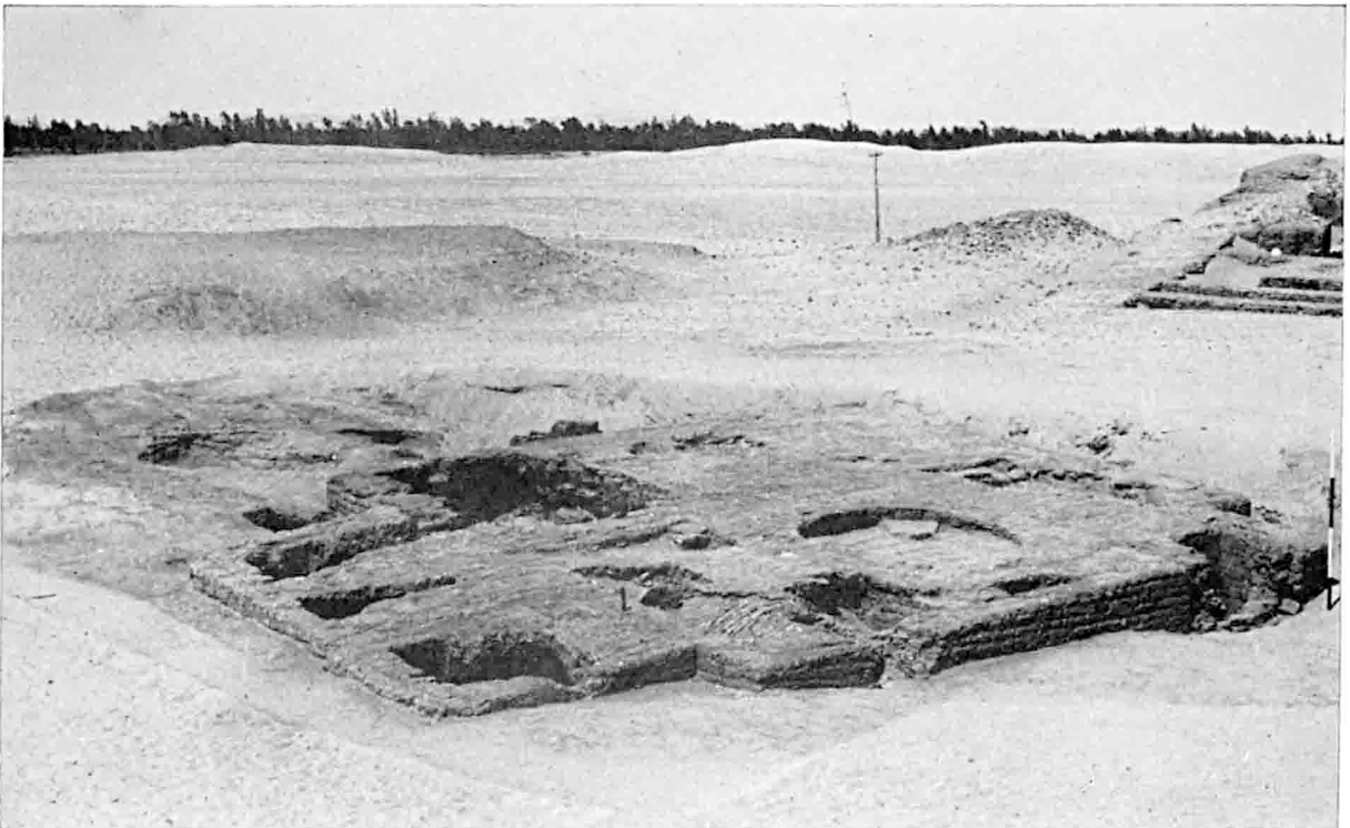
B. — Balat : Grande structure tardive, à l'est du Mastaba M.II (§ 640).