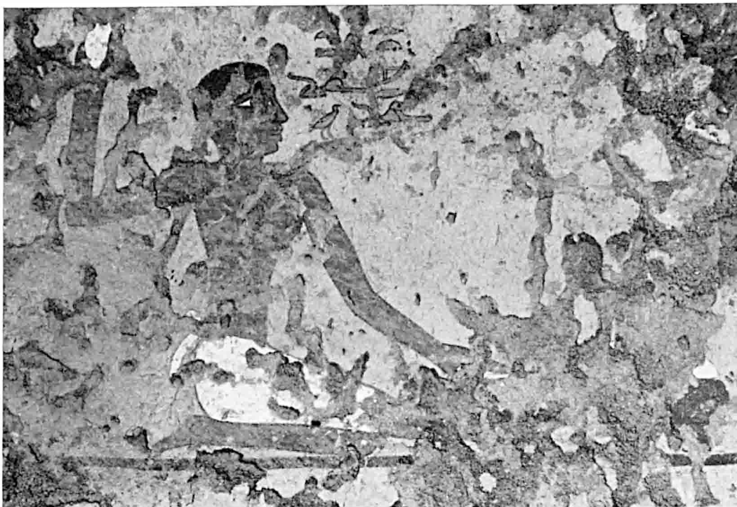
A. — Balat : Mastaba M.V. Couloir : artisan au travail, peinture (§ 640).