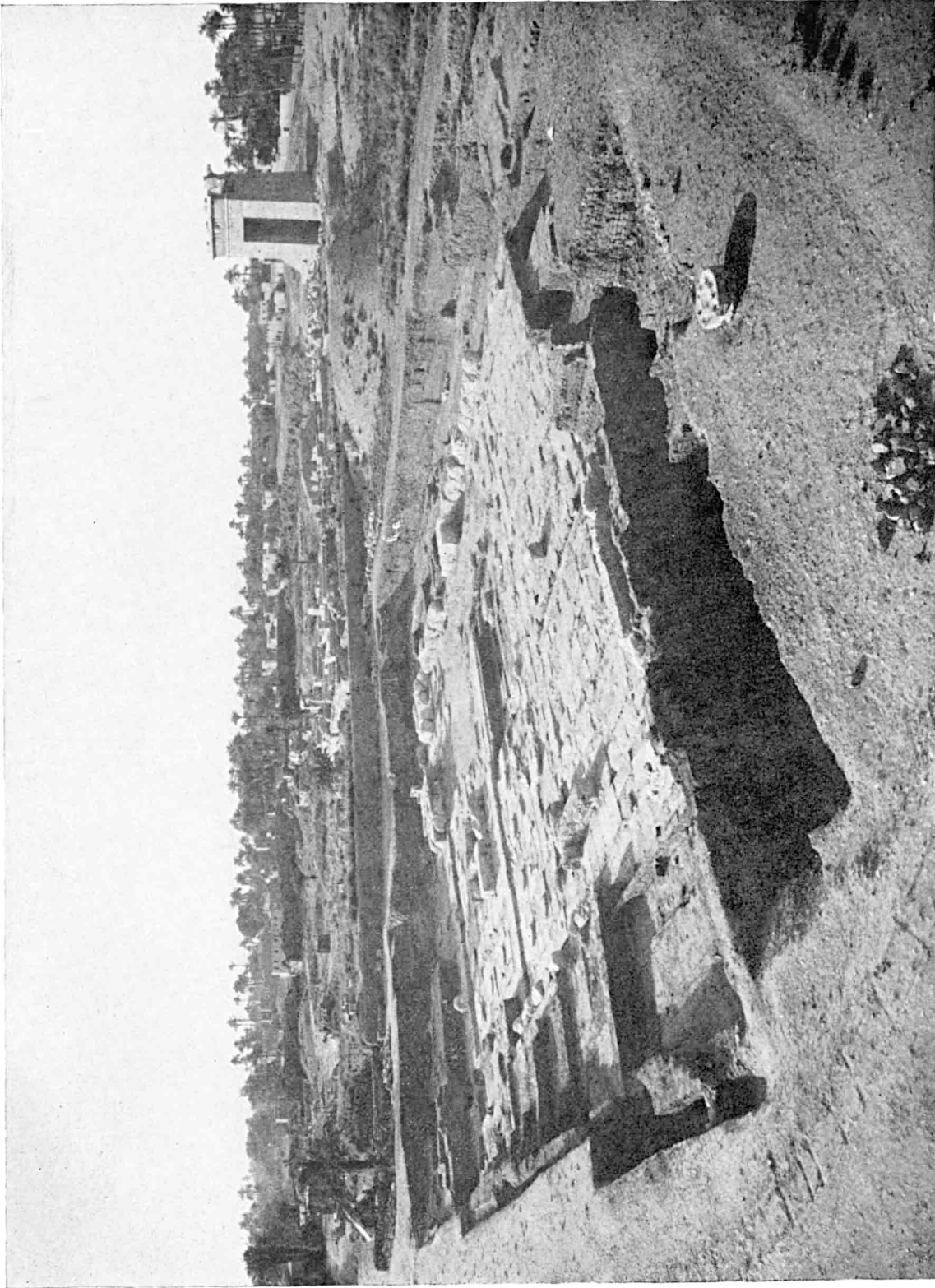
Le temple de Thoutmosis I er à Karnak Nord à la fin de la huitième campagne de fouilles (1974-1975). Vue prise du Sud-Est.