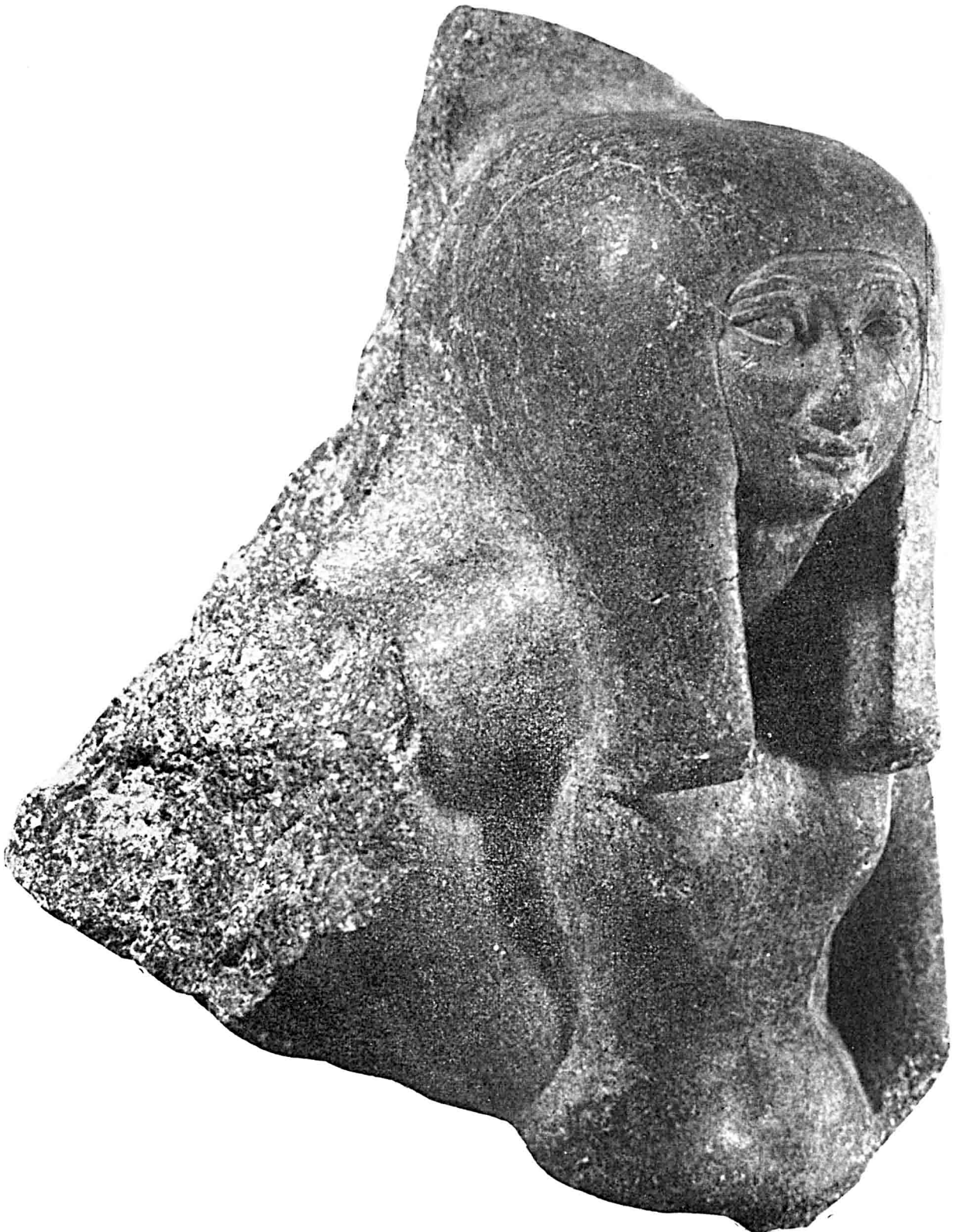
Fragment d'une statue-couple en granit noir. Haut. 20 cm. (Inv. A 3174).