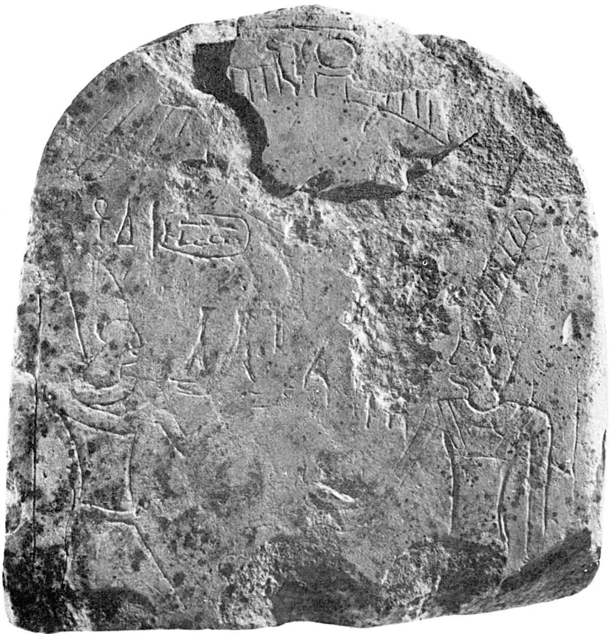
Stèle au nom de Sekenenrē I er . Calcaire, haut. 32 cm. (Inv. A 3518).