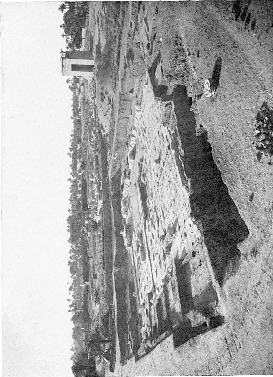
Le temple de Thoutmosis I er à Karnak Nord à la fin de la huitième campagne de fouilles (1974-1975). Vue prise du Sud-Est.