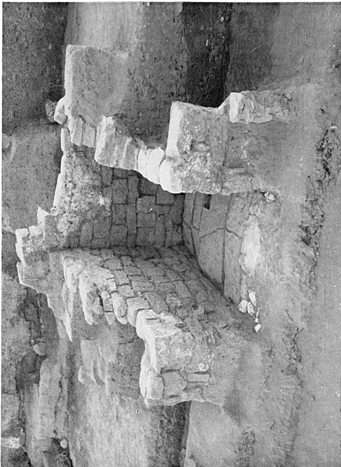
Chapelle tardive au Sud-Ouest du temple de Thoutmosis I er . Vue prise du Nord-Ouest.