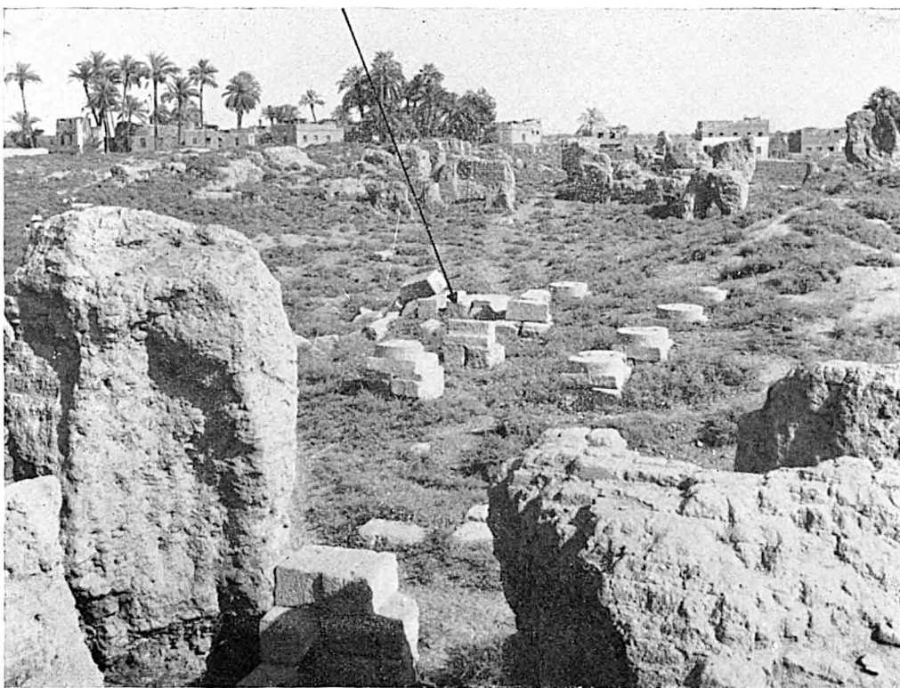
A. — L'emplacement de l'inscription in situ .