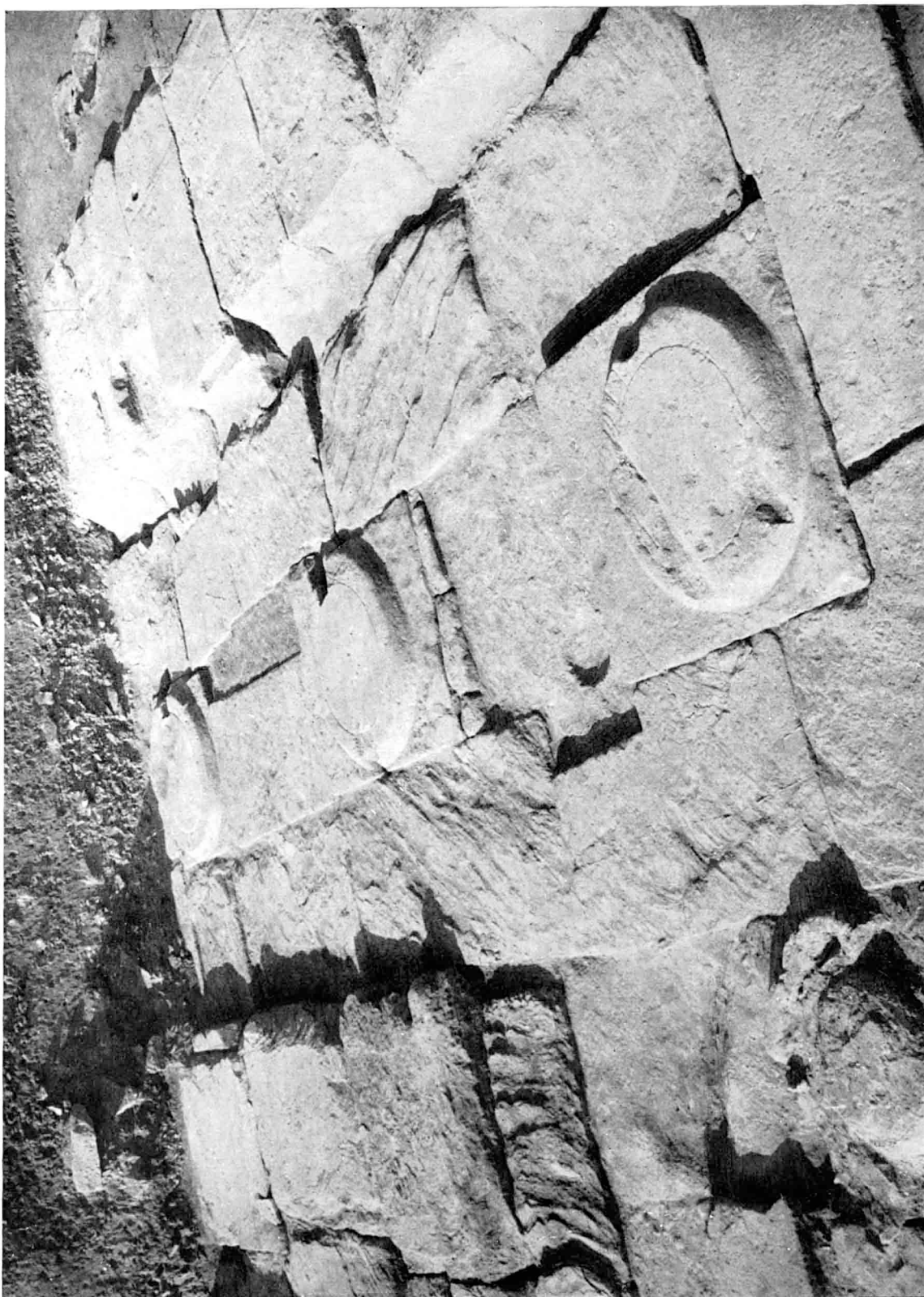
La colonnade Ouest du temple. En haut : coupe stratigraphique; à gauche : les fondations du mur de la Chapelle 15; à droite : celles du Mur Ouest du temple. Vue prise du Nord.