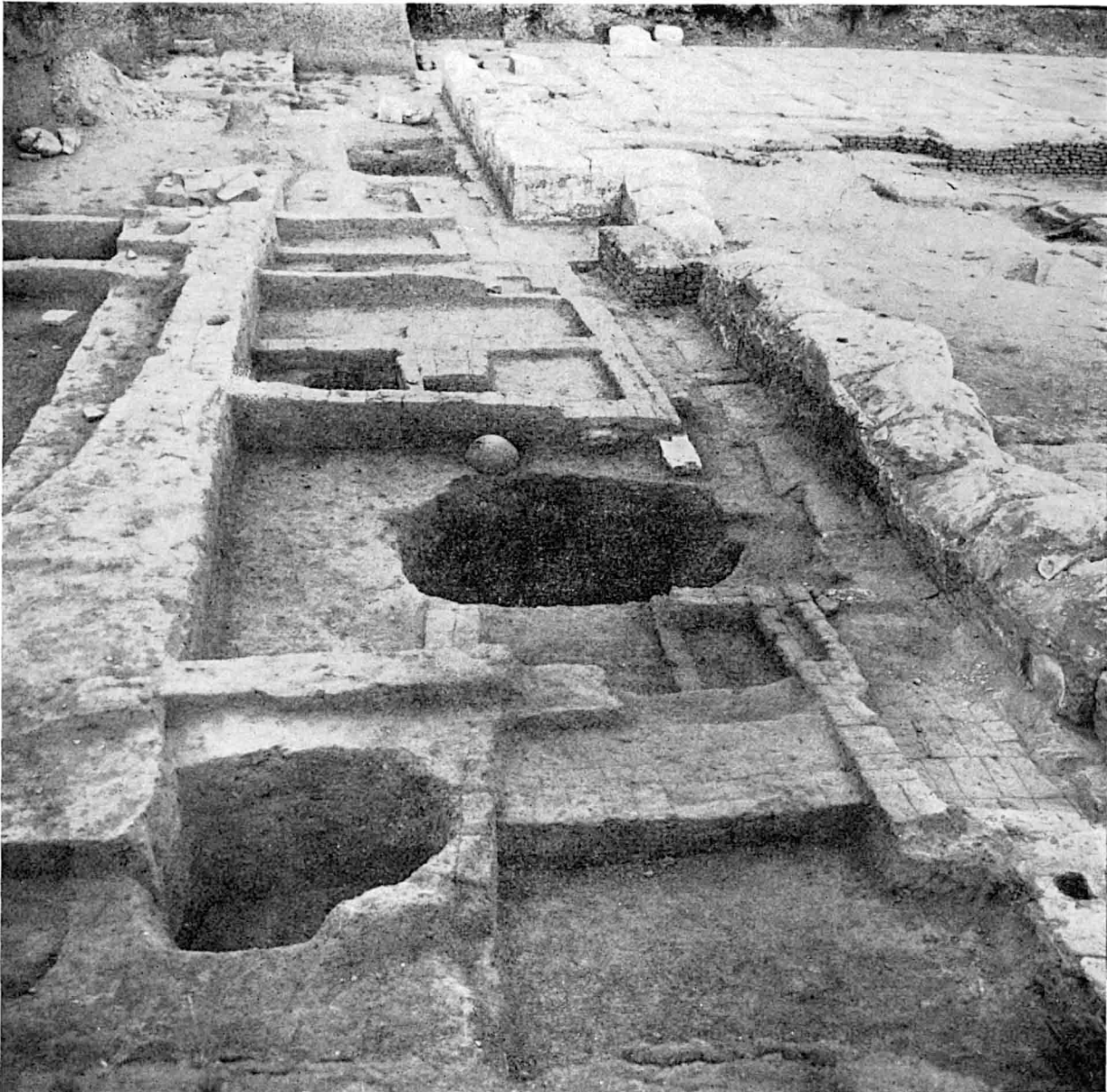
Les installations au Nord du temple. Au centre : la grande fosse; à gauche : le mur d'enceinte. Vue prise de l'Ouest.