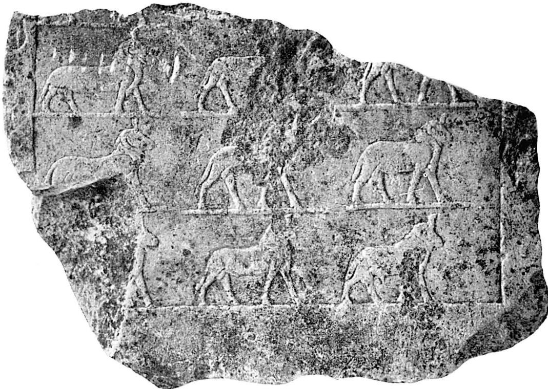
C. — Stèle fragmentaire : la procession des Béliers d'Amon. Inv. n° A. 2638. Calcaire.