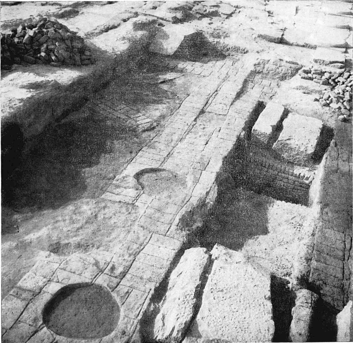
Les installations sous la Cour du temple. Vue prise du Nord.