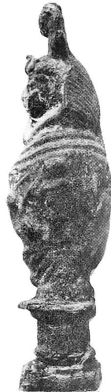
Doc. 1 : Louvre AF 589.