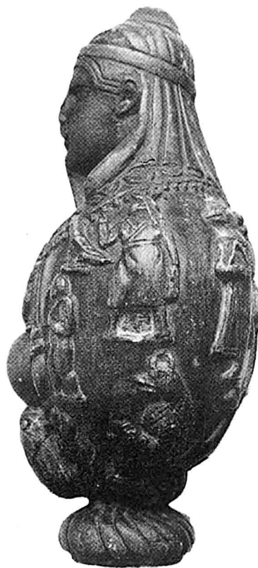
Doc. 5 : Louvre E 22285 = MG 4730.