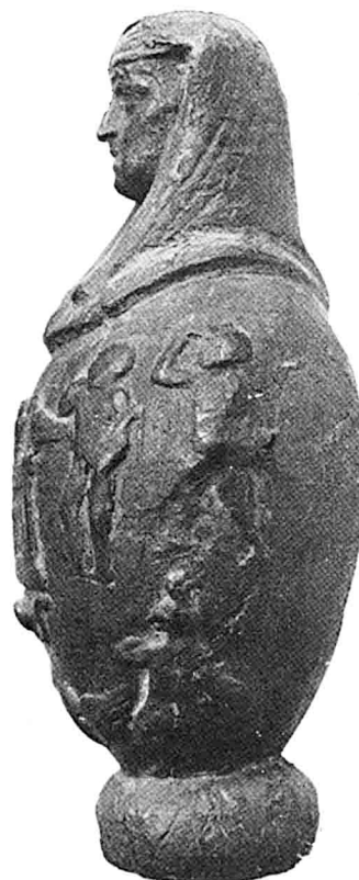
Doc. 4 : Louvre E 22271 = MG 4772.