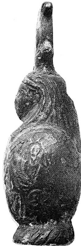
Doc. 3 : Louvre AF 597.