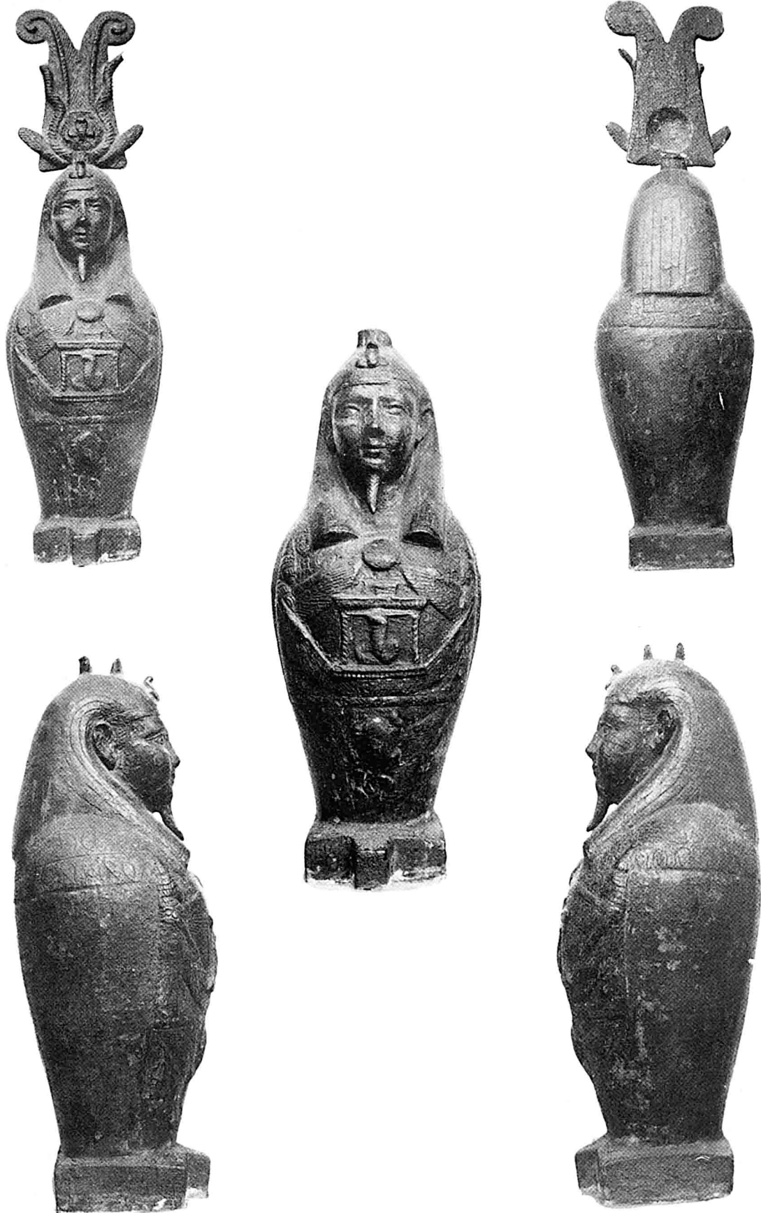
Doc. 2 : Louvre AF 586.