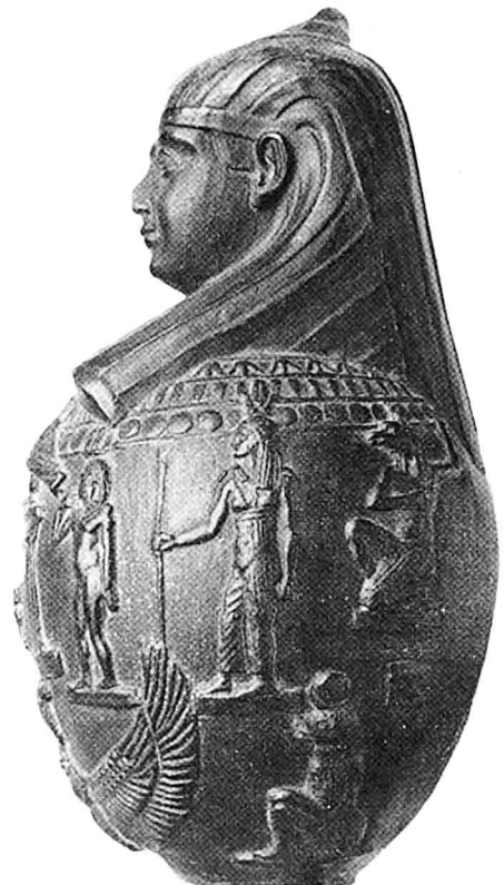
Doc. 8 : Louvre E 29228 = MG 4729.