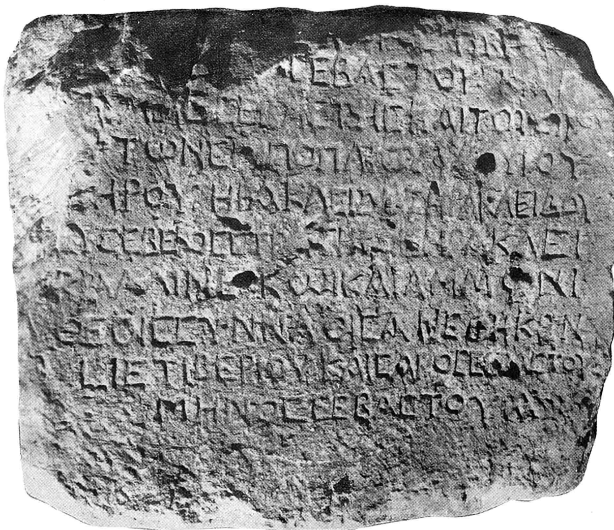
Inscription de Baharieh : Dédicace à Herakles Kallinikos et à Ammon.