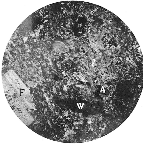
I. — Section mince dans le porphyre antique vue au microscope, faible grossissement. F , feldspath oligoclase-andésine ; f , même feldspath mais microlitique ; A , amphibole hornblende ; W , withamite.