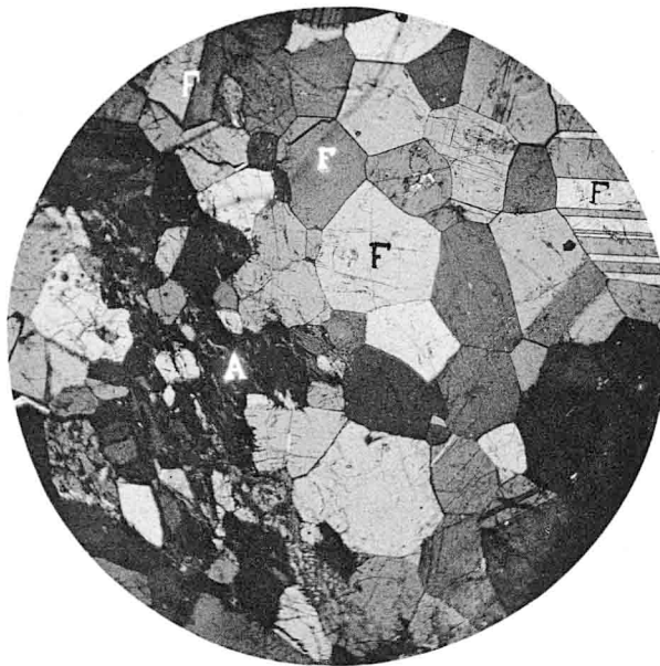
II. — Anorthosite vue au microscope à la lumière polarisée. A , amphibole ; F , feldspath bytownite.