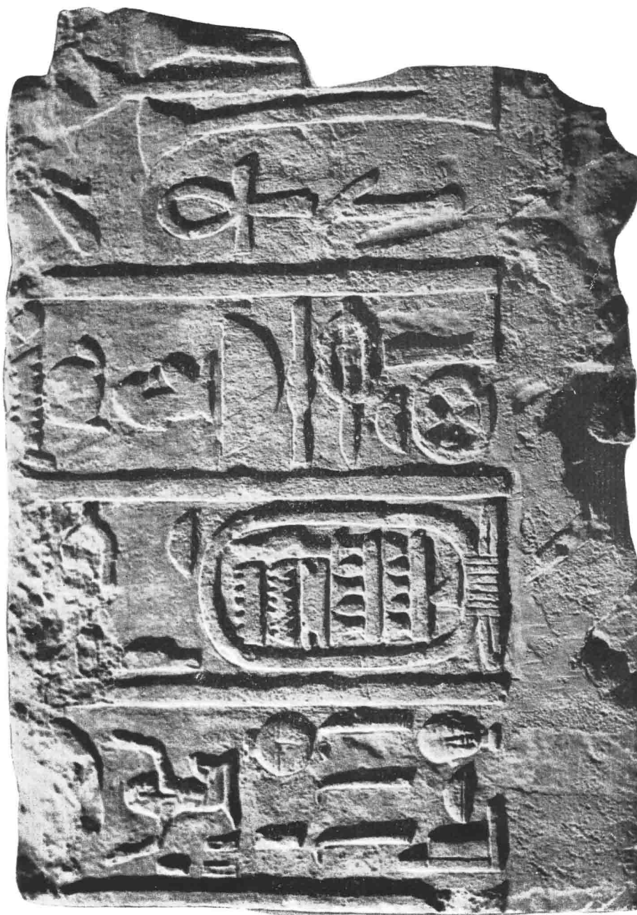
Bloc du temple de Sakhebou. (Coll. Michaélidis, Le Caire).