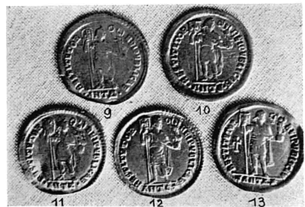
J. SCHWARTZ, Inscriptions et objets de l'époque romaine et byzantine trouvés à Tôd.