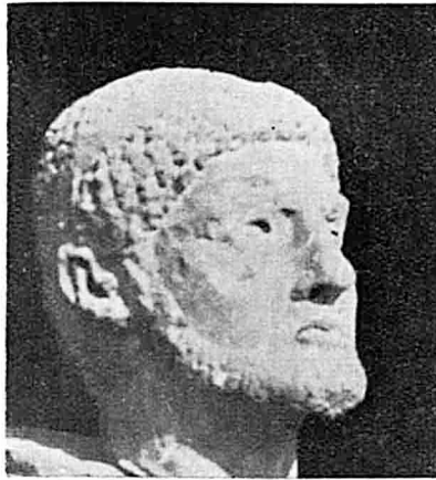
Fig. 1 b.

Fr. Poulsen, à qui nous avons communiqué des photos en octobre 1946 admettait encore, eu égard aux retards de la mode en province, comme date possible le règne d'Antonin le Pieux. L'iconographie de l'Égypte romaine est pratiquement inexistante et, de plus, la catégorie à laquelle appartient le personnage est difficile à déterminer. On ne peut admettre de statue de quelque deux mètres que pour un empereur; or cette hypothèse est à exclure. Ramenés à voir dans la tête en question le fragment d'un buste, nous sommes