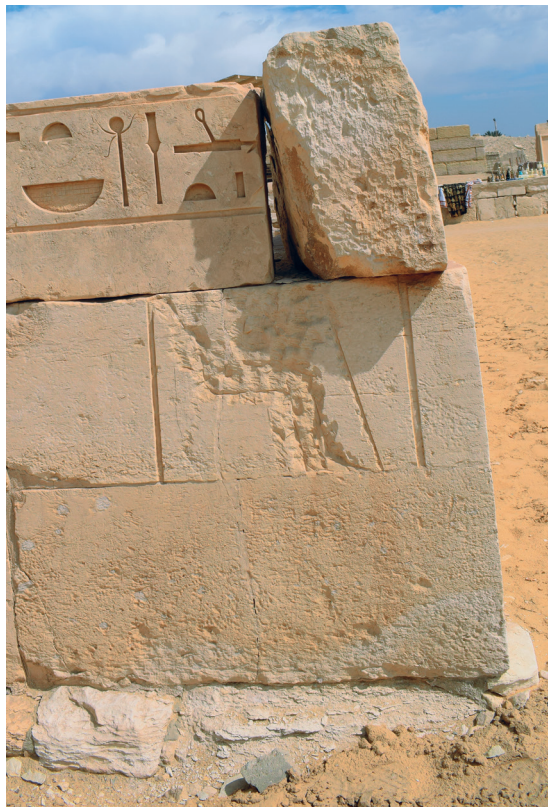
FIG. 18. Face ouest de l'angle sud-ouest du mastaba de Hétep (NB : les blocs de la troisième assise ne font pas partie du décor d'origine).