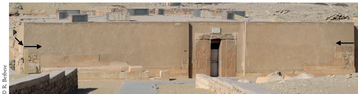
FIG. 5. Orientation des représentations sur l'angle sud-est du mastaba de Mérérouka.