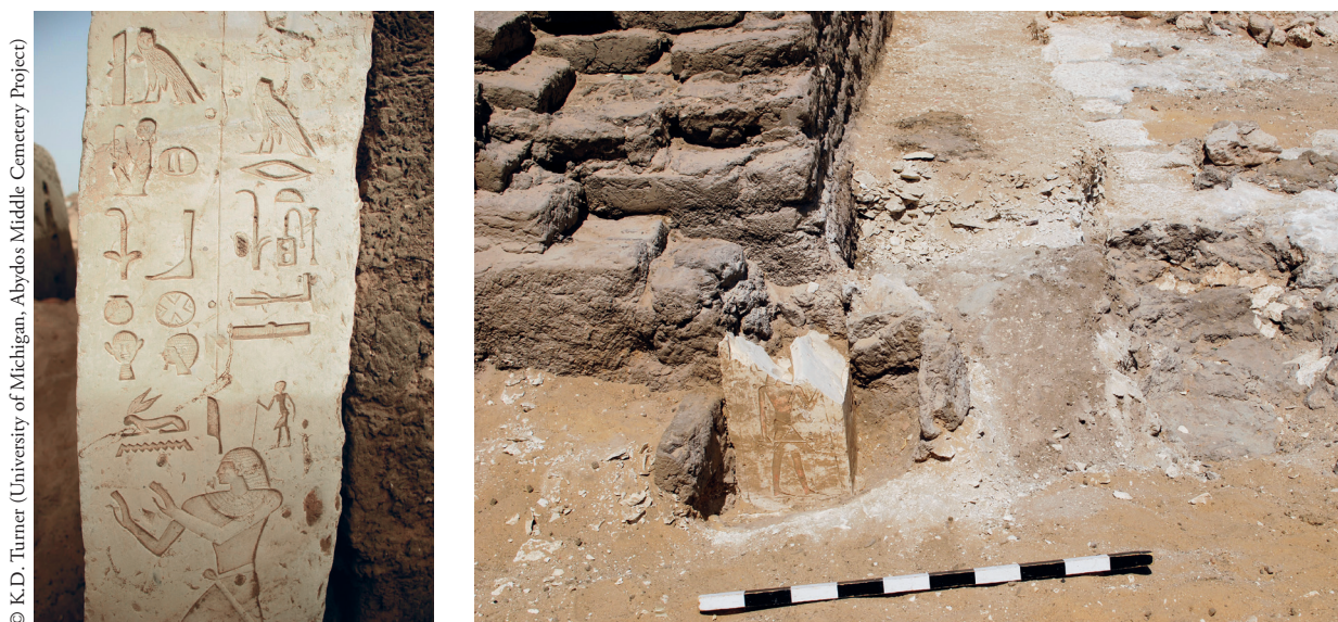
FIG. 8. Angle sud-ouest du mastaba d'Ouni à Abydos (à gauche) et angle sud-est in situ (à droite).