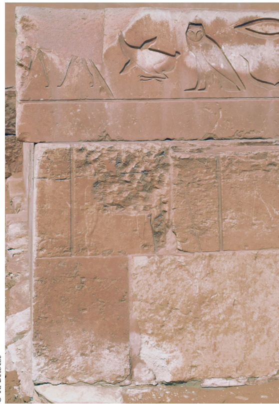
FIG. 19. Face sud de l'angle sud-ouest du mastaba de Hétep (NB : les blocs de la troisième assise ne font pas partie du décor d'origine).