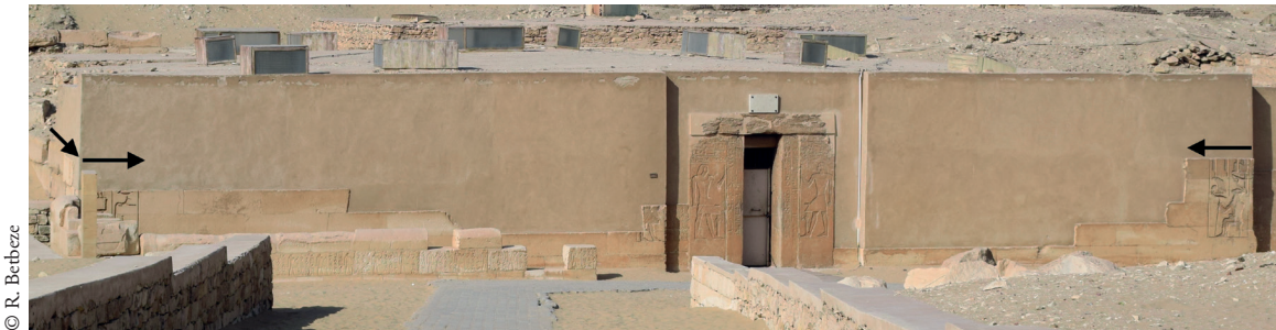
FIG. 5. Orientation des représentations sur l'angle sud-est du mastaba de Mérérouka.