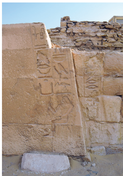
FIG. 9. Angle nord-est du mastaba de Kagemni.