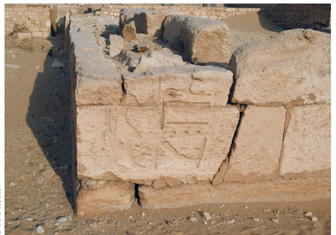
FIG. 14. Face nord de l'angle nord-ouest du mastaba de Mérérouka.