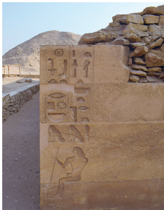
FIG. 3. Face nord de l'angle nord-est du mastaba de Kagemni.

Les dimensions de ce décor sont assez variables 7 , mais l'image du défunt qui tient lieu de déterminatif est dans la majorité des cas de très grande taille (autour de 100 cm chez Kagemni, Mérérouka, Ânkhmahor et Tjétyou), et contraste avec les signes hiéroglyphiques qui sont généralement deux fois moins grands. Il faut toutefois noter que les cadrats des angles de Kagemni, Mérérouka et Khentika Ikhékhî mesurent entre 30 et 40 cm, ils attestent de la monumentalité des inscriptions.