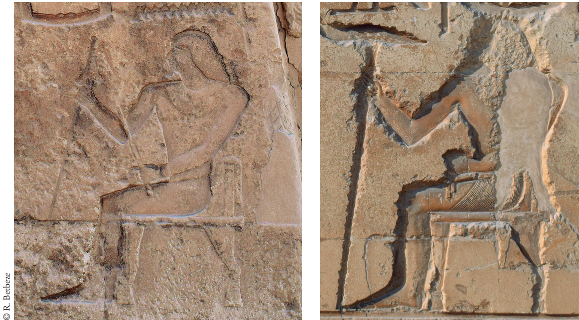
FIG. 4. Déterminatifs des angles nord-ouest (face nord) du mastaba de Kagemni (à gauche) et sud-est (face sud) du mastaba de Mérérouka (à droite).

façade de Mérérouka, certains détails comme le siège du défunt et son sceptre ont été gravés en relief levé, avec pour effet de créer une forme de profondeur au sein de l'image avec une distinction technique entre premier plan (relief levé) et arrière-plan (relief dans le creux), qui témoigne de l'attention portée à ce type de décor (fig. 4). Les représentations de Mérérouka et Kagemni se singularisent également par la qualité de leurs détails internes, à la fois dans les hiéroglyphes (plumes des oiseaux notamment) et dans la figuration du défunt (bijoux, plis du pagne, perruque, etc.).