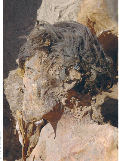
FIG. 4. Les amulettes au cou de la momie ED W59.01.