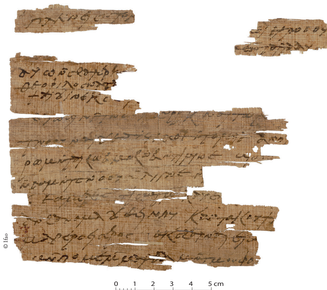
FIG. 2. P. Apoll. Inv. NS 5 v o .