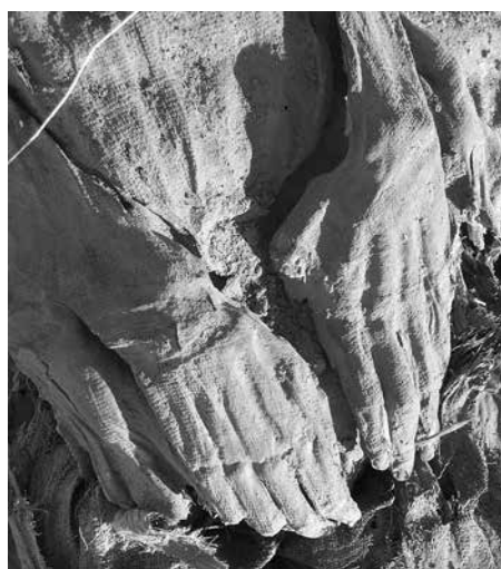
FIG. 3. Momie W40.01.