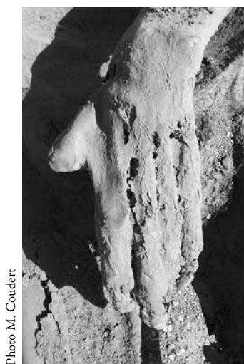
FIG. 2. Momie W10.03.

Dans trois tombes du secteur nord-ouest du cimetière ont été mises au jour les momies de trois hommes dont le pouce gauche avait été coupé et cicatrisé : il ne s'agissait pas, à l'évidence, d'un accident de nécropole.