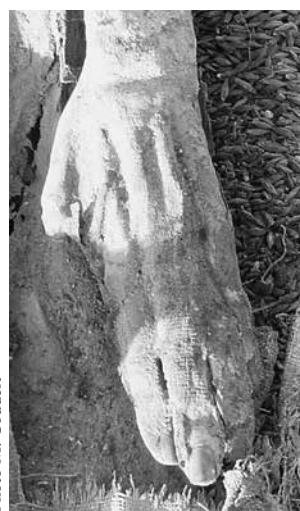
FIG. 4. Momie W99.01.

La première momie, W10.03, a été trouvée avec cinq autres individus dans une des rares tombes collectives du cimetière (fig. 2). Il s'agit de la momie d'un homme adulte, taille 1,67 m, doté d'une chevelure et d'une barbe brune abondantes, dont l'âge a été évalué à une trentaine d'années. La momie est bien conservée, mais disloquée, tête et jambes séparées du