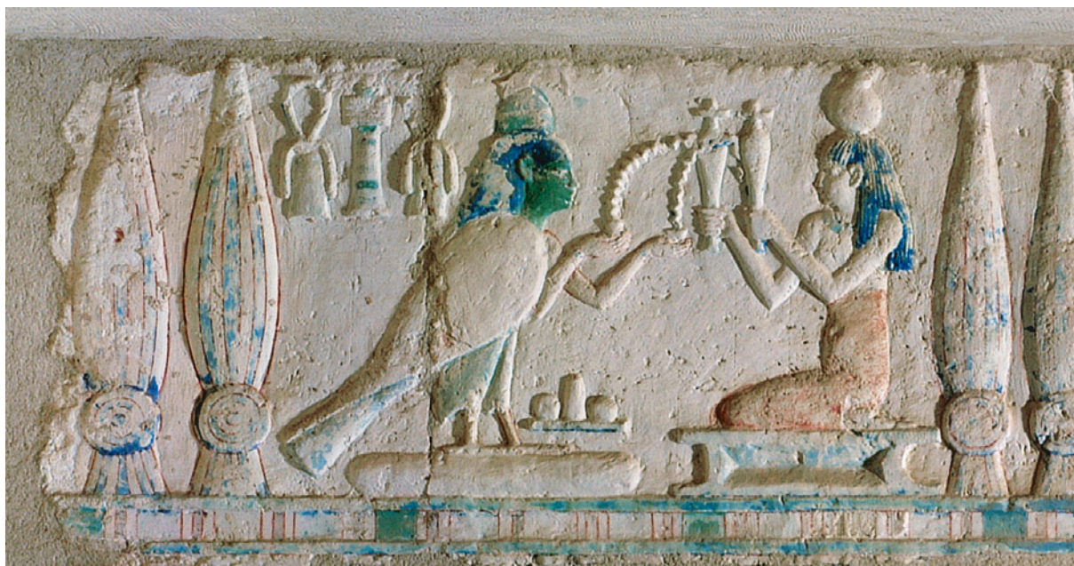
ABB. 2. Tuna el-Gebel, Grab des Petosiris, Inneres des Naos, Ostwand. Cherpion, Corteggiani, Gout 2007, S. 152, Szene 102.