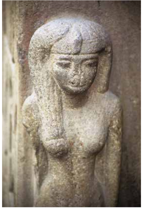
B. Le Caire, Musée égyptien, JE 45976.