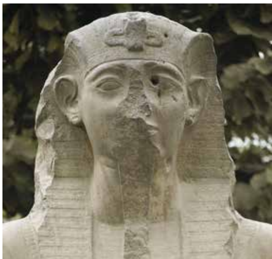
A. Le Caire, Musée égyptien, JE 45975.