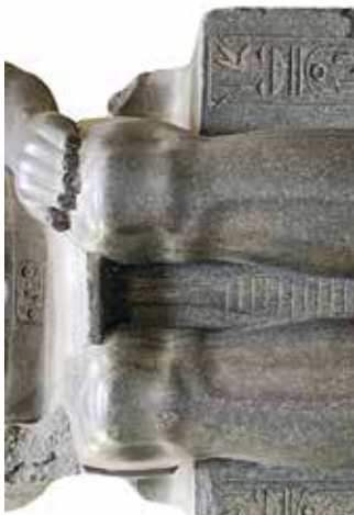
A. Amenemhat II ou Sesostris II (statue usurpée par Ramsès II) (Berlin ÄM 7264).