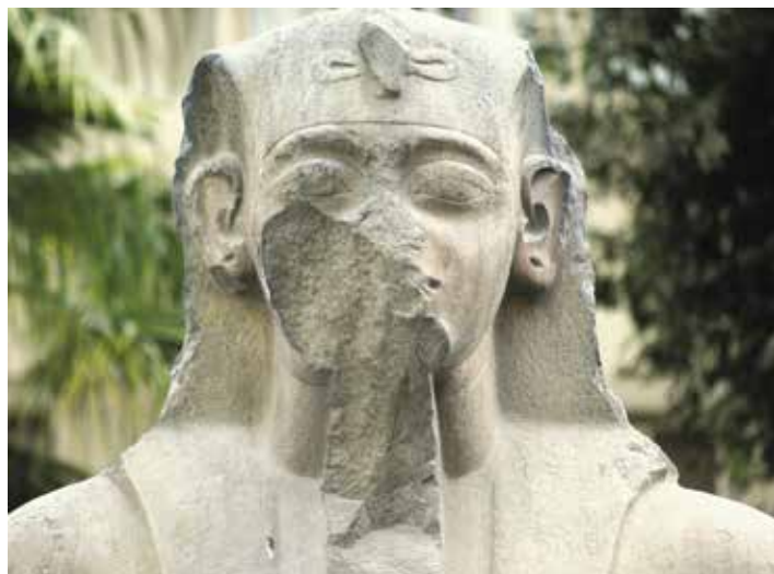
B. Le Caire, Musée égyptien, JE 45976.