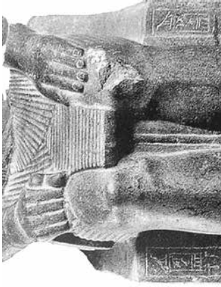
D. Sesostris III – Éléphantine 1361 (Habachi 1985, n° 102).