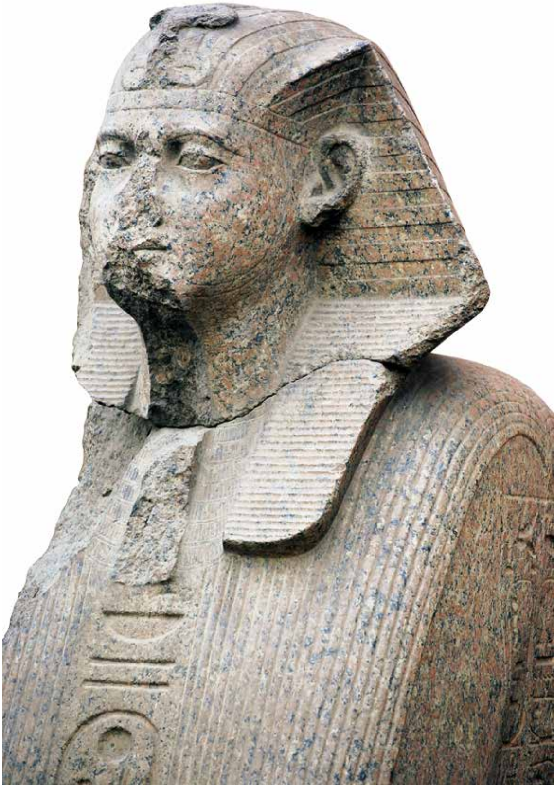
Pl. 3. Le Caire, Musée égyptien, CG 1197.