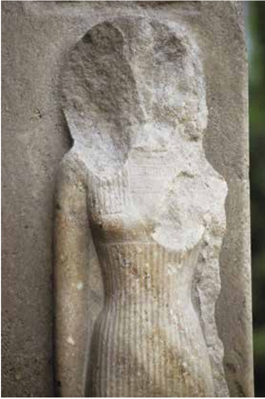
A. Le Caire, Musée égyptien, JE 45975.