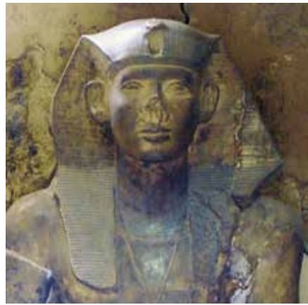
D. Néferhotep I er (Le Caire, Musée égyptien, CG 42022).