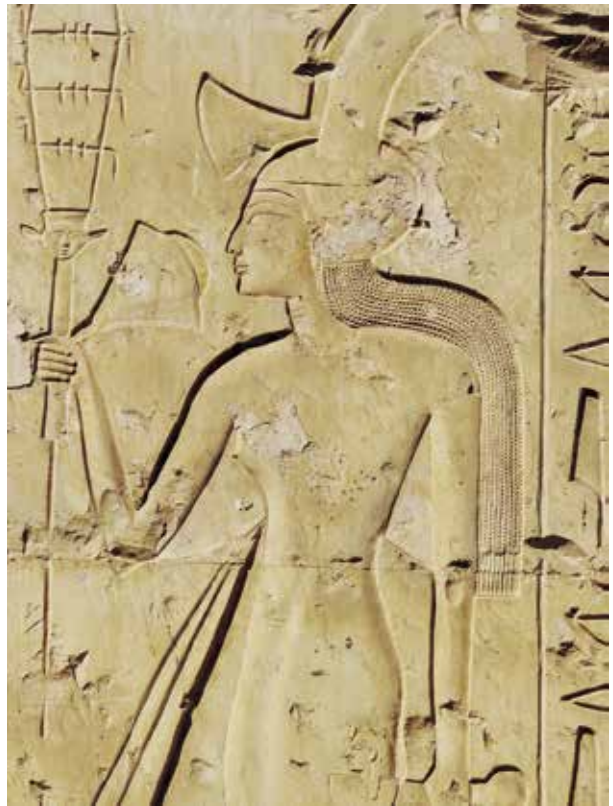
D. Détail du cortège de princesses (temple de Séthi I er à Abydos, 1 re cour, mur nord).