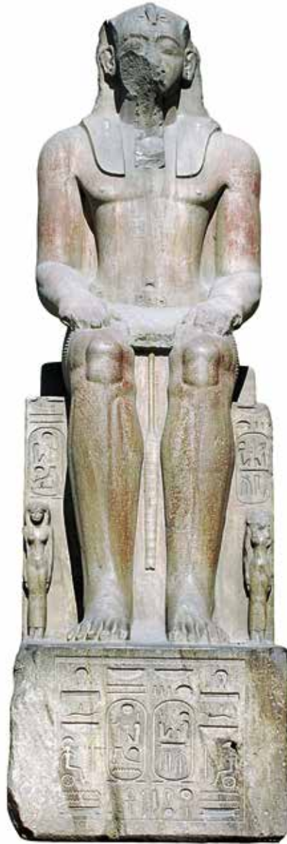
B. Le Caire, Musée égyptien, JE 45976. H. 390 cm.