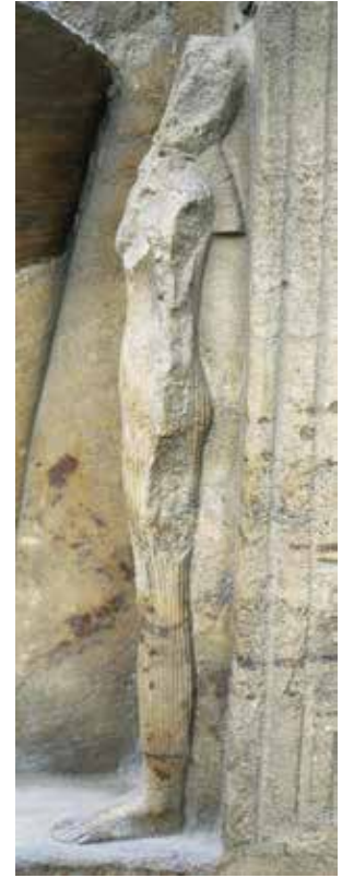
A,B,C. Le Caire, musée égyptien, JE 45975.