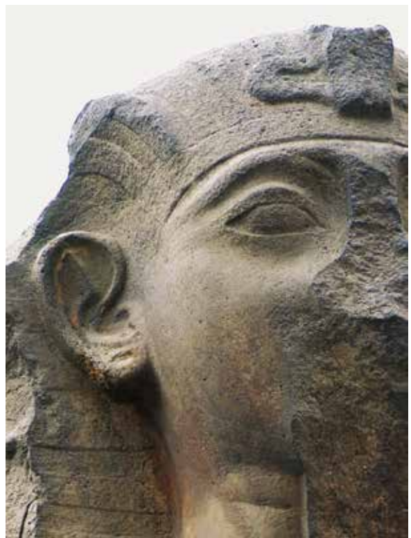
C. Le Caire, Musée égyptien, JE 45975.