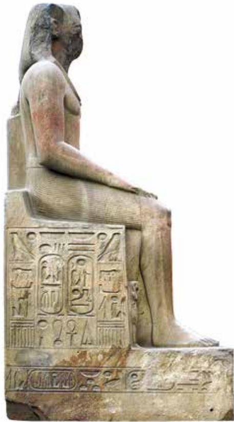
B. Le Caire, Musée égyptien, JE 45976.