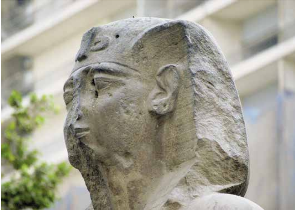
A. Le Caire, Musée égyptien, JE 45975.