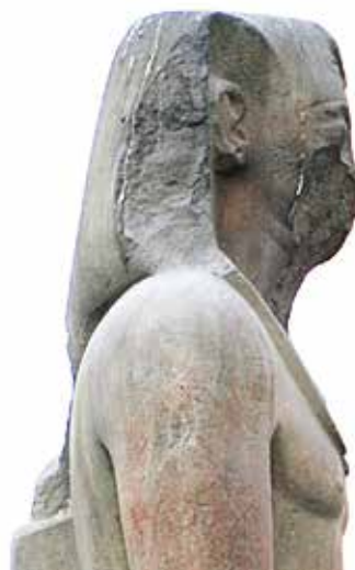
D. Le Caire, Musée égyptien, JE 45976.