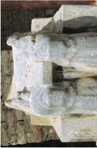
B. Sesostris III (Médamoud, in situ ).