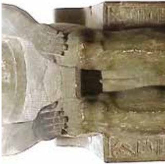
C. Amenemhat III (Le Caire, Musée égyptien, CG 385).