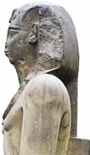
C. Le Caire, Musée égyptien, JE 45975.