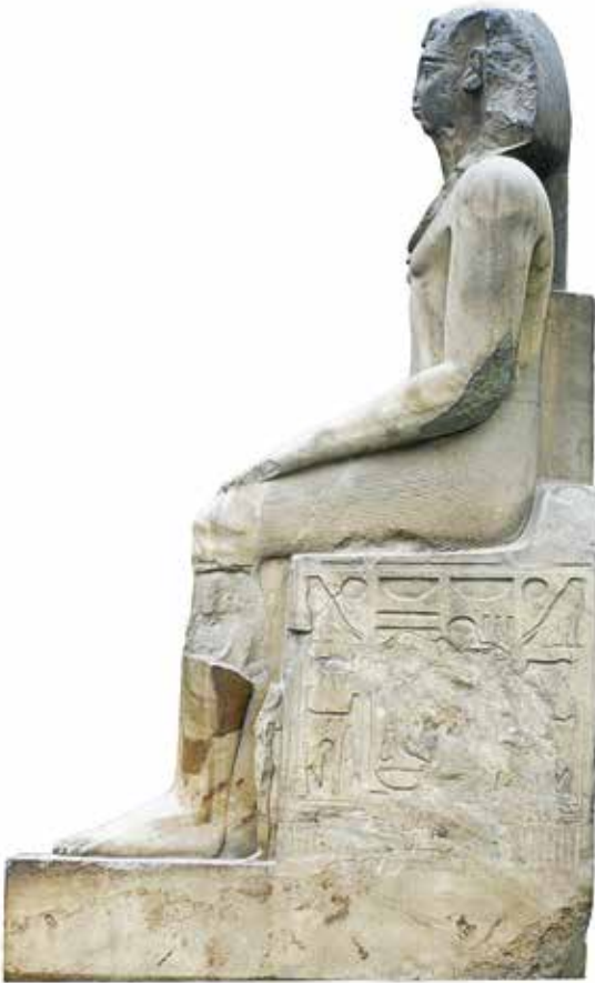
A. Le Caire, Musée égyptien, JE 45975.