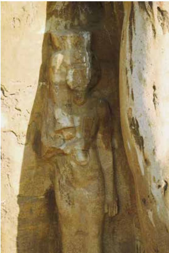
C. Princesse debout (détail d'un des colosses de Ramsès II à Tanis).