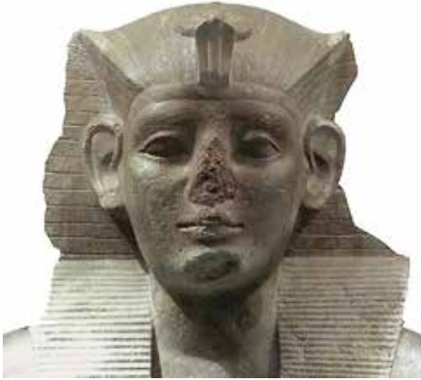
C. Néferhotep I er (Chicago, Oriental Institute, OIM 8303)?