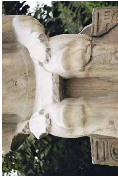
E. Le Caire, Musée égyptien, JE 45975.