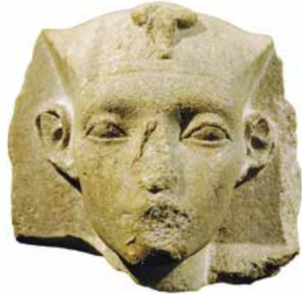
B. Roi de la première moitié de la XIII e dynastie (Bâle, Antikenmuseum und Sammlung Ludwig, LG Ae NN 17).