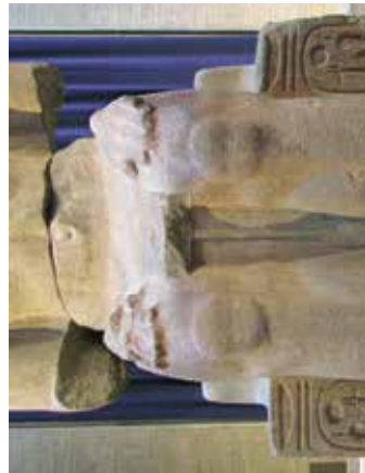
G. Statue de la fin du Moyen Empire usurpée par Ramsès II (Philadelphie, Penn Museum, E-635).