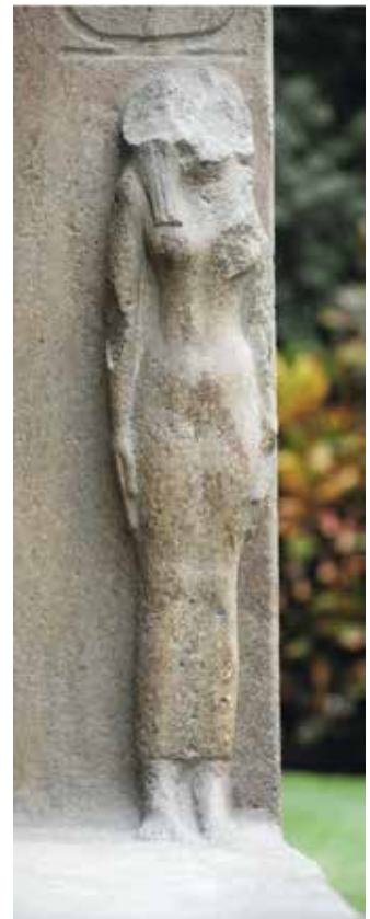
D,E,F. Le Caire, Musée égyptien, JE 45976.