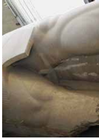
J. « Colosse couché » de Ramsès II (Mit Rahina).