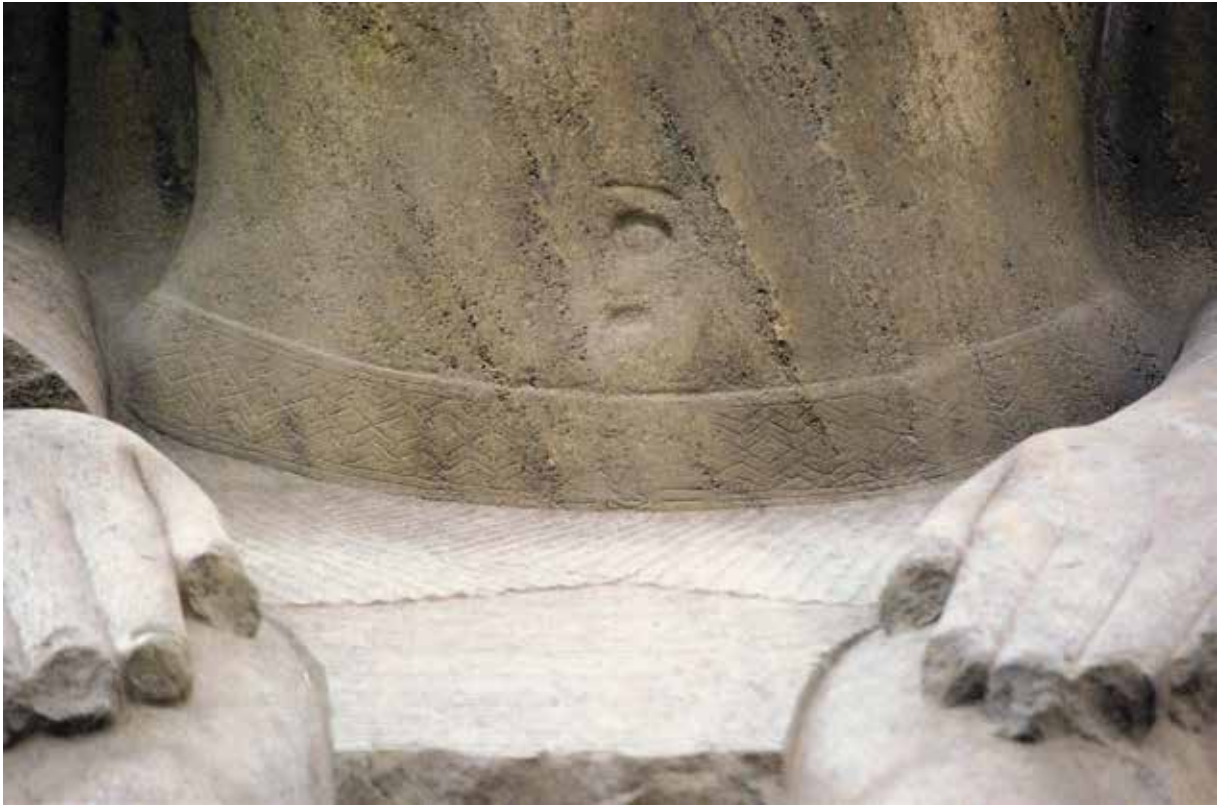
A. Le Caire, Musée égyptien, JE 45975.