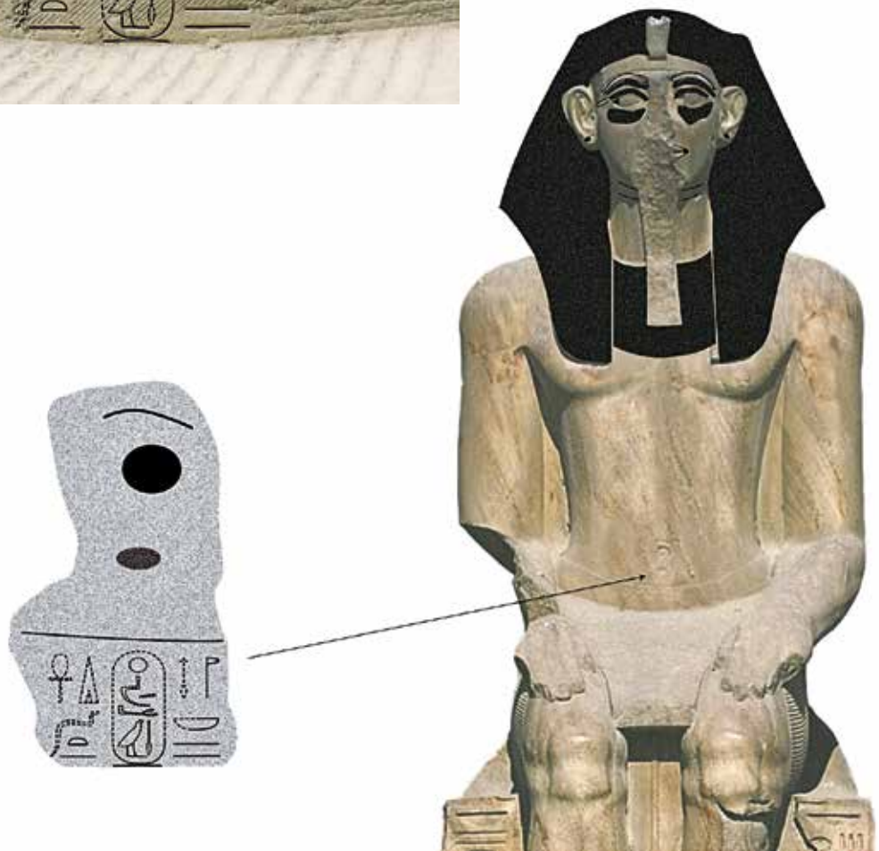
Pl. II. Le Caire, Musée égyptien, JE 45975.