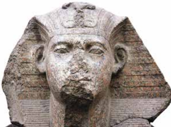
E. Sphinx usurpé par Ramsès II (Le Caire, Musée égyptien, CG 1197).