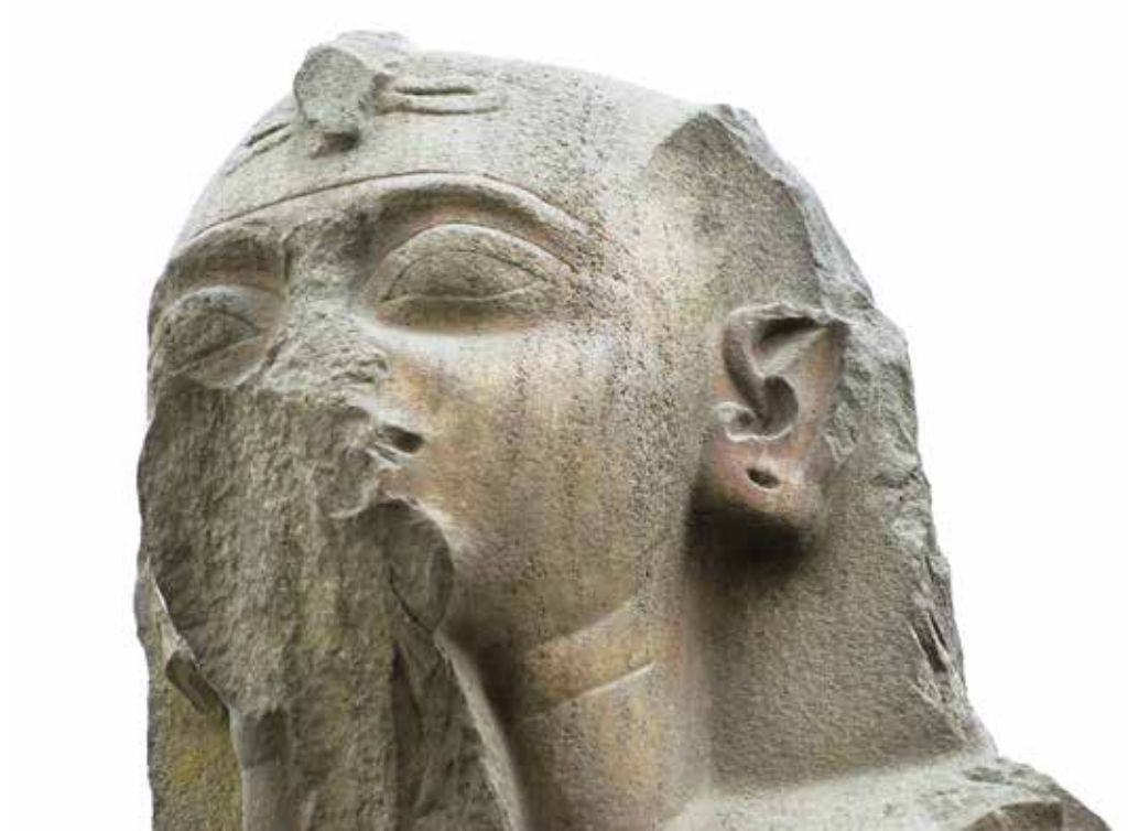
B. Le Caire, Musée égyptien, JE 45976.