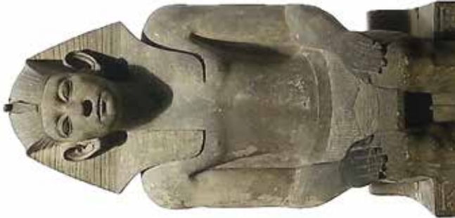
D. Amenemhat III (Le Caire, Musée égyptien, CG 385).