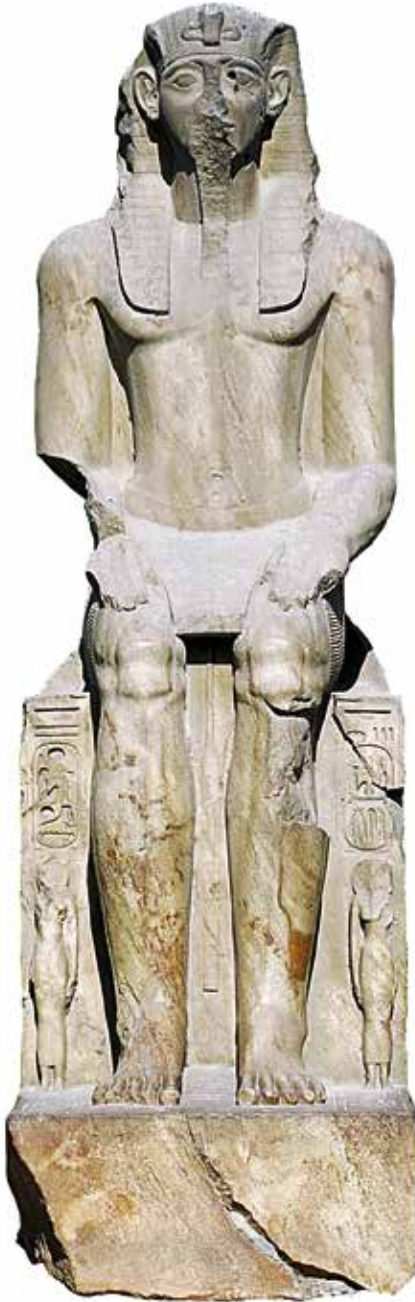
A. Le Caire, Musée égyptien, JE 45975. H. 435 cm.