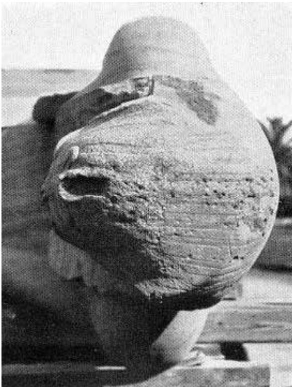
B. Le Caire, Musée égyptien, JE 45975 (d'après EVERS 1929, I, pl. 16, fig. 71).