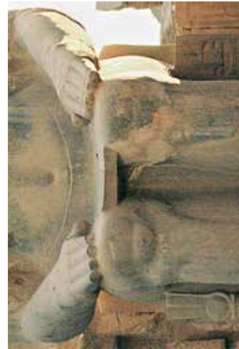
H. Statue d'Amenemhat III usurpée par Ramsès II (temple de Louqsor).