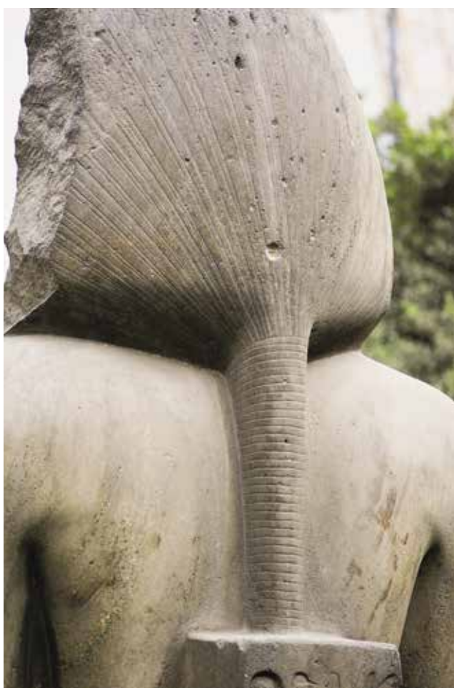
C. Le Caire, Musée égyptien, JE 45975.