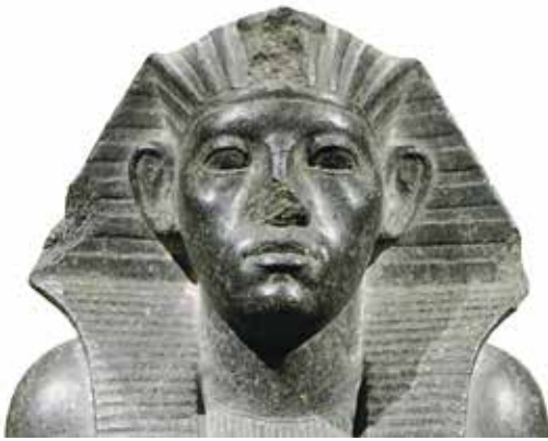
A. Amenemhat III (Cleveland Museum of Art, 1960.56).