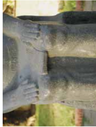
I. Statue d'Amenemhat III (?) usurpée par Ramsès II (jardin municipal de Zamalek, Le Caire JE 67097).