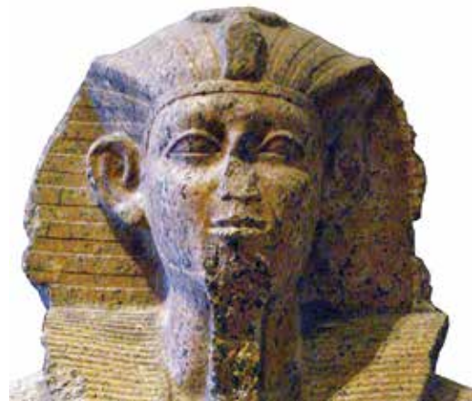
F. Sobekhotep Khânéferré (Paris, musée du Louvre A 16).