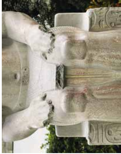
F. Le Caire, musée égyptien, JE 45976.