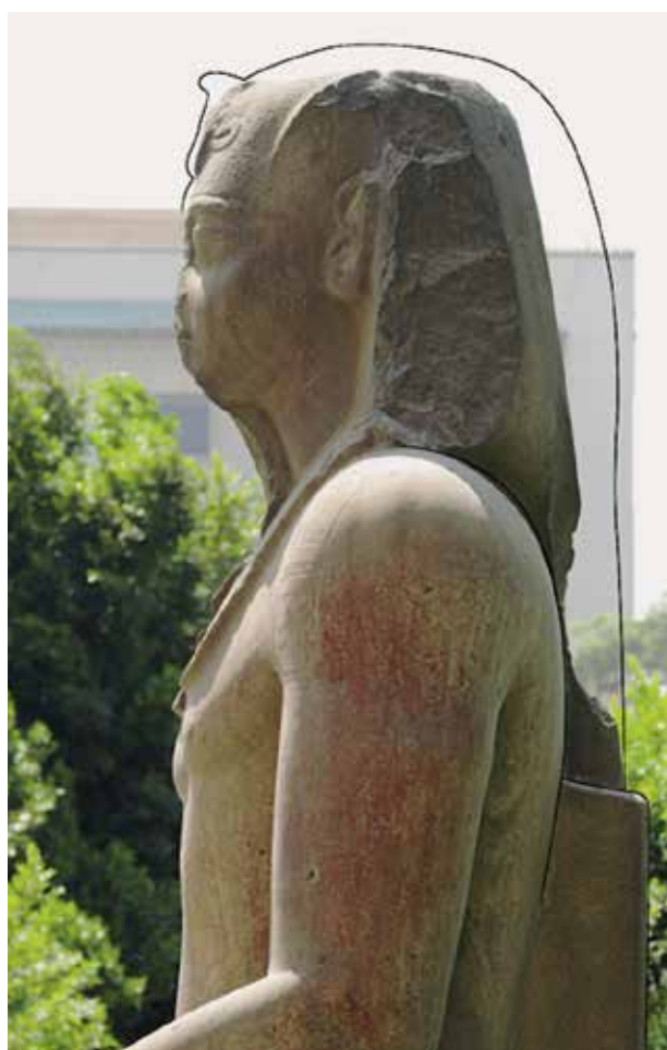
D. Le Caire, Musée égyptien, JE 45976.