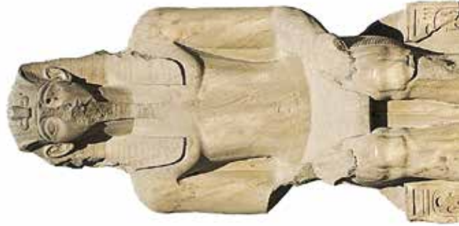
E. Le Caire, Musée égyptien, JE 45975.