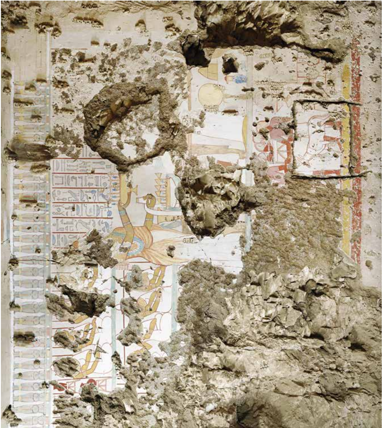
FIG. 2. La paroi sud (PM 1) : vue d'ensemble.