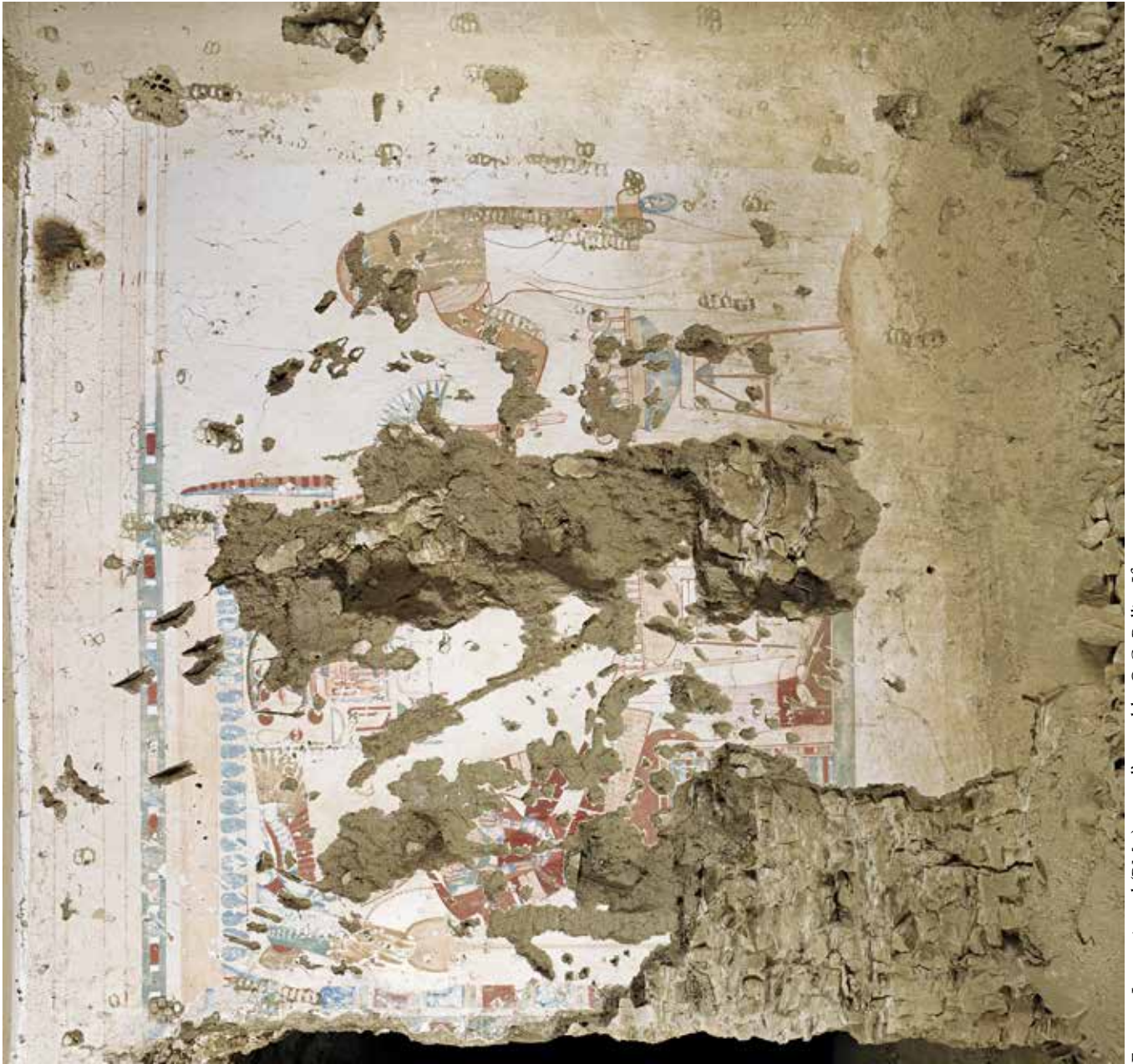
FIG. 1. La paroi nord (PM 2) : vue d'ensemble.