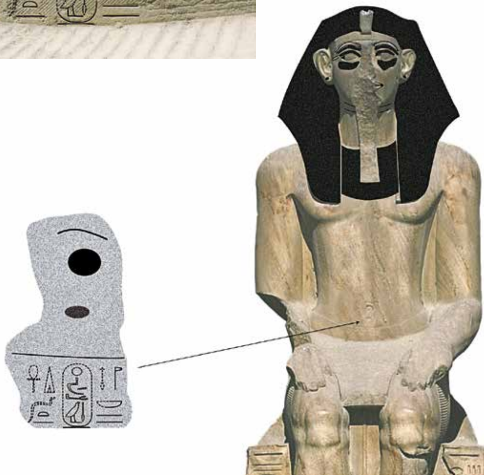
Pl. II. Le Caire, Musée égyptien, JE 45975.