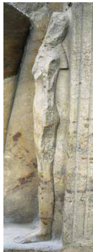
A,B,C. Le Caire, musée égyptien, JE 45975.