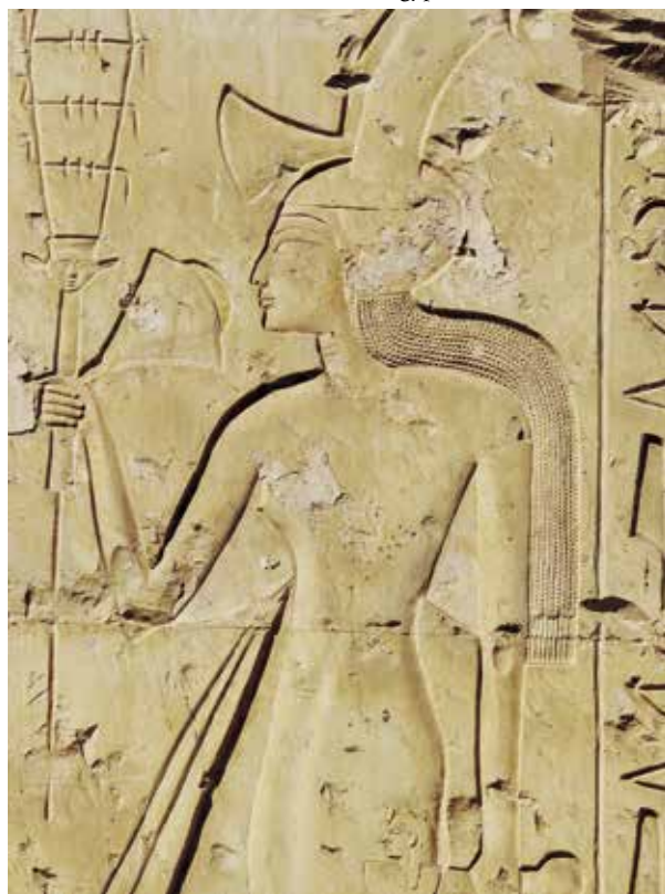
D. Détail du cortège de princesses (temple de Séthi I er à Abydos, 1 re cour, mur nord).