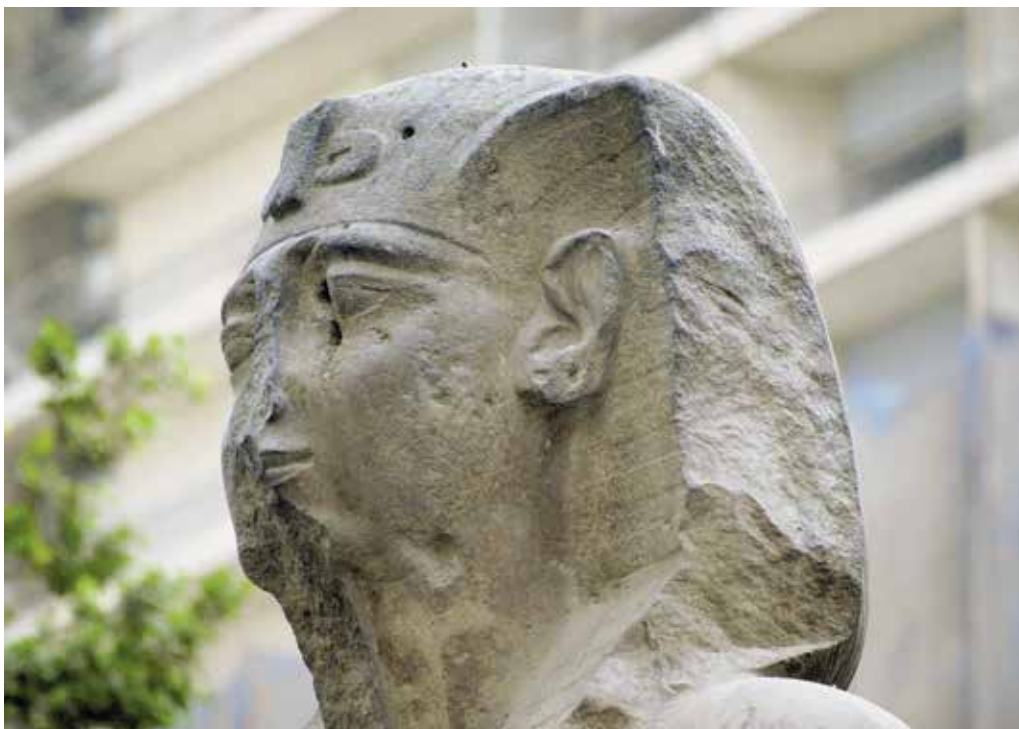
A. Le Caire, Musée égyptien, JE 45975.