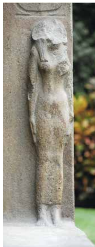
D,E,F. Le Caire, Musée égyptien, JE 45976.