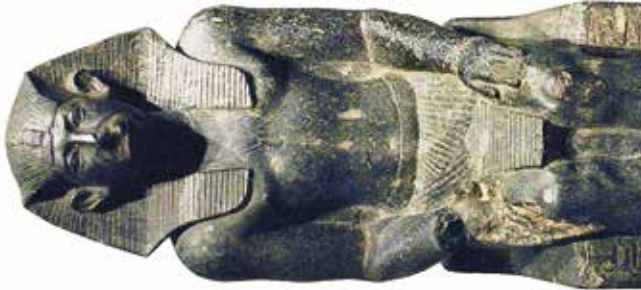
C. Sésostri III (Baltimore, Walters Art Museum, 22.115).