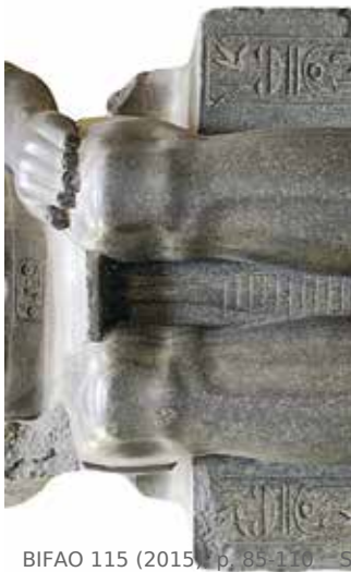
A. Amenemhat II ou Sesostris II (statue usurpée par Ramsès II) (Berlin ÄM 7264).