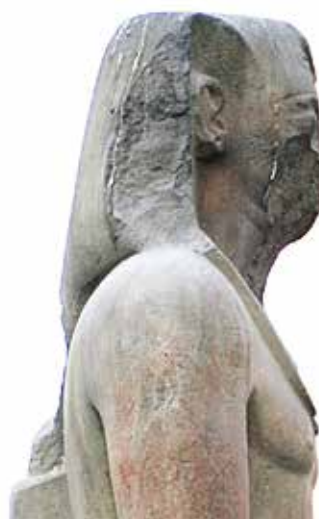
D. Le Caire, Musée égyptien, JE 45976.