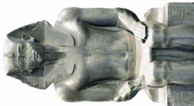
A. Amenemhat II ou Sésostri II (statue usurpée par Ramsès II) (Berlin ÄM 7264).