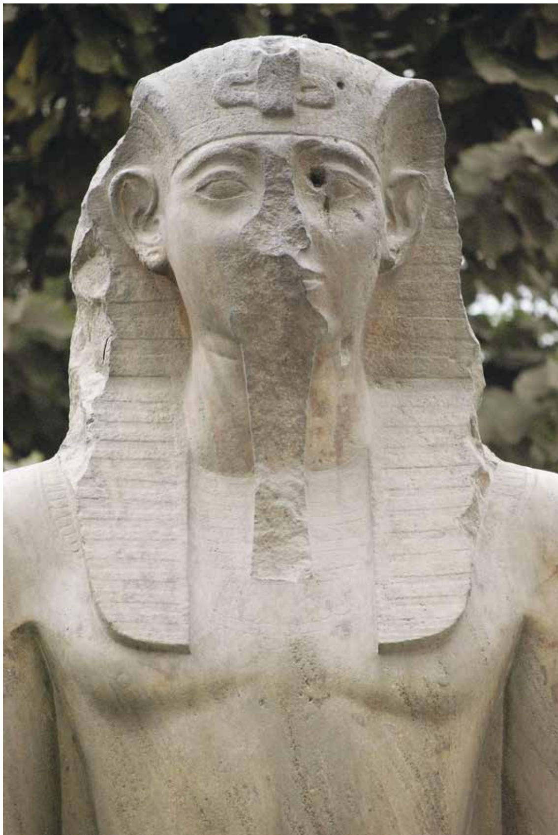
Pl. 10. Le Caire, Musée égyptien, JE 45975.