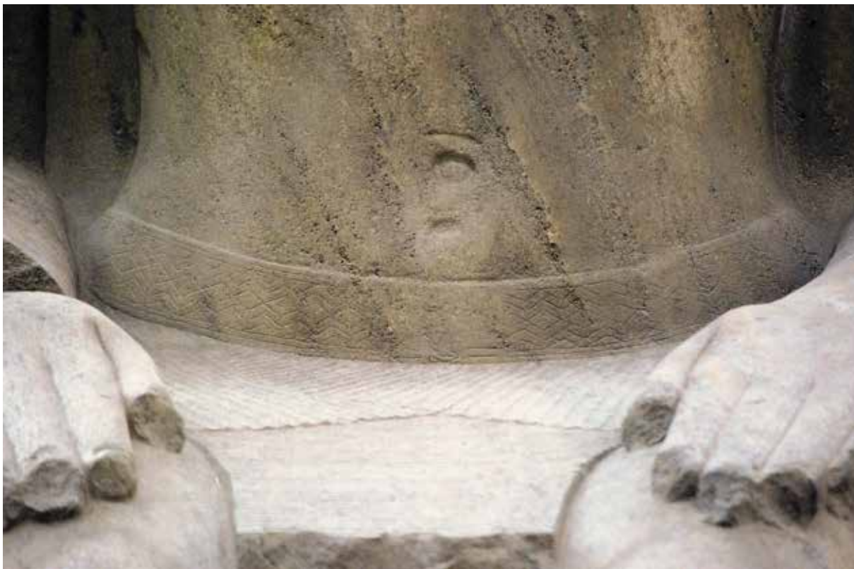
A. Le Caire, Musée égyptien, JE 45975.