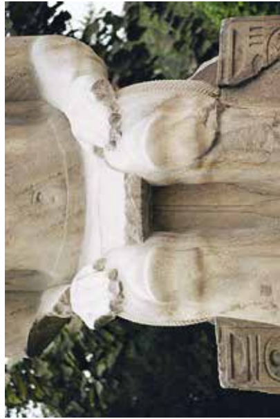
E. Le Caire, Musée égyptien, JE 45975.