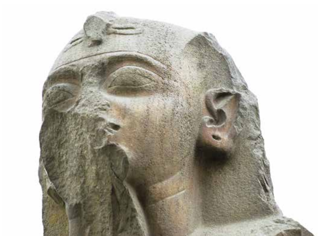
B. Le Caire, Musée égyptien, JE 45976.