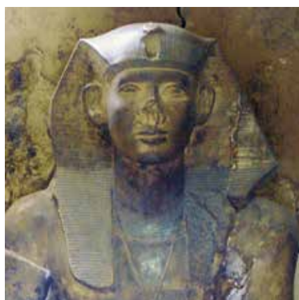
D. Néferhotep I er (Le Caire, Musée égyptien, CG 42022).