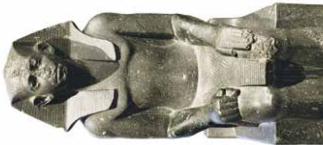
B. Sésostri III (Paris, Musée du Louvre, E 12960).