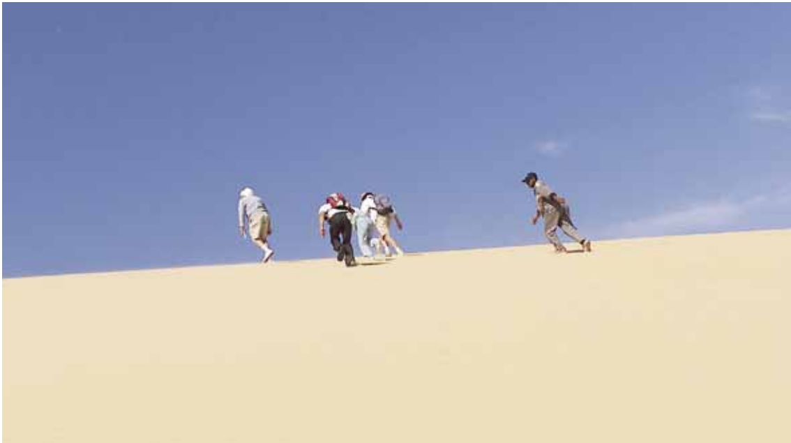
Douch, 2007, entraînant son équipe vers des sites toujours nouveaux.