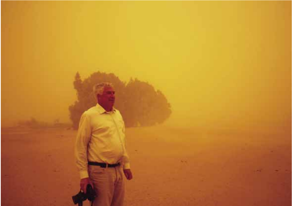
Douch, le 28 janvier 2013, dans la tempête de sable. La dernière image.