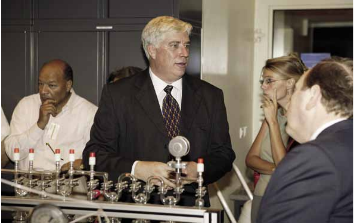
En 2006, lors de l'inauguration du laboratoire de datation ^{14}\text{C} .