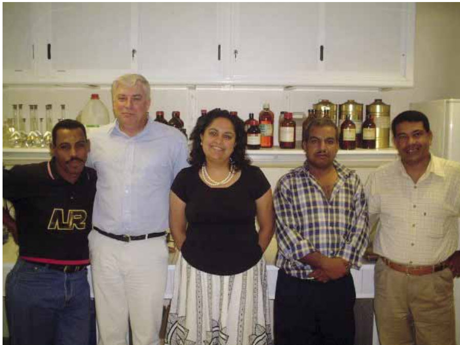
En 2013, avec son équipe du laboratoire de restauration.