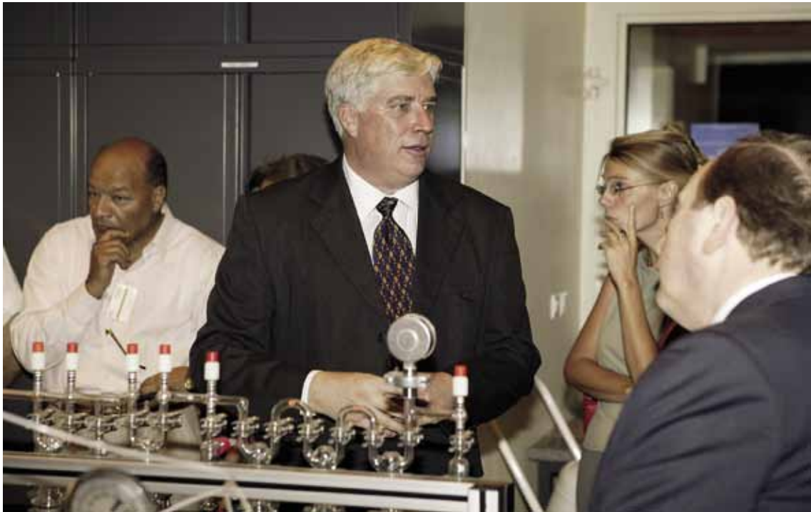
En 2006, lors de l'inauguration du laboratoire de datation ^{14}\text{C} .