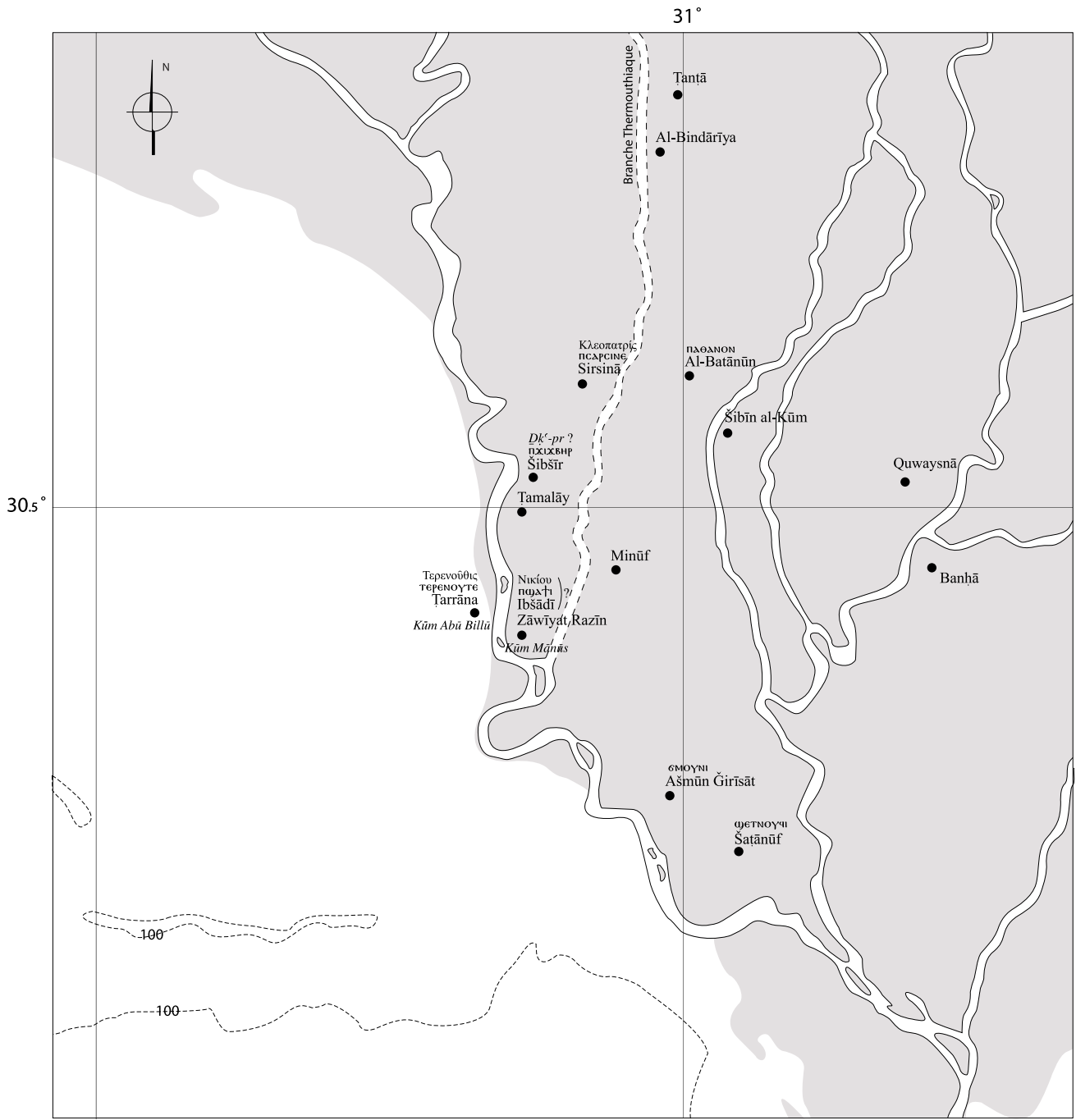
FIG. 2. Carte de la Minūfiya. Fond de carte dessiné d'après les cartes TAVO.