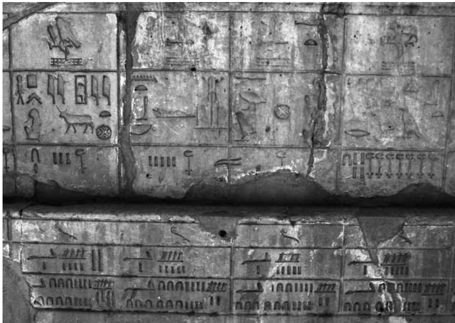
FIG. 4. Chapelle blanche, mur extérieur nord, soubassement.