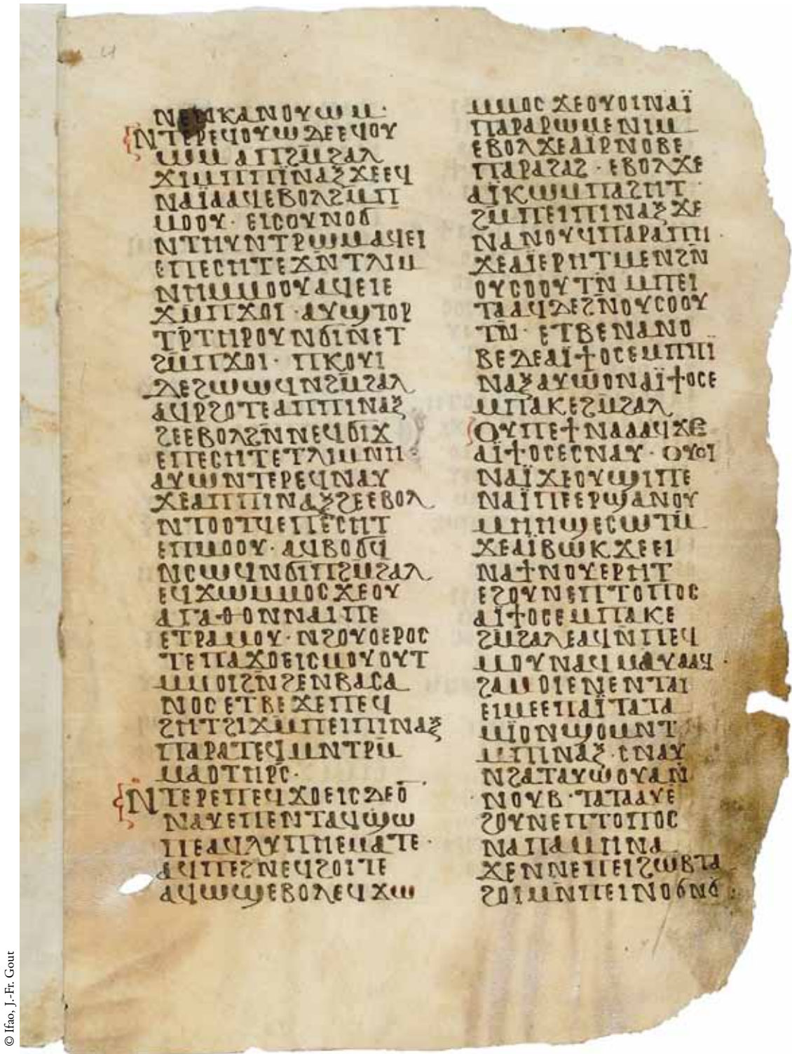
FIG. 7. Ifao inv. Copte 318, recto (p. 23).

(P.Lond.Copt. I 340, f° 2a): ...ⲉⲓⲱⲓϥ ⲟⲩⲟⲓ ⲛⲁⲓ [ⲕⲉ] ⲟⲩⲛⲟⲥ ⲛⲱⲓⲛⲉ [ⲛ]ⲁⲓ ⲛⲉ ⲛⲧⲛ ⲟⲩⲟⲛ ⲛⲓⲙ ⲉⲧⲛⲁⲥⲟⲧⲙ ⲕⲉ ⲁⲓⲱⲕ ⲕⲉ ⲉⲓⲛⲁⲧⲓ ⲛⲟⲩⲉⲣⲛⲧ ⲁⲛⲁⲕⲉⲙⲉⲙⲁⲗ ⲙⲛⲉⲣⲙⲟⲩ ⲛⲁⲕ ⲟⲩⲟⲓ ⲛⲁⲓ ⲕⲉ ⲛⲱⲓⲛⲉ ⲛⲛⲣⲟⲙⲉ ⲉⲟⲟⲩ ⲛⲁⲓ ⲉⲛⲟⲥ ⲛⲧⲁⲓⲧⲁⲗⲁⲕ ⲉⲙⲟⲓ ⲟⲛ ⲉⲛⲉⲛⲧⲁⲓⲉⲓⲙⲉ ⲉⲛⲁⲓ ⲛⲧⲁⲧⲁⲙⲓⲉ ⲱⲙⲟⲛⲧ ⲙⲛⲓⲛⲁⲥ ⲛⲉⲁⲧ ⲙⲛ ⲟⲩⲁ ⲛⲛⲟⲩⲱⲃ ⲛⲧ[ⲁⲧⲁ]ⲗⲁⲩ ⲉⲛⲧⲟⲓⲟⲥ ⲙⲛ[ⲛⲉ]- (f° 2b)-ⲧⲟⲩⲁⲗⲁⲃ ⲁⲛⲁ ⲙⲛ[ⲛⲁ] ⲕⲉ ⲛⲛⲉⲛⲉⲓⲛⲟⲥ ⲛⲱⲓⲛⲉ ⲧⲁⲉⲟⲓ ⲙⲛ ⲛⲉⲓⲛⲟⲃⲛⲉⲥ ⲉⲙⲟⲓ ⲟⲛ ⲛⲉⲓⲛⲁⲉ ⲉⲛⲥⲟⲙⲁ