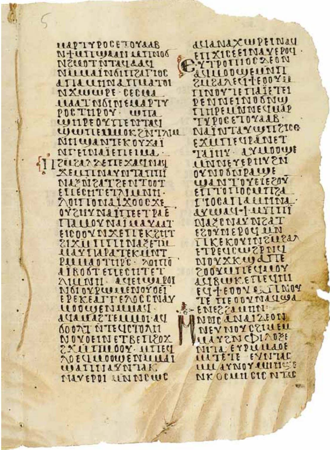
FIG. 9. Ifao inv. Copte 319, recto (p. 25).