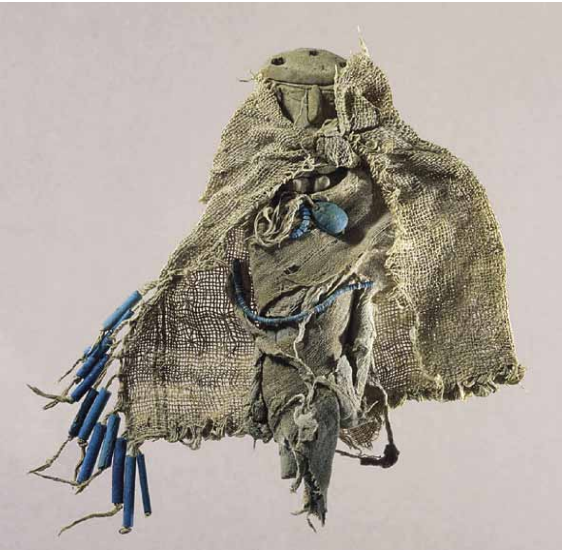
FIG. 2. Figurine féminine provenant du Gebel el-Zeit, Louvre E 27256. BIFAQ 1.1. (2 Pl.) in 73-34. Guillermo Ancochea et al. 2012. Antti Oksa, Christophe Moreau Datations par le radiocarbone des tissus votifs du Gebel el-Zeit, conservés au musée du Louvre.