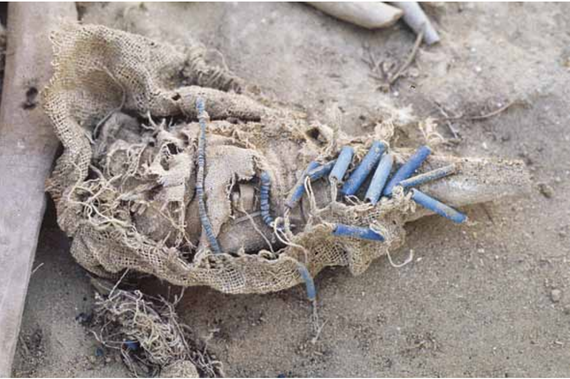
FIG. 1. Figurine féminine envelopée dans son tissu, au moment de sa mise au jour sur le site du Gebel el-Zeit.