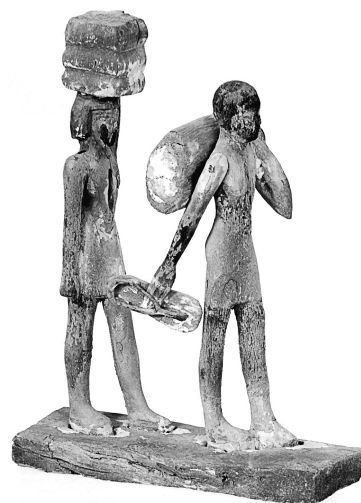
MeN Eg. 360.

Description : Scène représentant deux serviteurs en file indienne. Le premier tient une grande sandale dans sa main droite et maintient un sac sur son dos avec sa main gauche. Il a les cheveux courts, peints en noir. Le second serviteur transporte sur la tête une pile de linge qu'il maintient de sa main gauche. Sa perruque courte est noire. Tous deux portent un pagne court et ont la peau peinte en rouge. Les traits des visages, sculptés et rehaussés de polychromie, sont soignés. La base est stuquée et recouverte de la couleur typique de Saqqâra, gris vert.