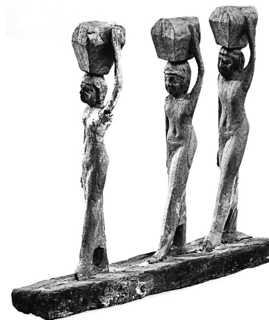
MeN Eg. 361.

Description : Défilé de trois porteuses d'offrandes en attitude de marche, la jambe gauche en avant. Chacune d'elles maintient de la main gauche un panier sur la tête, peint de couleur foncée avec une bande rouge. Toutes trois ont la peau peinte en jaune et portent une longue robe blanche qui met en valeur les courbes de leur corps. Leur nombril est également sculpté et laisse penser que leur vêtement est fait de lin fin, presque transparent. Elles sont coiffées d'une perruque courte noire. Le modelé des visages est assez soigné malgré la disparition quasi complète de la polychromie. La base est stuquée et recouverte de la couleur typique de Saqqâra, gris vert.