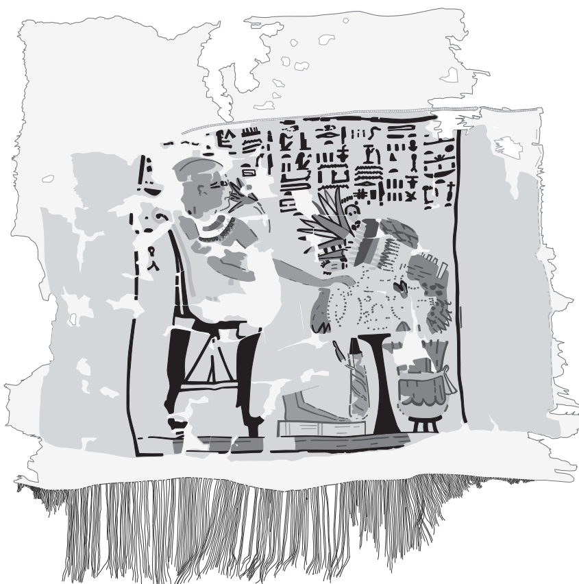
Carré de lin Caire, musée de l'Agriculture inv. 893.