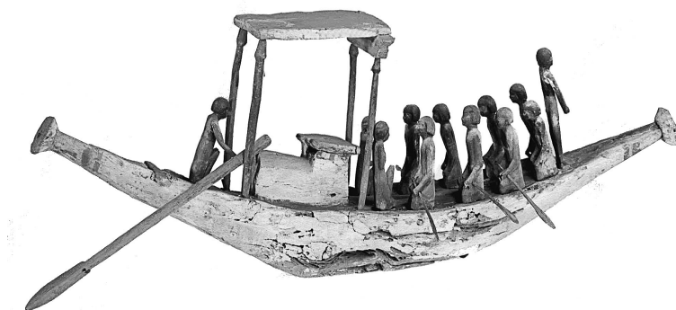
MeN Eg. 357.