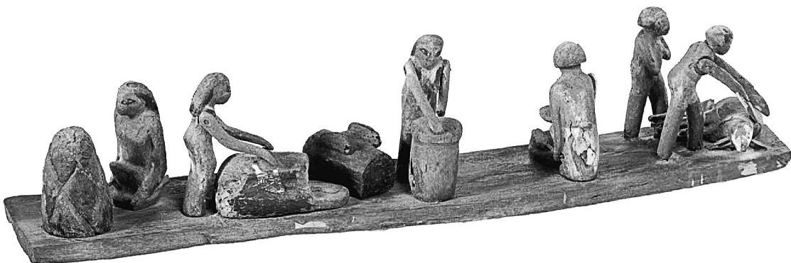
FIG. 2. MeN Eg. 354, cuisine sur base longue de la dame Mwt-htpj .