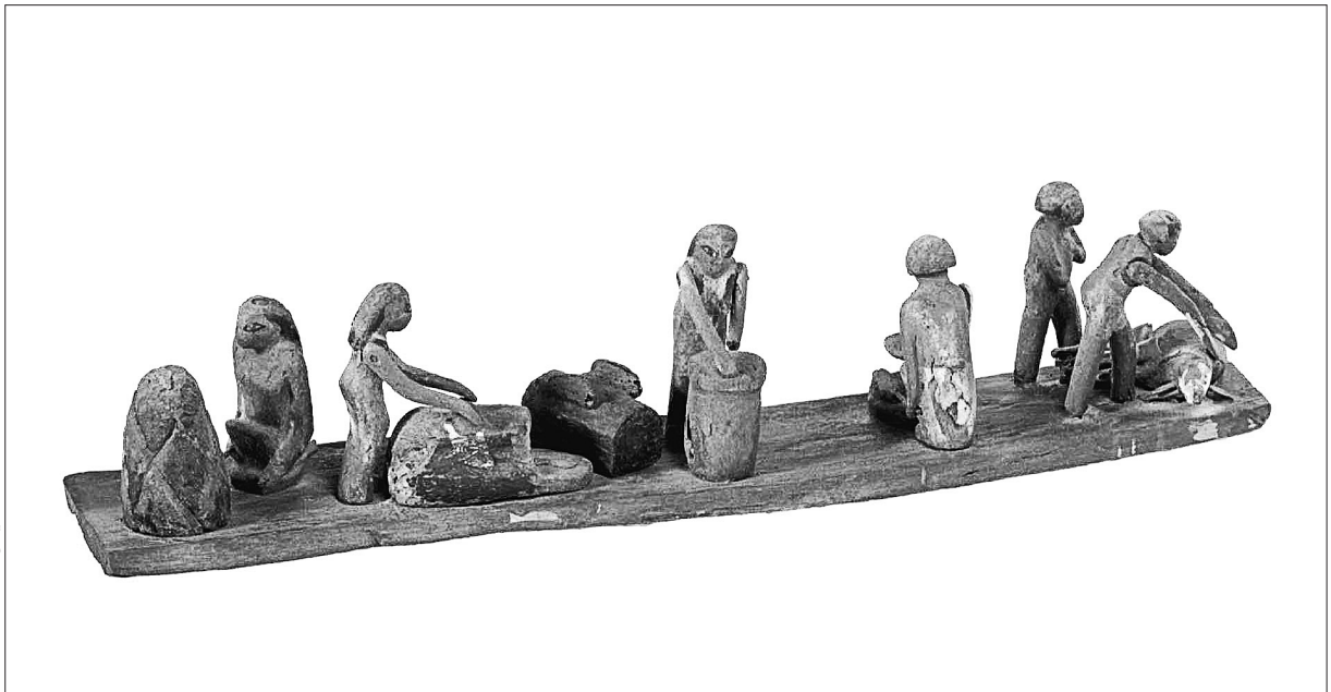
FIG. 2. MeN Eg. 354, cuisine sur base longue de la dame Mwt-htpj .