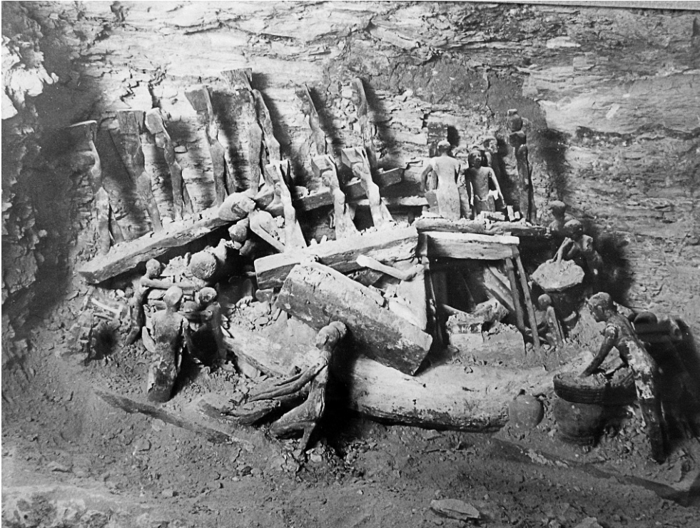
FIG. 1. Photographie prise dans la « tombe anonyme » lors de la découverte des modèles en bois (n° inv. MeN Eg. 355).