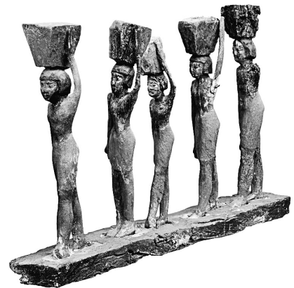
MeN Eg. 363.

Le serviteur en tête du défilé et les trois derniers sont représentés en marche, pied gauche en avant. Le deuxième serviteur a les pieds joints. Ils ont tous été réalisés à l'identique : vêtus d'un pagne court blanc, coiffés d'une perruque courte noire, peau peinte en rouge. Le modelé du visage est assez soigné : les yeux, les arcades sourcilières, le nez et la bouche sont sculptés. Leurs yeux sont peints : le fond est blanc et l'iris noir. Le dernier serviteur est plus endommagé que les autres : son bras gauche a disparu, le stuc est très craquelé. La base est stucquée et recouverte de la couleur typique de Saqqâra, gris vert.