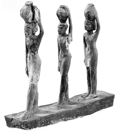
MeN Eg. 362.

Description : Défilé de trois porteurs d'offrandes : les deux premiers, à partir de la gauche, ont la jambe gauche en avant, le dernier personnage est en position statique, les pieds joints. Tous trois, poings serrés, portent une jarre sur la tête, maintenue de leur main gauche. Leur peau est peinte en rouge, ils sont vêtus d'un pagne court blanc. Le premier et le dernier serviteur portent une perruque courte noire. Le deuxième n'en porte pas et a les cheveux courts. Le modelé du visage est assez grossier. Les yeux, dont le fond est peint en blanc et l'iris en noir, présentent un meilleur état de conservation chez le premier des personnages. La base est stucquée et recouverte de la couleur typique de Saqqâra, gris vert.