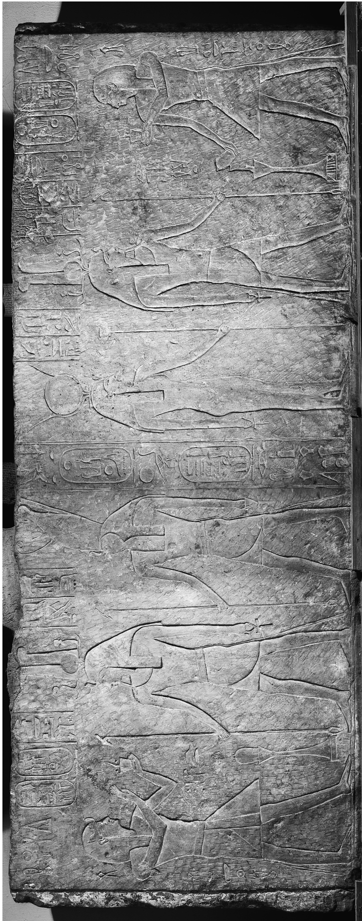
FIG. 1. Linteau Caire RT 2/2/21/11 Caire.