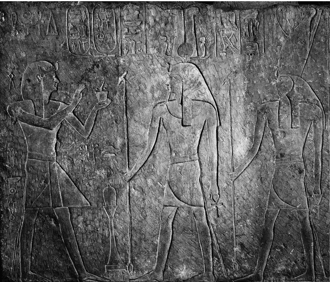
FIG. 2. Linteau Caire RT 2/2/21/II, scène de droite.