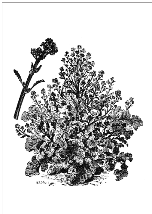
FIG. 1. Brassica oleracea italica .

– O. Krok. inv. 85.4-6 : ἔπεμψά σοι δέσμη κράμβης ἀριθμῶ καυλία λβ, « je t'ai envoyé une botte de chou qui contient 32 tigelles » ;