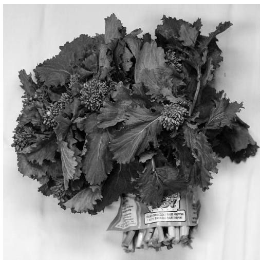
FIG. 2. Une δέσμη καυλίων.