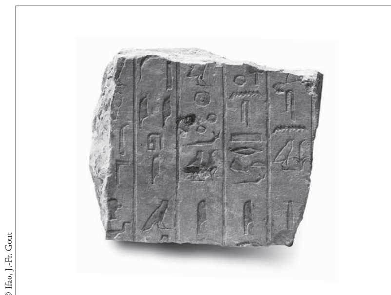
FIG. 1. Fragment AII 1453, montrant la ligne de séparation gravée entre les deux registres AII/F/Se sup et AII/F/Se inf.