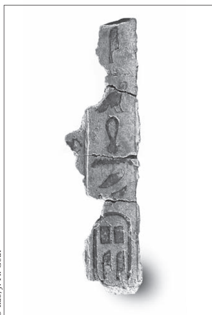
FIG. 6. Fragments AII 1643-1646 (AII/F/E sup 17-18), où figurent le terme nhj.wj et le déterminatif du scorpion pour la déesse Hédjédjet.