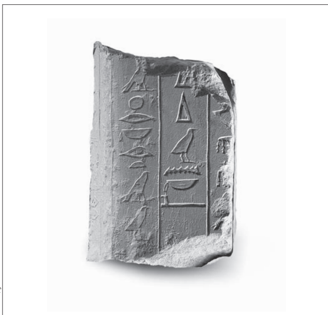
FIG. 4. Fragment AII 1141 (AII/F/E sup 59-61), montrant l'espace laissé vide après la fin de la formule TP 460.