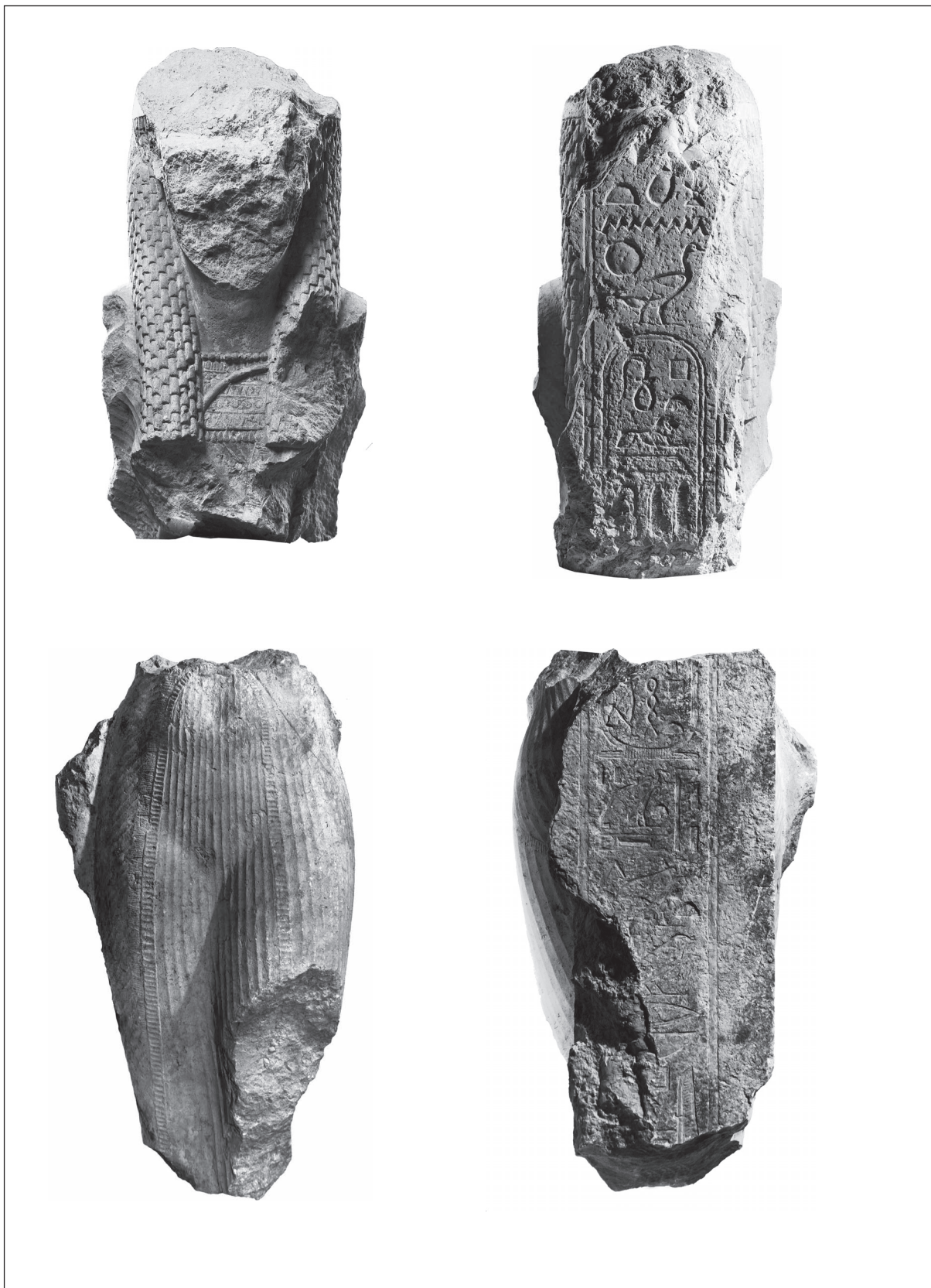
Fig. 1. Cléopâtre II, Karnak Cheikh Labib 94CL1421 (cliché A. Chéné, Cfeetk) + Caracol R177 (cliché A. Bellod, Cfeetk) ; montage A. Chéné.