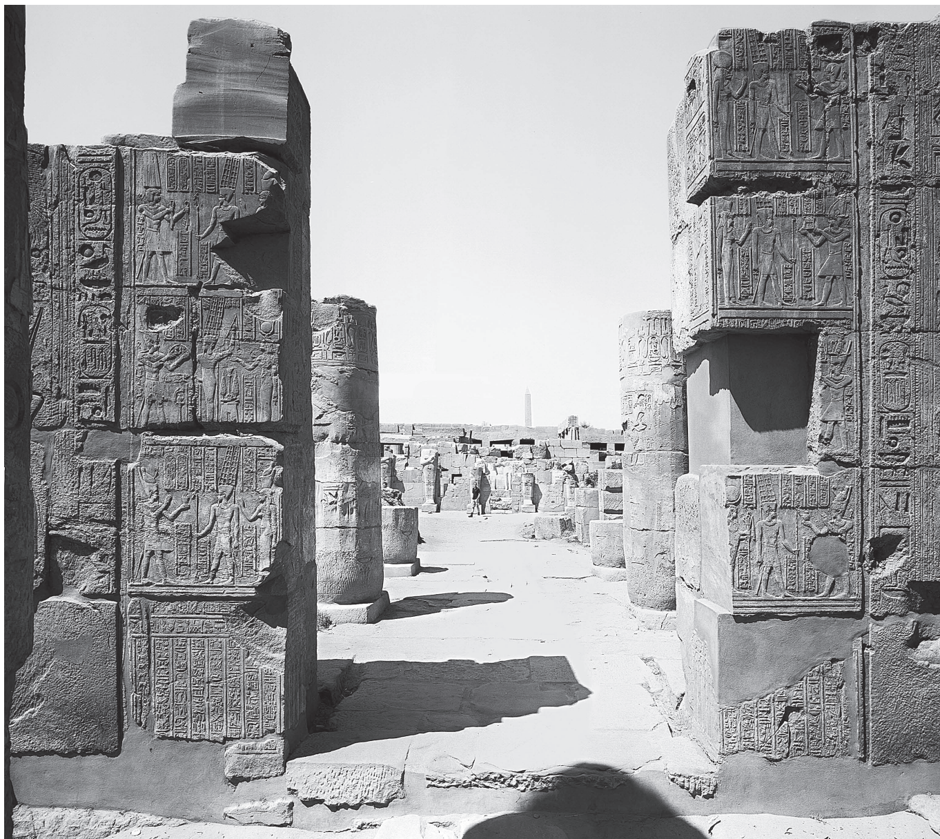
Fig. 2. La porte de Ptolémée VIII dans le « temple de l'Est » de Karnak.