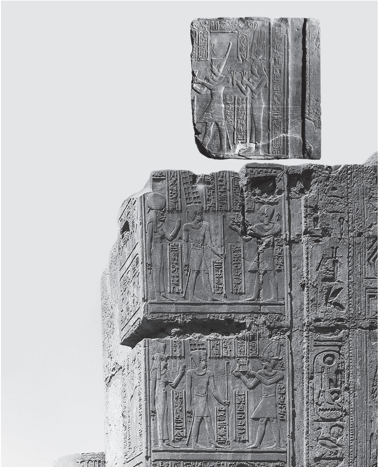
Fig. 3. Restitution du bloc Berlin inv. 2116 en haut du jambage nord de la porte (Montage d'après cliché Staatliche Museen zu Berlin en haut, cliché A. Chéné CFEETK, en bas).