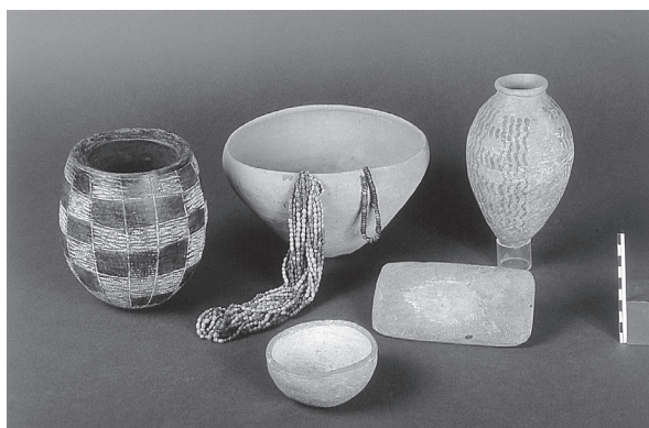
Fig. 2. Adaïma. Matériel du cimetière de l'Est.

L'excellent état de conservation des matériaux organiques et le caractère intact des tombes permettent, dès à présent, de mettre en perspective les informations issues de la fouille des tombes du cimetière de l'Ouest. Ainsi, par exemple, les différentes valeurs attachées aux offrandes céramiques deviennent-elles plus explicites. La récurrence de dépôts organiques en forme de galette en présentation