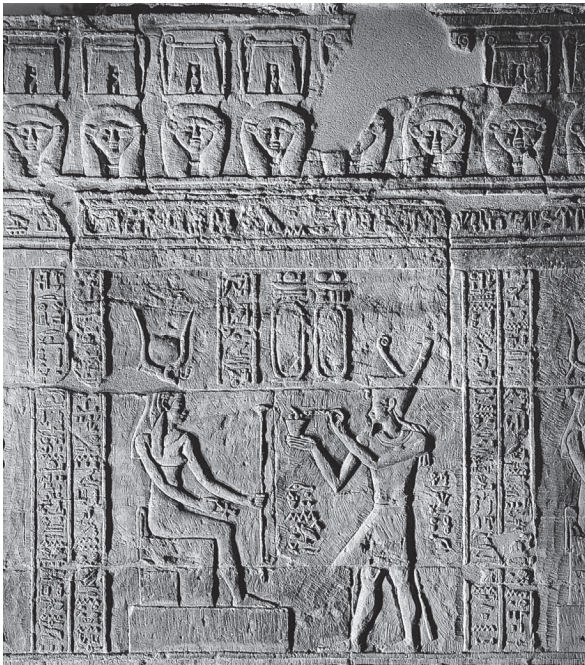
Fig. 10. Temple de Tôd. Salle des déesses. Offrande de l'encens à Hathor.

porte de la salle des offrandes. Au terme de cette campagne, l'ensemble de la partie inédite du temple de Tôd est relevé en fac-similé. Toutefois, deux exceptions majeures demeurent : les cryptes, pour lesquelles les dessins de M me Vandier d'Abbadie seront utilisés pour la publication, et quelques scènes du mur nord de la chambre des déesses, mur démonté jadis pour permettre l'étude du texte du Moyen Empire.