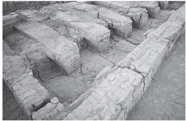
Fig. 6. 'Ayn Asil. Palais, magasins voûtés, travée est, vue générale.

Ainsi une grande partie au moins des magasins du niveau bas servait-elle à stocker des produits contenus dans des jarres : huiles ou autres. Si l'on calcule la surface de stockage effective des magasins sur deux étages, déduction faite de celle des couloirs, on obtient le chiffre assez considérable de 298 m 2 .