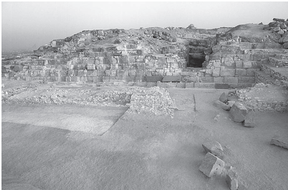
Fig. 1. Pyramide d'Abou Rawash. Face nord.

Édifié au sommet d'un éperon calcaire, le complexe funéraire était accessible, depuis le ouâdi Qaren, par une chaussée montante, dont le tracé s'achevait au pied d'une enceinte. Destinée à circonscrire les limites du domaine royal, cette muraille extérieure était dotée d'une entrée, ouverte sur une voie qui cheminait, en direction du sud-est, vers la porte d'une seconde clôture. Ce mur isolait ainsi la pyramide et ses constructions adjacentes du rempart extérieur et délimitait entre eux un vaste espace, étendu sur plus de 90 m.