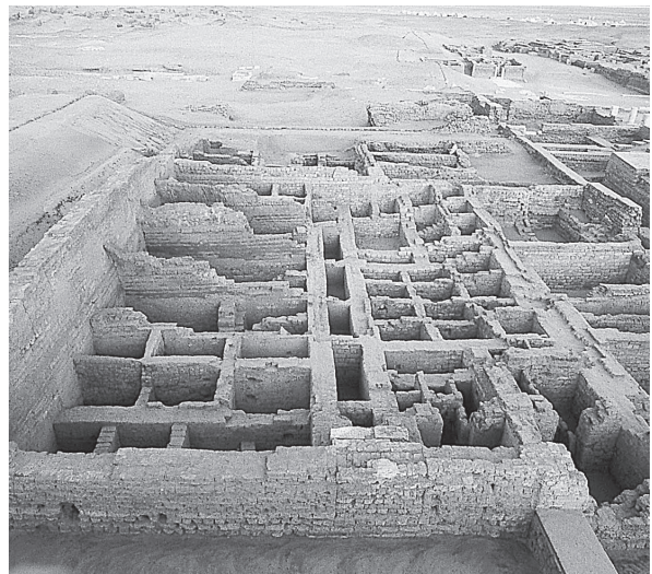
Fig. 9. Tebtynis. Le thesauros .

Situé au nord-ouest de l'ensemble thermal dégagé en 1997 et 1998, avec lequel il avait une partie de son mur ouest en commun, le thesauros était un édifice de plan carré de 20 m de côté couvrant une surface d'environ 400 m 2 . Il était de tout temps bordé par une rue sur son côté nord et en partie sur son côté ouest, tandis que la rue qui le longeait à l'est au moment de sa construction a été obstruée par la suite par de nouveaux bâtiments. L'entrée était située à l'ouest et s'ouvrait sur un étroit couloir orienté d'est