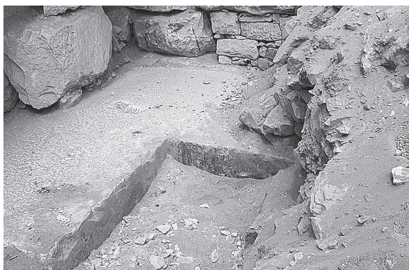
Fig. 5. Le fort de Qaret al-Toub. Escalier ESC 205.

La pièce PCE 203 est établie à l'intérieur et dans l'épaisseur de la courtine est, à la limite septentrionale du sondage. Les parois en sont couvertes d'un enduit blanc et noir bien conservé par endroits; une niche est aménagée dans la paroi nord et une issue s'ouvre vers le