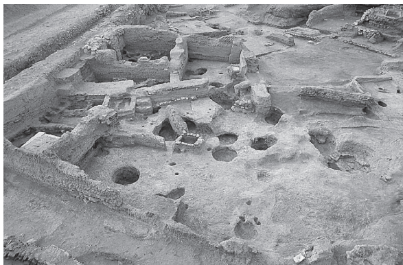
Fig. 11. Istabl' Antar. La maison omeyyade.

Lors de la phase suivante, qui correspond   l' dification de la maison, la plupart des murs ont  t  construits sur des fondations importantes, en gros blocs de pierre, en brique crue ou cuite. Les tranch es ont plus d'une fois recoup  les niveaux ant rieurs. L'entr e se faisait par la ruelle   l'ouest. Il y avait alors deux grandes pi ces au nord de la maison et une   l'ouest. Le reste de la surface  tait occup  par une grande cour, dans laquelle ont  t  observ es de nombreuses traces de plantations : petites fosses remplies de limon du Nil ou v ritable jardinet (reconstruit lors d'un second  tat de cette phase) avec des parois de brique, au centre. Diff rents espaces, dans la cour, sont d limit s par des murs d'amphores, parfois plant es t te-b che. Dans la « pi ce » nord-est, des am nagements tr s particuliers ont  t 