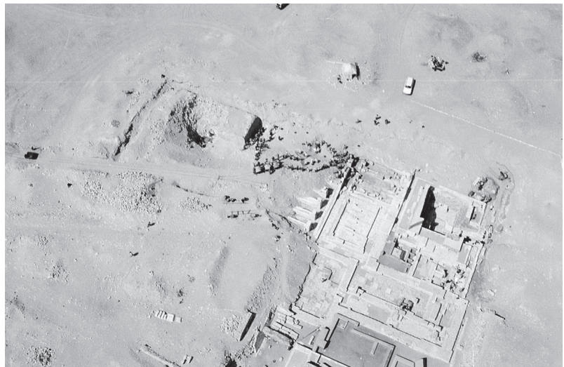
Fig. 12. Saqqâra-Sud. Complexe funéraire de Pépy I er . Dégagement du temple funéraire et de la pyramide de la reine mère Ânkhesenpépy II.