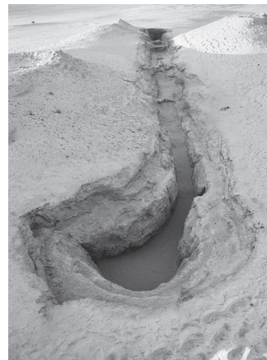
Fig. 4. 'Ayn Manâwîr. Le puits artésien et le conduit de la qanât MQ14.

Un puits artésien a été creusé et une galerie de drainage avait pour but d'acheminer l'eau par gravité dans la plaine [fig. 4]. Au cours de cette campagne, nous avons pu reconnaître le puits et environ 50 m du conduit. Le puits de forme circulaire (environ 3 m de diamètre) conservait encore en partie sa couverture de bois (poutres de palmier-doum). Le conduit est une tranchée à ciel ouvert, voûtée dans un second temps; la voûte en briques crues est incomplètement conservée. De part et d'autre du conduit, les tas de déblais issus du creusement sont visibles et marquent nettement le paysage. Dans la zone la plus en aval, des aménagements ont été observés: il s'agit de deux volées d'escalier, l'une sur le côté est, l'autre sur le côté ouest. Les marches permettent de descendre dans la qanât alors que l'ensablement de celle-ci était déjà en cours, les marches reposant sur le sable.