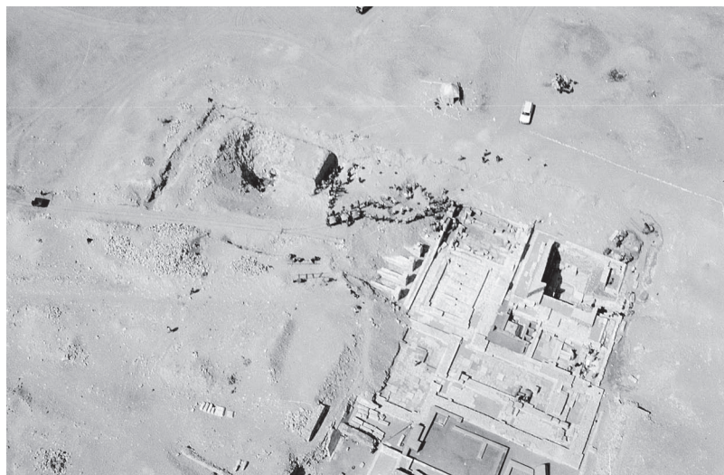
Fig. 12. Saqqâra-Sud. Complexe funéraire de Pépy I er . Dégagement du temple funéraire et de la pyramide de la reine mère Ânkhesenpépy II.