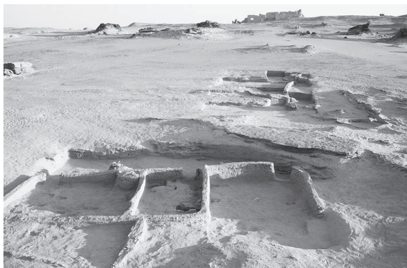
Fig. 3. 'Ayn Manawir. L'habitat DEN et la zone agricole en terrasse au sud.

Des adjonctions postérieures – quatre pièces – de type agglutinant, aux murs curvilignes en briques crues, se sont installées contre le bâtiment principal décrit précédemment. L'usage artisanal de deux de ces pièces est évident, de par la présence d'aménagements en briques destinés à recevoir des meules et des foyers.