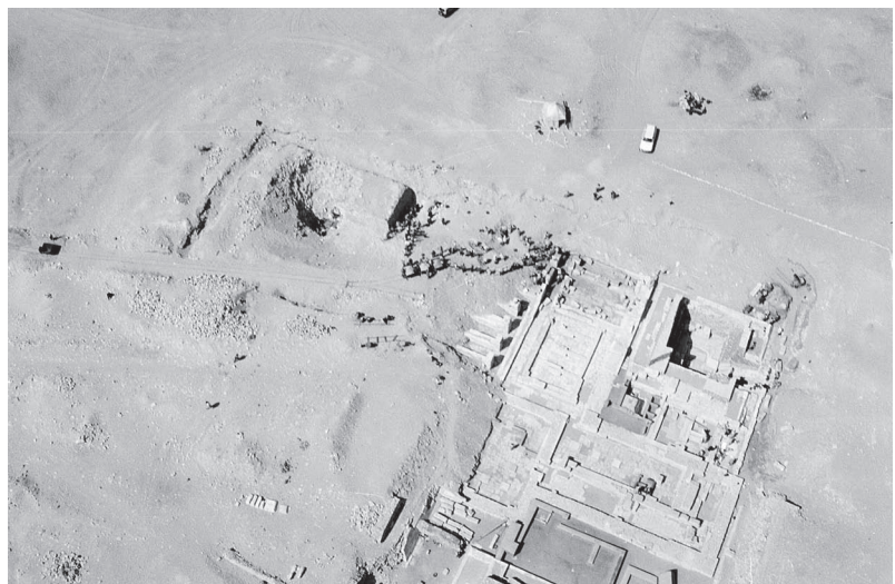
Fig. 12. Saqqâra-Sud. Complexe funéraire de Pépy I er . Dégagement du temple funéraire et de la pyramide de la reine mère Ânkhesenpépy II.