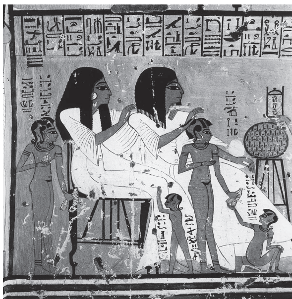
Fig. 7. Tombe d'Inherkhâouy (TT 359).

G. Andreu a préparé l'exposition qui se tiendra au Louvre au printemps 2002 sur le thème « Vies d'artistes sous les Ramsès », et qui sera consacrée tout entière au site de Deir al-Medîna. Ce sera l'occasion de montrer l'apport exceptionnel et multiple des objets provenant de ce site, en même temps que de mettre en valeur ce qui fut un des grands chantiers archéologiques de l'Ifao, entre 1922 et 1952.