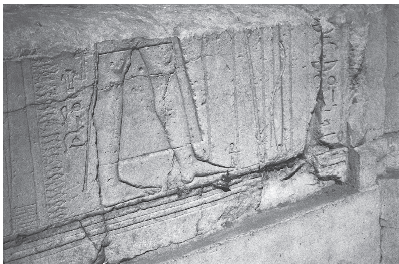
Fig. 2. Le roi sort du palais. Kiosque médian, paroi nord.