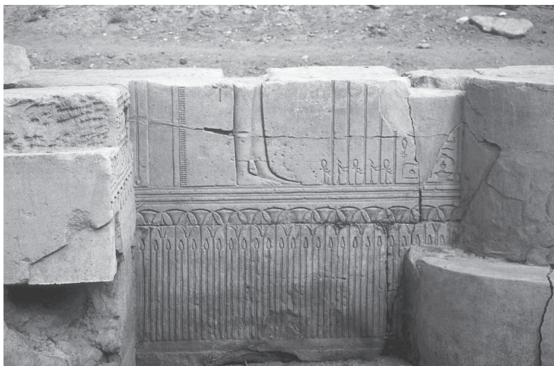
Fig. 1. La reine sort du palais. Kiosque nord, face interne du mur nord.

Malgré bien des points obscurs dans la chronologie, malgré le mystère qui reste encore partiellement attaché à la scène, cette représentation de Cléopâtre sortant du palais à Médamoud est une pierre à apporter à la reconstitution de l'histoire de cette période confuse; en outre elle confirme avec éclat la tradition monarchique essentielle de ce temple.