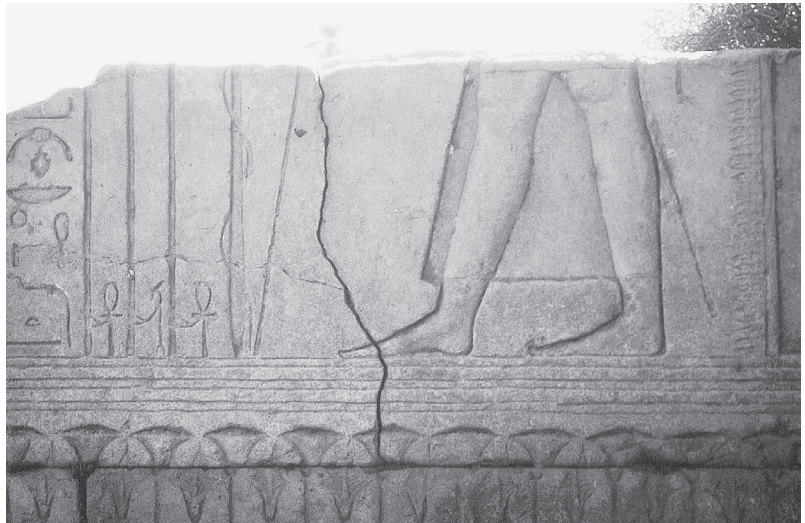
Fig. 3. Le roi sort du palais. Kiosque nord, paroi sud.