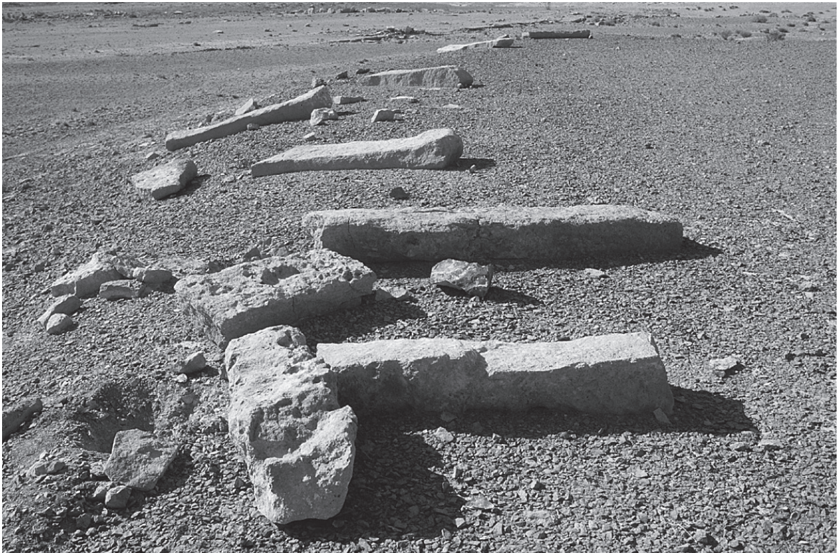
Fig. 6. 'Ayn Shalala, alignement de monolithes.