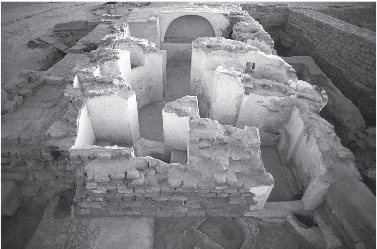
Fig. 2. Le bain sud.