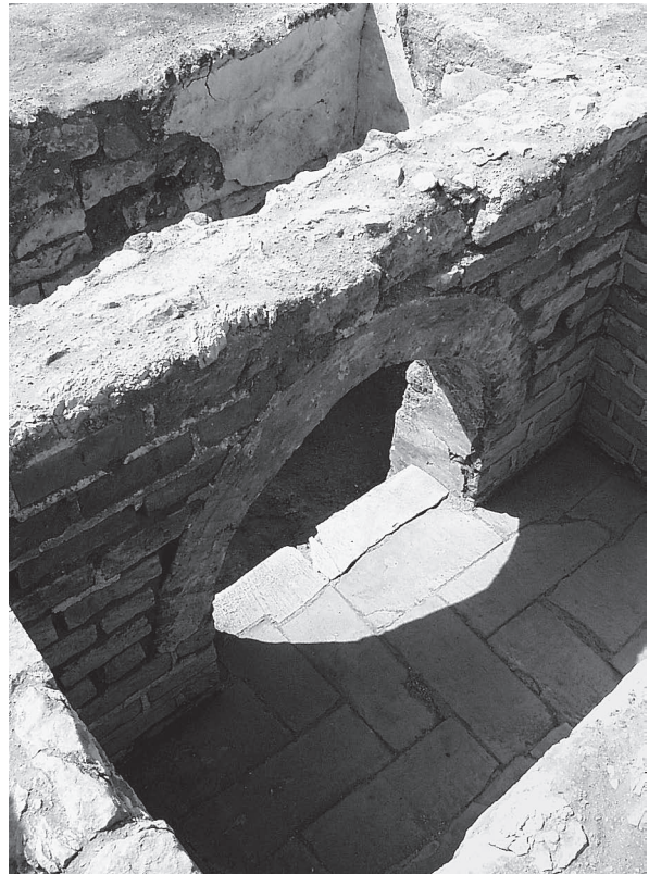
Fig. 5. Détail des deux pièces sous la qubba.

On a fouillé l'angle sud-ouest de la concession de fouille, et dégagé ainsi un nouveau mausolée abbasside. Le dégagement n'est pas intégral, car la limite sud du bâtiment continue sous les remblais de fouille et le mur nord a sans doute été détruit. Le mausolée B15 se situe de l'autre côté de l'aqueduc par rapport au grand mausolée B7, fouillé en 1994. Ce dernier a une surface d'au moins 1400 m 2 , alors que le mausolée B15 mesure, dès à présent, plus de 1200 m 2 . Cela donne une certaine idée de la monumentalité de ces mausolées (le mausolée voisin d'Al-Hadra al-Sharîfa, qui est conservé sur sa hauteur d'origine, donne cette impression, alors que sa surface n'excède pas 750 m 2 ). Ce mausolée abbasside a été, comme les autres,