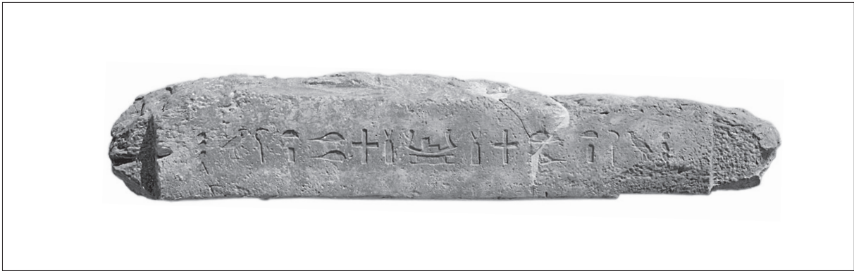
Fig. 1. Linteau portant la titulature de Medou-Nefer.

voûtes. Ils ont été cassés et remblayés pour la construction du niveau de la deuxième phase préincendie, et il ne reste que des traces de leur contenu. Les deux seuls éléments dont la présence se laisse déduire de manière certaine de l'étude des tessons de la couche de destruction sont de grandes jarres de stockage et des « jarres à bière ».