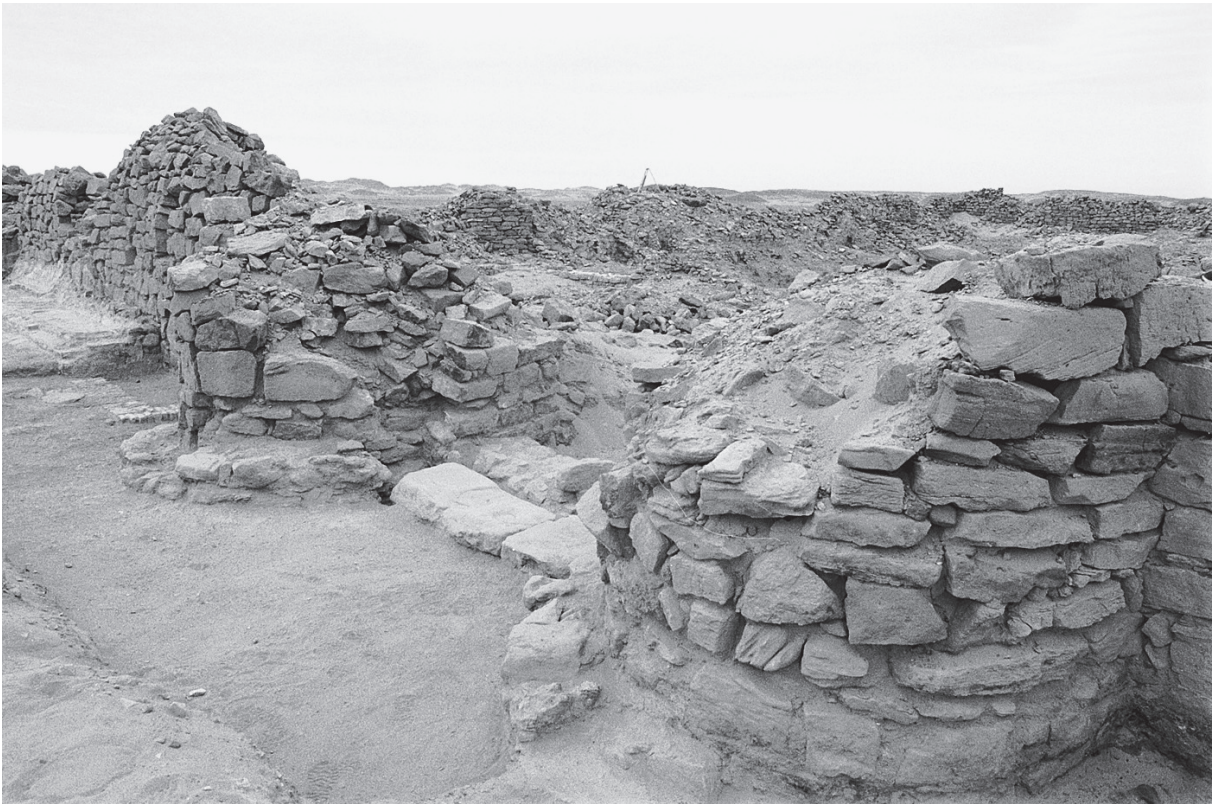
Fig. 3. Khashm al-Minayh : les enceintes.

américain J. E. Knudstad (équipe H.T. Wright). Henry Wright a très obligeamment mis ce plan à la disposition de l'équipe, qui l'a recalé dans son propre système de coordonnées. L'utilisation d'un TDM fourni par l'Ifao a grandement facilité cette opération et a permis, en outre, d'effectuer un relevé topographique sommaire des abords du fort, jusqu'à une petite nécropole située à quelques centaines de mètres de l'établissement principal.