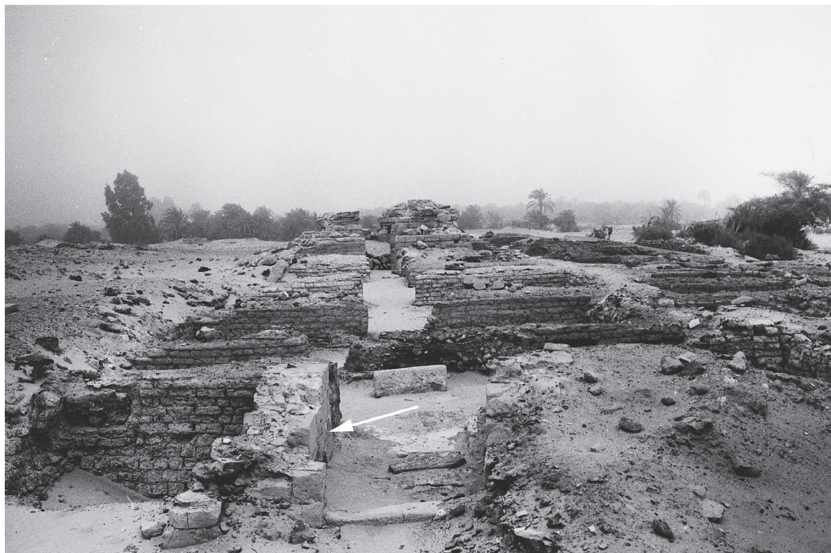
Fig. 1. Photographie du temenos dit « d'Alexandre » depuis le sud-ouest. À l'avant plan, la porte d'entrée où est inscrit le graffito , indiqué par la flèche.