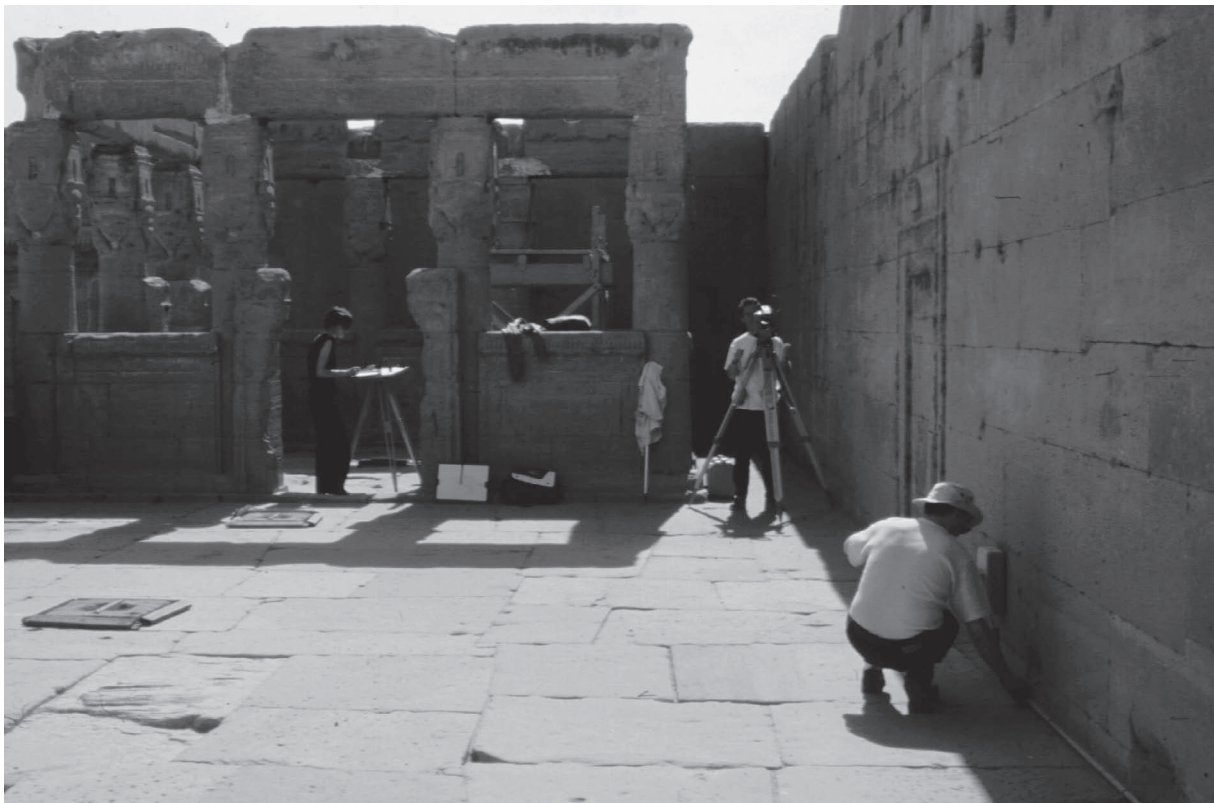
Fig. 4. Relevé du kiosque romain.

Une couverture photographique des détails architecturaux a été commencée par Alain Lecler.