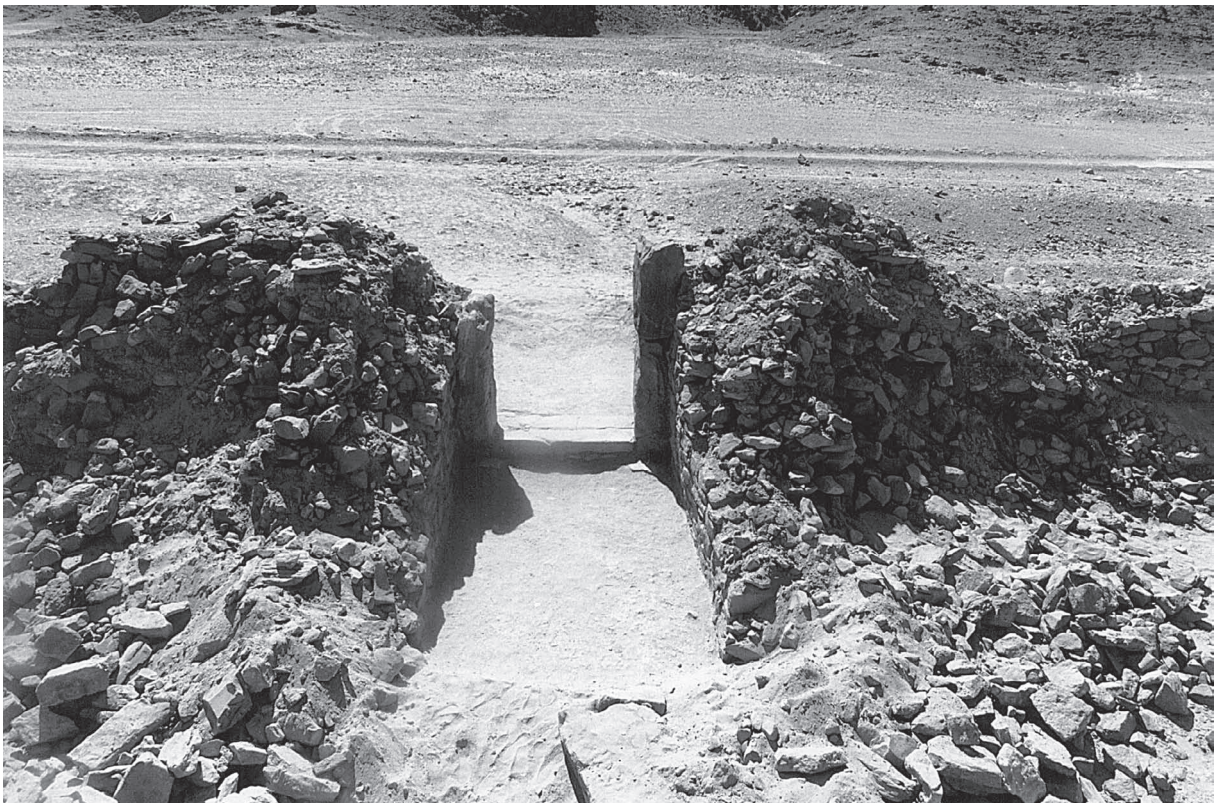
Fig. 6. Intérieur du fort d'Al-Dawwī : la porte.

Le mobilier mis au jour, très pauvre, comprend des cruches et des gourdes d'Assouan dont on a trouvé de grandes quantités à Maximianon (mais pratiquement aucune à Krokodilô). Là encore une datation dans le courant du II e siècle semble probable. La rareté du matériel, l'absence de dépotoir plaident pour une occupation peu intense, peut-être de courte durée.