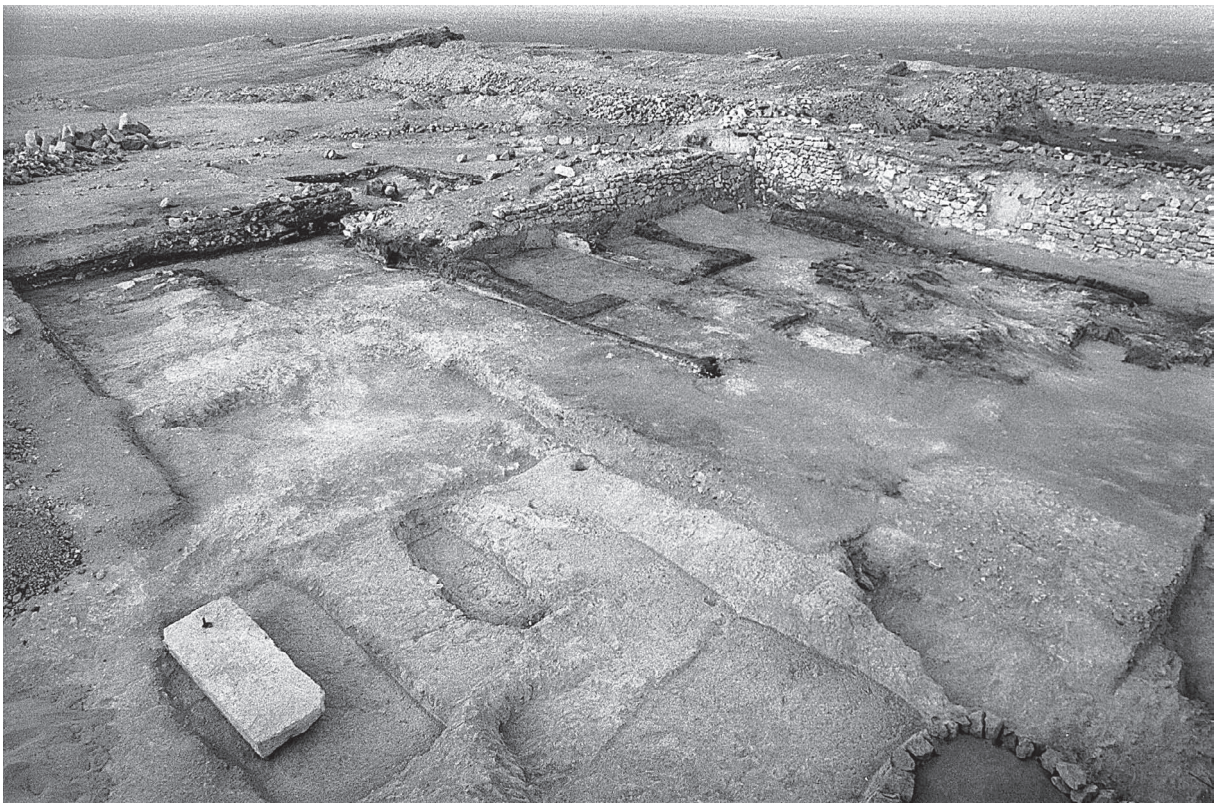
Fig. 2. L'angle nord-est.

Dans cet agencement, il avait été observé qu'un bloc (dim. : 2,00 × 0,78 m ; alt. : 157,95 m), rapporté, avait été soigneusement jointoyé au moyen d'un mortier de plâtre. Sa dépose, cette année, a montré que cette dalle ne scellait aucun dépôt de fondation, en dépit de sa position. Seule une poignée de sable occupait le fond de cette cavité. Un cas similaire, découvert sur la face est de la pyramide de Chéops, a déjà été signalé, autrefois, par Georges Goyon ( BIFAO 67, 1969, 83-86).