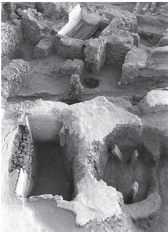
Fig. 8. Détail des tombes T 100, 101 et 102.

La fouille de cette année a duré moins longtemps que d'habitude, du fait de la convergence de plusieurs fêtes, dont le grand Baïram. Plusieurs bâtiments fatimides ont été mis au jour, qui ne datent pas tous de la même époque. Bien entendu, ces bâtiments ont un caractère funéraire. La nouveauté vient de ce que certains d'entre eux appartiennent à une autre tranche chronologique, à savoir qu'ils sont postérieurs à la destruction générale de la nécropole à la fin du XI e siècle: ce sont des bâtiments qui ont sans doute été construits après 1095. Un bâtiment funéraire – B 10 – présente une orientation dans le sens de la qibla et comporte deux tombes d'origine, dont au moins une avec cercueil (fin X e fin XI e siècle). Il s'agit vraisemblablement d'une mosquée funéraire; « mosquée » car, jusqu'à présent, aucun mausolée – abbasside ou fatimide – n'est orienté parmi ceux qui ont été exhumés. Par contre, les deux seuls monuments orientés trouvés jusqu'à présent sont des mosquées.