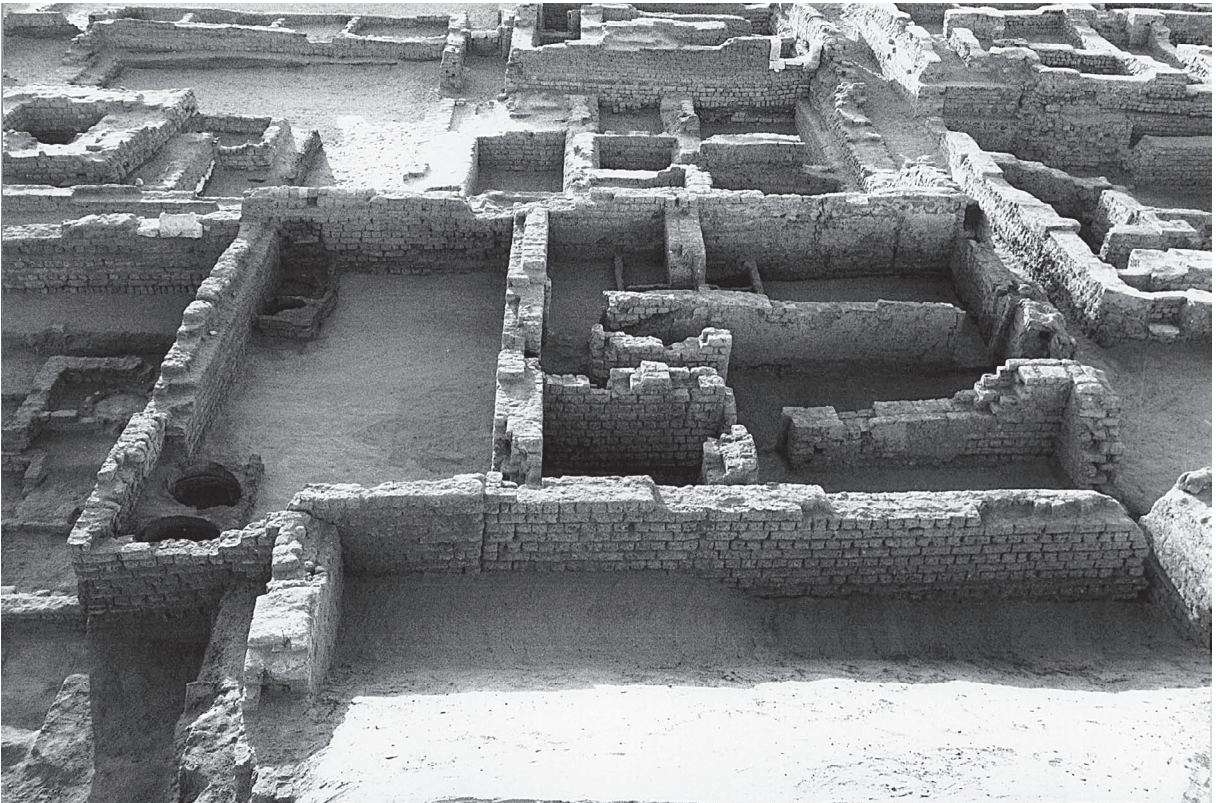
Fig. 5. Maison 2700, vue est.

Sous la cour ont été conservés les vestiges de structures antérieures à sa construction, mais ayant en partie appartenu à la maison 2700. L'élément le plus important de ces vestiges est un porche surélevé de trois marches qui permettait l'accès au sud de la maison. Le niveau de la rue était en effet en contrebas par rapport à celui de la maison. Très rapidement, deux cours vinrent se greffer au porche. L'une, à l'est, était indépendante de la maison 2700 et semble avoir été en relation avec le bâtiment 4700, plus au sud. L'autre, à l'ouest, isolait le porche de l'espace situé au sud-est de la maison : elle se développait vers le sud et s'appuyait vraisemblablement à l'ouest contre le bâtiment nord-est de l'enclos et la cour accolée au sud de ce dernier – comme l'a montré la campagne de 1993. Pour atteindre le porche de la maison 2700, il fallait alors forcément passer par la rue qui longeait le bâtiment à l'ouest. Aucune installation particulière n'a été découverte dans cette cour.