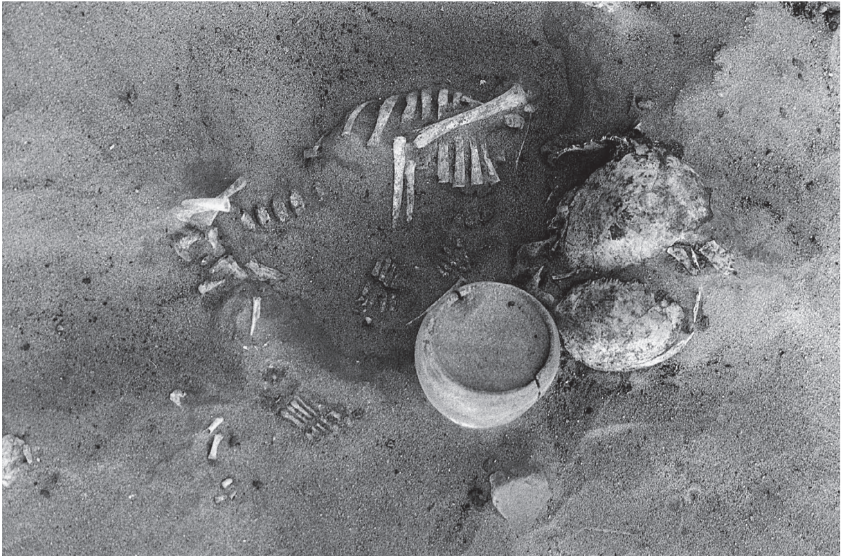
Fig. 1. Sépulture en site d'habitat.

plus importante qu'aucune sépulture de périnataux n'a été découverte dans la nécropole du haut, celle qui, chronologiquement, correspond à l'habitat ;