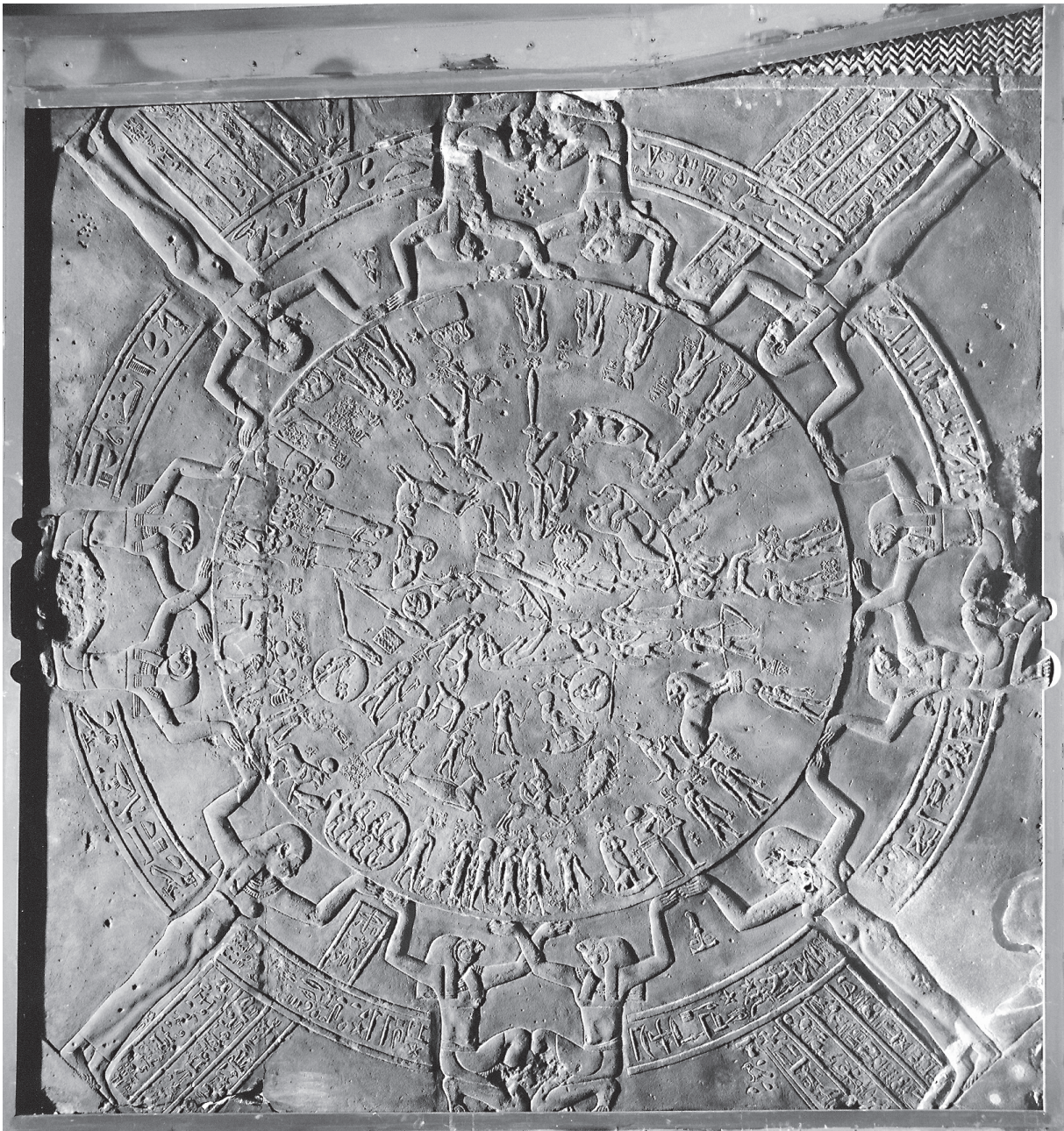
Fig. 1. Le zodiaque circulaire du temple d'Hathor à Dendera.